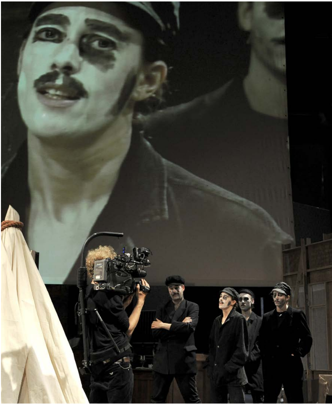
Gavrilo Princip De Warme Winkel