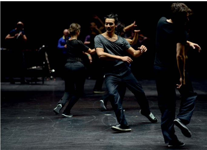
Vortex Temporum Anne Teresa De Keersmaeker, Rosas, Ictus

Als onderdeel van de basisinfrastructuur van het ministerie van OCW en van het Kunstenplan van de gemeente Amsterdam is het Holland Festival aangemerkt als onmisbare instelling. Met 42% eigen inkomsten voldeed het Holland Festival in 2014 ruim aan de eisen die het ministerie van OCW en de gemeente Amsterdam op dit gebied stellen. Deze aanvullende inkomsten zijn noodzakelijk om de kwaliteit en vernieuwing te brengen die publiek en subsidiënten van het Holland Festival verwachten, en waarmee het Holland Festival zich zo duidelijk onderscheidt.