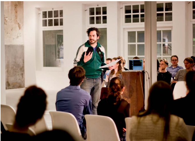
HF Young Academy

Het Holland Festival heeft geen eigen CAO. De CAO Theater van de Nederlandse Associatie voor Podiumkunsten (NAPK) wordt als richtlijn gebruikt. Het festival volgt de functie-indelingen en salaristabellen van deze CAO voor salariëring van het eigen personeel. Het Holland Festival heeft een pensioenregeling afgesloten met het Pensioenfonds Zorg en Welzijn (PFZW) en is aangesloten bij de werkgeversvereniging 'Werkgevers in de Kunsten'.