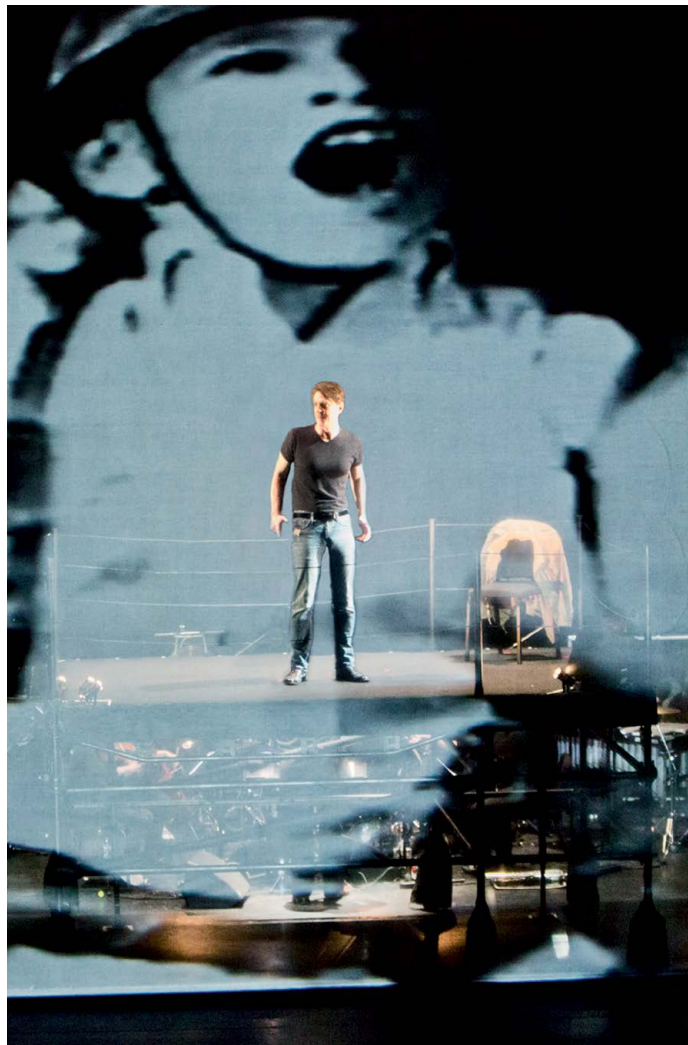
Soldier Songs David T. Little