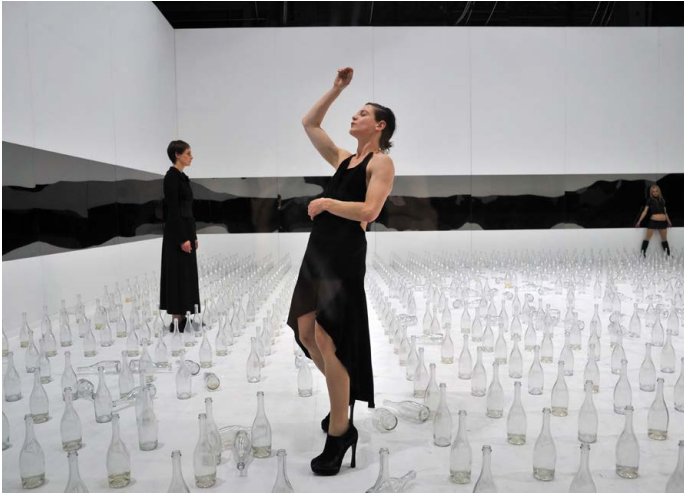
Die bitteren Tränen der Petra von Kant Rainer Werner Fassbinder, Martin Kušej, Residenztheater