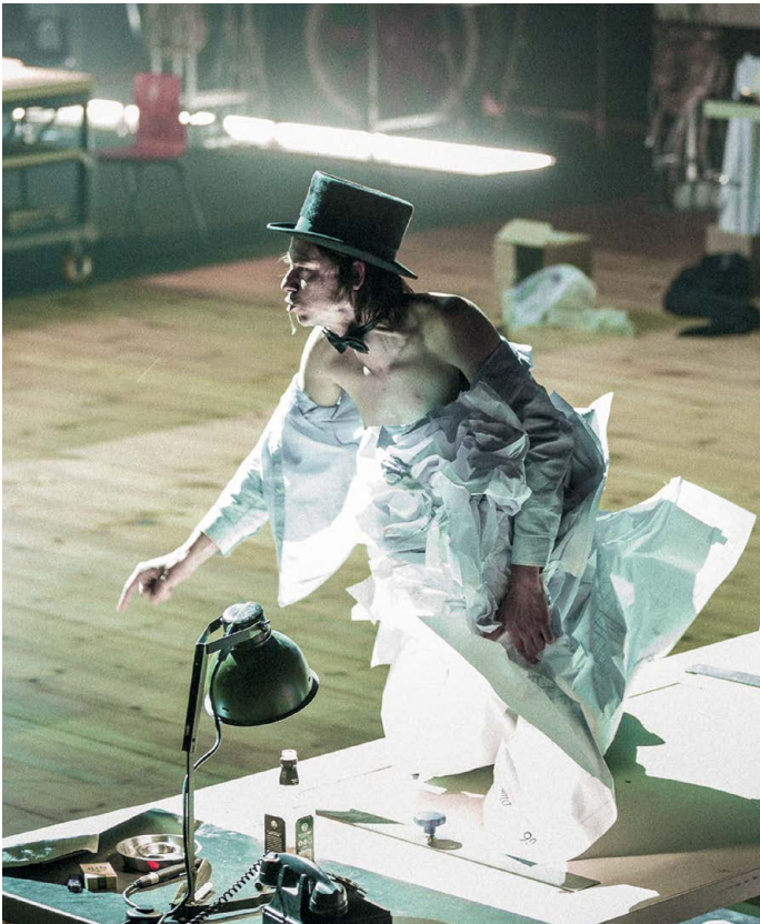
The Fountainhead Toneelgroep Amsterdam

Zakenbank Kempen & Co heeft zich vanaf 2014 ook aan het Holland Festival verbonden, met voor deze editie een bijdrage aan de voorstelling Winterreise .