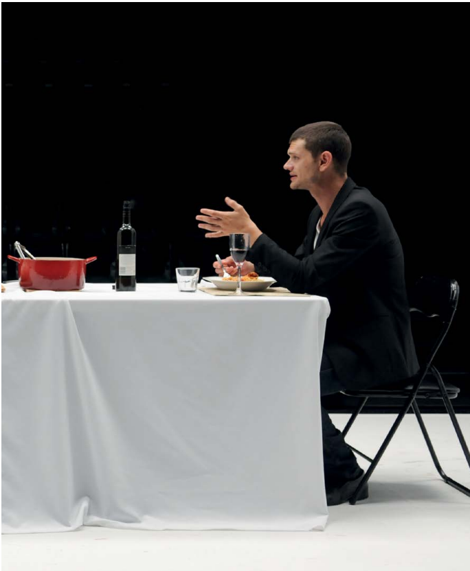
Thyestes Simon Stone, Belvoir Sydney

( www.hollandfestival.nl ), de programmapocket, outdoorcampagnes en radiospots. Vooraf en tijdens voorstellingen wordt het publiek geïnformeerd door middel van programmaboekjes en gratis uitdeelvellen.