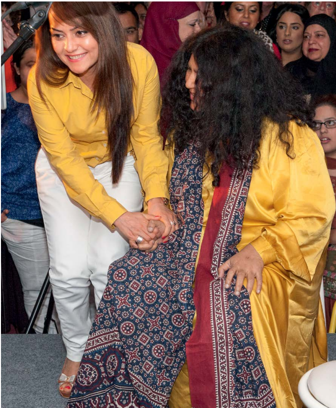
Meet the artist: Abida Parveen

hand genomen. De statuten van Stichting Holland Festival, de reglementen van bestuur en directie en het reglement van de Board of Governors zijn zorgvuldig bekeken en aangepast aan het nieuwe bestuursmodel. Daarbij heeft de Governance Code Cultuur geleid tot enkele aanpassingen en/of wijzigingen in de reglementen conform deze code. Ook in de personeelsregeling van het Holland Festival zijn daarmee samenhangende aanpassingen doorgevoerd. Het bestuur van het Holland Festival neemt de Governance Code Cultuur in acht. Het bestuur besloot af te wijken van hetgeen wordt bepaald in principe 6, punt 7: het openbaar maken van vacatures binnen het bestuur/de raad van toezicht. Besloten is vacatures pas openbaar te maken nadat gebleken is dat de 'sneeuwbalprocedure' in het eigen, brede netwerk geen relevante kandidaten oplevert.