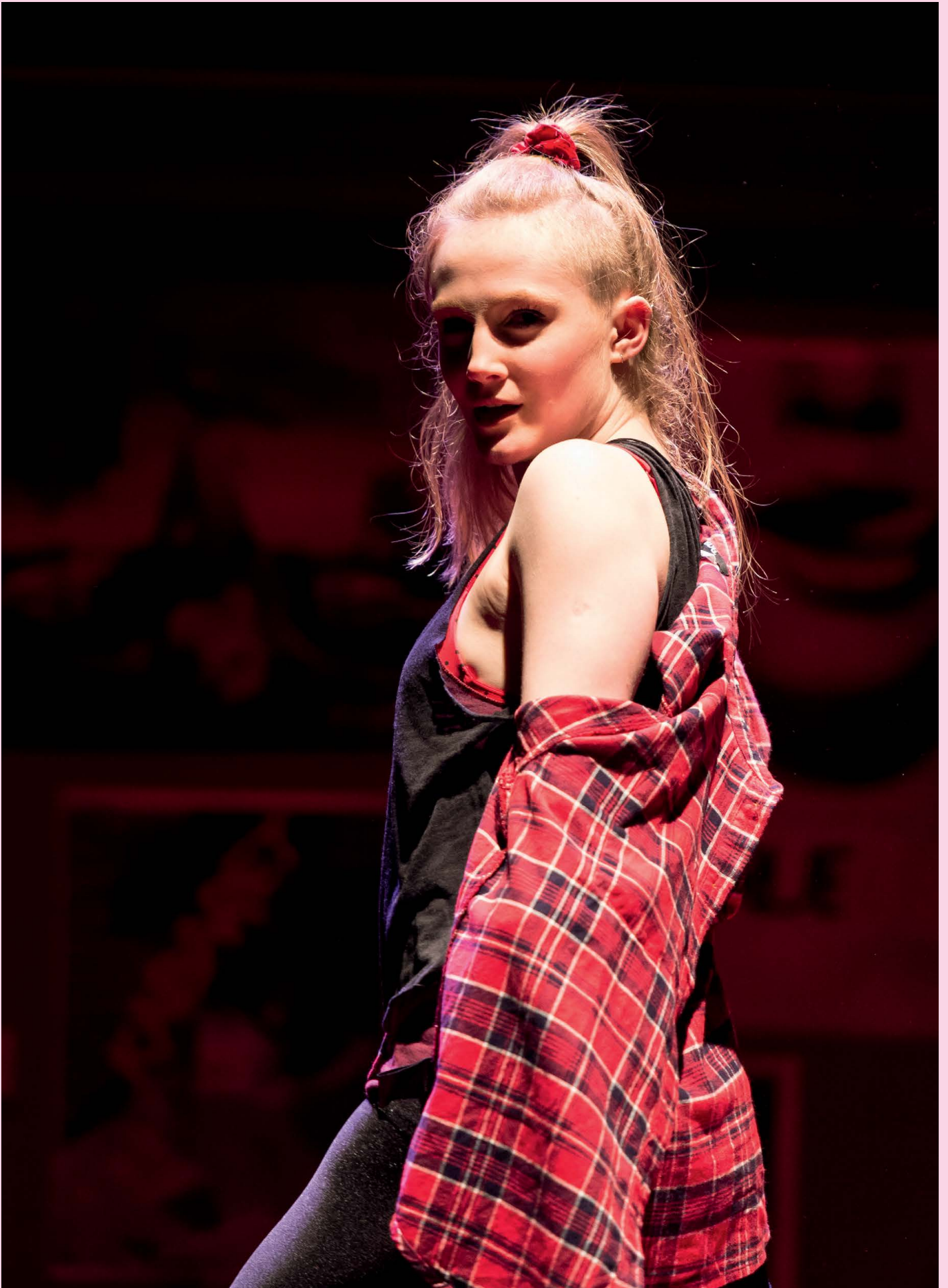
'Tis Pity She's a Whore Cheek by Jowl