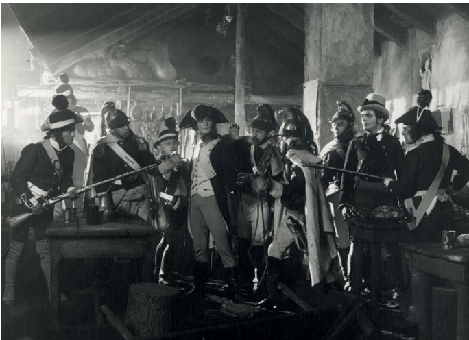
Napoleon Abel Gance