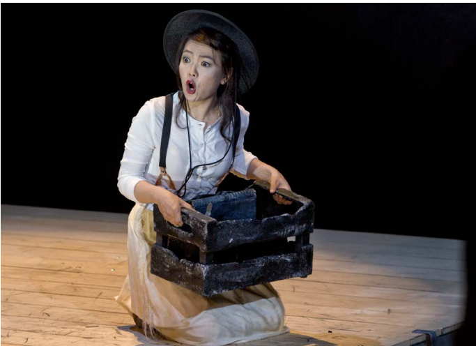
Orlando George Frideric Handel, De Munt, Brussel

2014 was voor de afdeling Communicatie & Marketing een ongebruikelijk jaar. Er werden vertrouwde doelen gesteld als een gemiddelde zaalbezetting van 80%, het genereren van zo veel mogelijk vrije publiciteit, het bereiken van nieuwe doelgroepen en het vergroten van het social mediaprogramma.