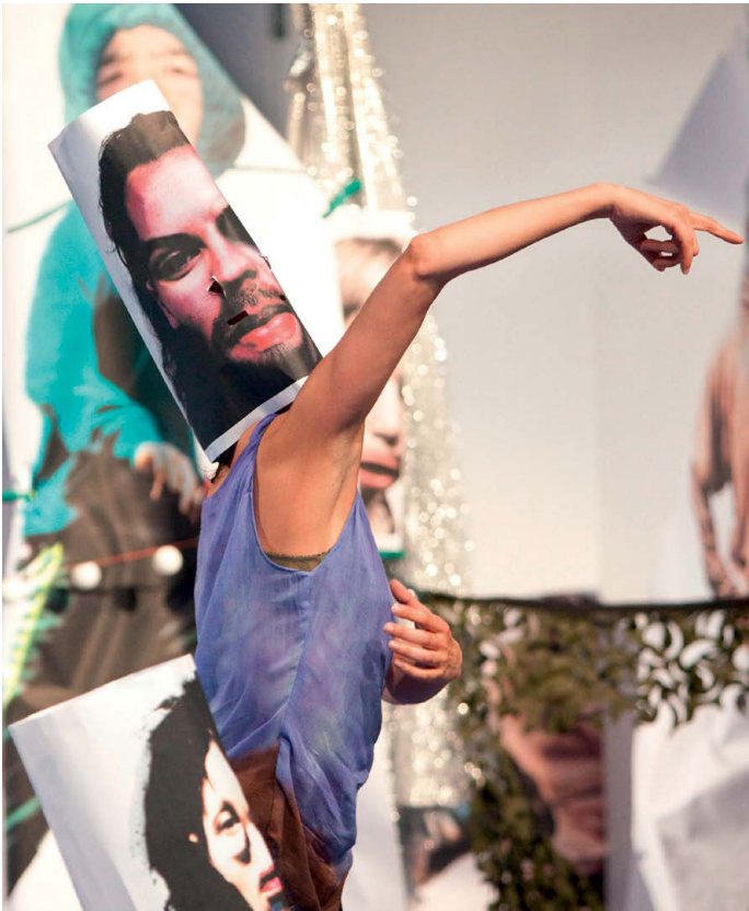
The Returns The Forsythe Company