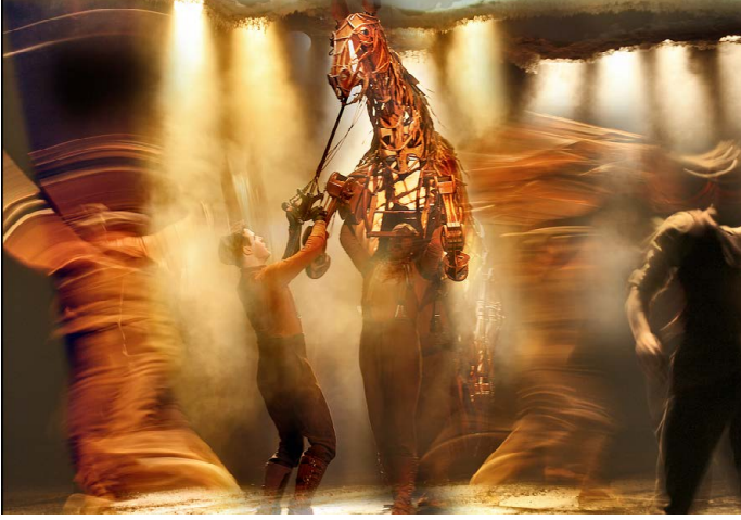
War Horse Stichting Theateralliantie, National Theatre of Great Britain