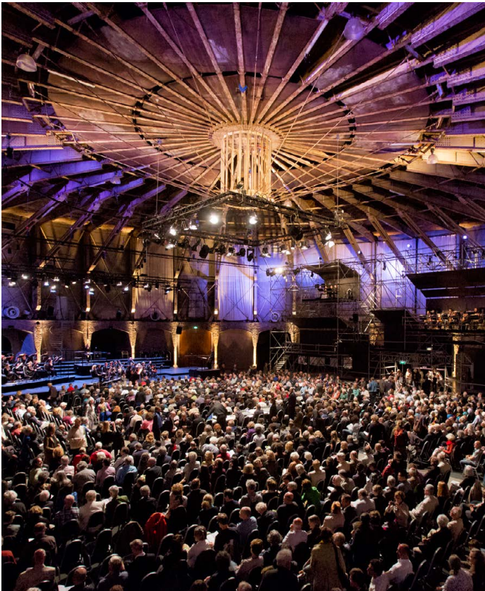
Prometeo Luigi Nono