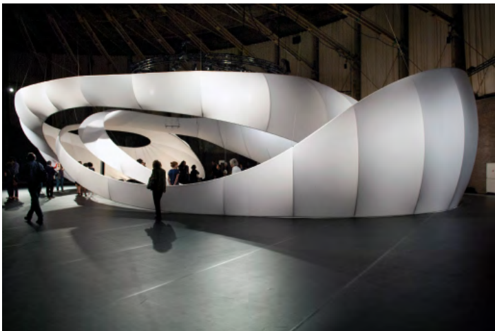
Het Zaha Hadid Architects Paviljoen in de Gashouder.

Choreografe Anne Teresa De Keersmaeker bevond zich op een keerpunt in haar carrière, en zocht naar een nieuwe manier van kijken, naar een nieuw samengaan van muziek en dans. Het Holland Festival bood het publiek de unieke gelegenheid de drie stappen in dit publieke proces mee te maken. Dat was niet voor iedereen een goed te volgen gebeurtenis, want wat zie je als je in het donker moet kijken? Wat is de impact van een zingende choreografe? Het drie-