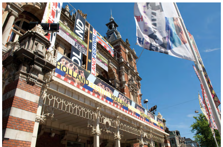
Aankleding Stadsschouwburg Amsterdam