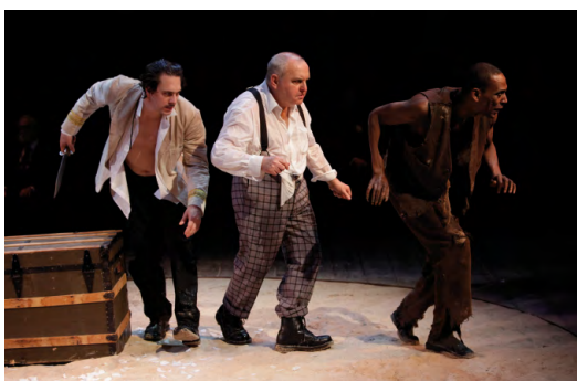
The Bridge Project / The Tempest – Sam Mendes