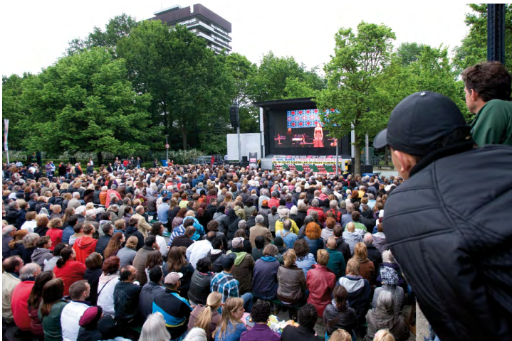
Opening Holland Festival live vanuit Carré op groot scherm in het Oosterpark.

Ook richtte het Holland Festival zich op Amsterdammers die een Stadspas bezitten. Voor hen werd een actie opgezet waarbij zij met hun Stadspascheque tegen sterk gereduceerd tarief een van de Beethovensymfonieën