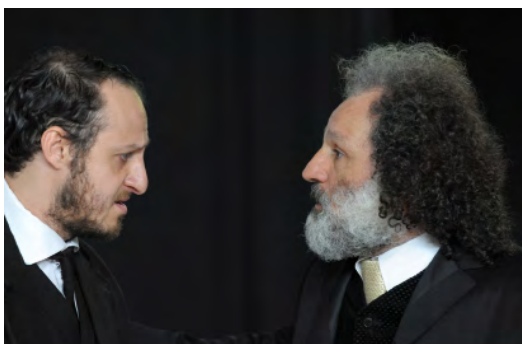
I Demoni – Peter Stein