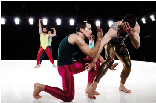
50 years of dance – Boris Charmatz