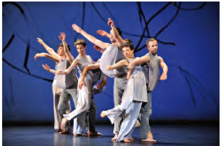
Pygmalion – Trisha Brown Dance Company en Les Arts Florissants

Daarnaast was het van belang om de bestaande doelgroepen van het Holland Festival niet uit het oog te verliezen. Namelijk: