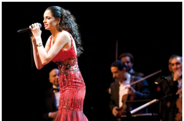
Amal Maher zingt liederen van Oum Kalthoum op de opening van Holland Festival 2010.

Een prominente plaats was ingeruimd voor het eerbetoon aan Oum Kalthoum. Het concert van de Egyptische zangeres Amal Maher vormde de opmerkelijke opening van de 63e editie van het Holland Festival. Het concert werd niet