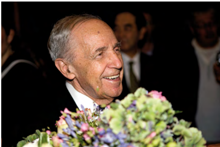
Componist en dirigent Pierre Boulez, na de uitreiking van de Edison Award.

private fondsen zoals het Prins Bernhard Cultuurfonds, de BankgiroLoterij, Hivos|NCDO en het VSB Fonds ondersteunden het Holland Festival met een aanzienlijke eenmalige bijdrage. Sponsorbijdragen ontving het festival van de Westergasfabriek, MeyerBergman, NIBC Bank N.V. en Citroën. Daarnaast steunden verschillende bedrijven het Holland Festival als bedrijfsvriend. In 2010 ging het om Accenture B.V., Beam Systems, Clifford Chance LLP, De Nederlandsche Bank N.V., DLA Piper, ING Groep, JRV Audiovisual, Koninklijke Ahold N.V., Liftinstituut B.V., Rabobank Nederland, Ten Have Change Management en WPG Uitgevers B.V. Ook ontving het festival bijdragen van publieke instellingen zoals de Amerikaanse Ambassade in Den Haag, CulturesFrance, Maison Descartes, het Goethe-Instituut en het Istituto Italiano di Cultura.