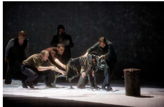
A Dog's Heart – De Nederlandse Opera