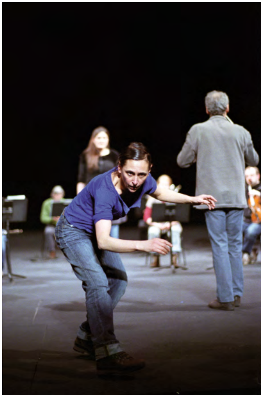
Abschied – Anna Teresa De Keersmaeker / Jérôme Bel