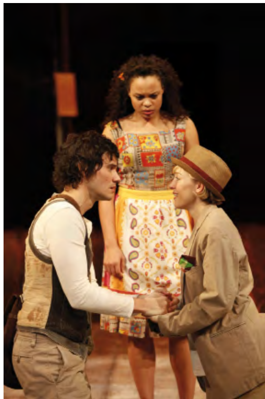
The Bridge Project / As You Like It – Sam Mendes