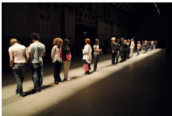
Teenage Lontano – Marina Rosenfeld en Amsterdamse scholieren

Desondanks bleek met name de samenwerking met de Open Schoolgemeenschap Bijlmer en het Barlaeus Gymnasium goed te lopen, en deden de jongeren een ervaring op die ze niet snel vergeten. Voor het Holland Festival opende dit project de deur naar een eigen manier om jongeren bij het festival te betrekken. De affiniteit van deze leeftijdsgroep bij het aanbod van het festival is niet vanzelfsprekend. Door actieve participatie aan een voorstelling worden drempels geslecht en wordt enthousiasme gekweekt. De kennismaking met een nog onbekende kunstvorm dankzij samenwerking met een buitenlandse artiest blijkt een avontuurlijke, aantrekkelijke onderneming. Voor deze vorm van educatie wordt ook in toekomstige edities naar projecten gezocht.