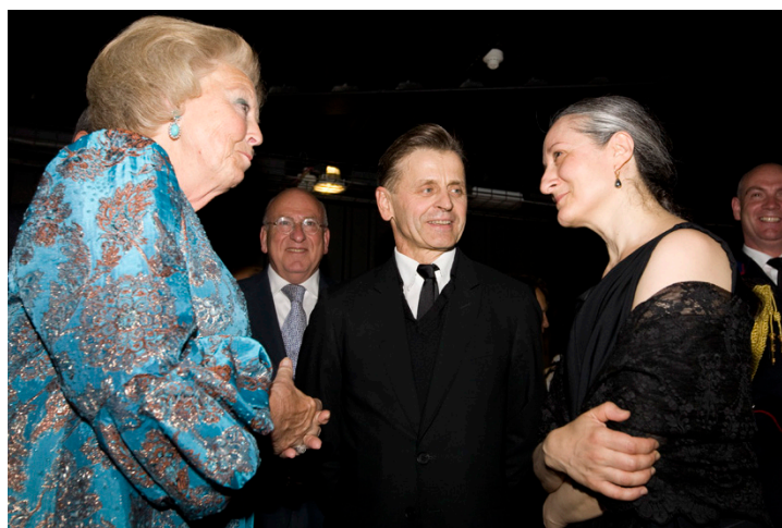
Koningin Beatrix met Mikhail Baryshnikov en Ana Laguna, de sterren van de opening van Holland Festival 2009

opvatting die Varèse zelf had over de uitvoering van zijn werk. Dankzij de vele partners en betrokkenen resulteerden de inspanningen in een weekend dat bij uitstek de festivalsfeer bood. Drie dagen dompelde het publiek zich onder in zeer uiteenlopende activiteiten met alle dezelfde leidraad: het werk van Varèse. Naast de grote avondvullende concerten met Askol|Schönberg, het Rotterdams Philharmonisch Orkest, Cappella Amsterdam en het beeldmateriaal van Gary Hill woonde het publiek een symposium bij in het Planetarium in Artis, waar ook de gerestaureerde versie van het Poème électronique werd gebracht met een 360°-projectie. In het Ketelhuis draaiden twee documentaires over het leven en werk van de componist en in de openlucht bracht de Veenfabriek met Kristal een hommage aan Varèse met het Sirene Orkest. Kristal werd gemaakt in opdracht van het Holland Festival. In de Zuiveringshal stond Teenage Lontano , het project met Amsterdamse jongeren van de Amerikaanse kunstenaar Marina Rosenfeld. Voor de opening van de Whitney Biennale creëerde zij een performance/installatie met jongeren uit New York. In Nederland benaderde het Holland Festival middelbare scholieren van drie verschillende opleidingen voor de uitvoering van dit project.