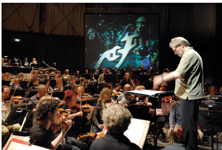
Varèse 360° – Askol/Schönberg, Rotterdams Philharmonisch Orkest, Cappella Amsterdam, Gary Hill