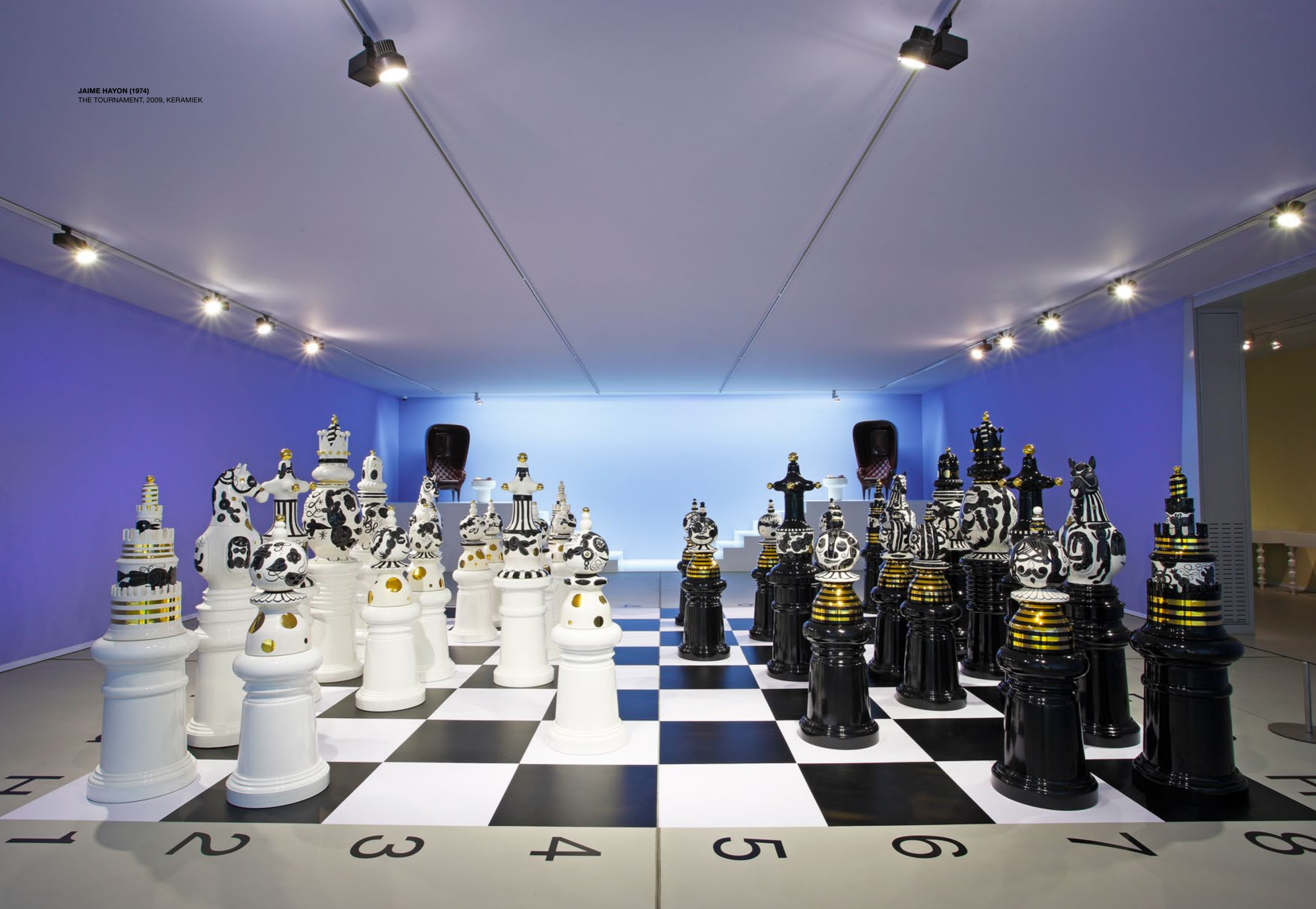
JAIME HAYON (1974) THE TOURNAMENT, 2009, KERAMIEK