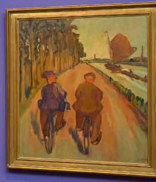
Small informational label below the large painting of the cyclists.