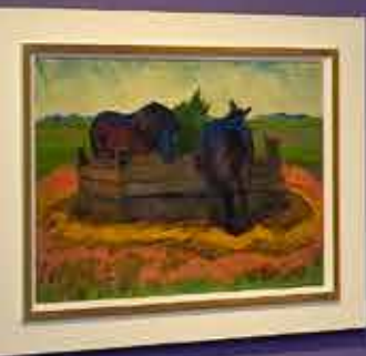
Small informational label below the painting of the horses.