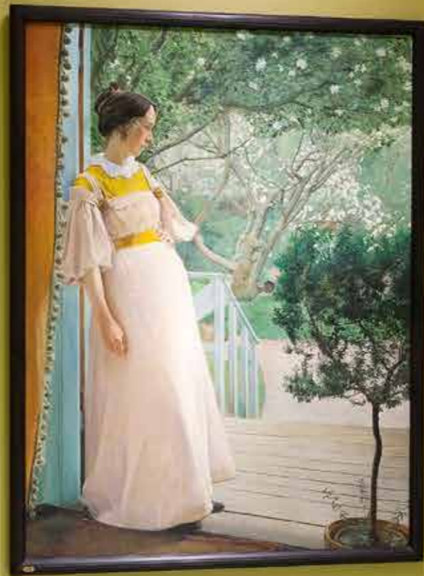
Information card for the painting in the center.