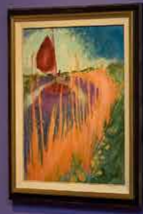
Small informational label below the painting of the landscape with a red structure.