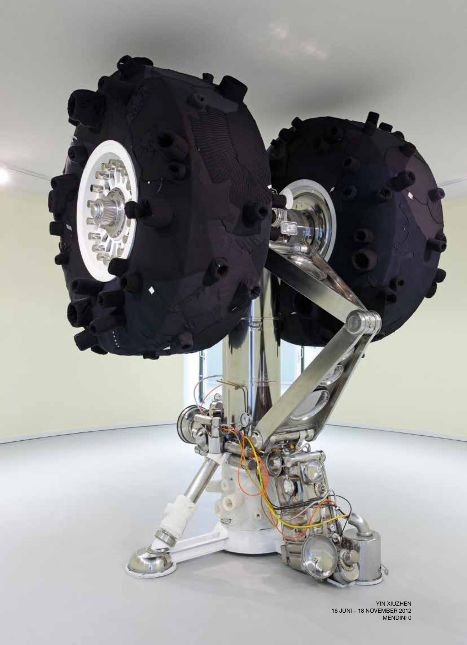
YIN XIUZHEN 16 JUNI - 18 NOVEMBER 2012 MENDINI 0