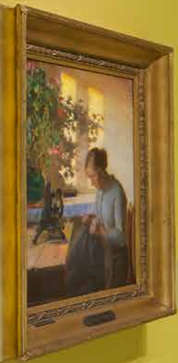
Information card for the painting on the left wall.