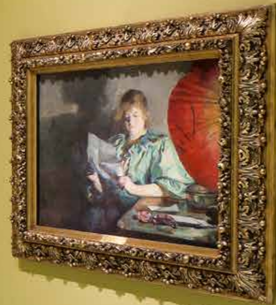
Small yellow label below the center painting.