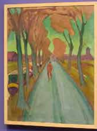
Small informational label below the painting of the path lined with trees.