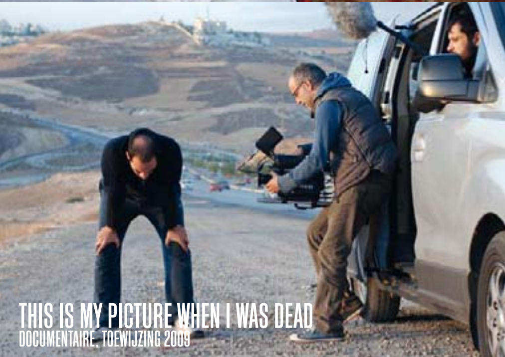
THIS IS MY PICTURE WHEN I WAS DEAD DOCUMENTAIRE, TOEWIJZING 2009