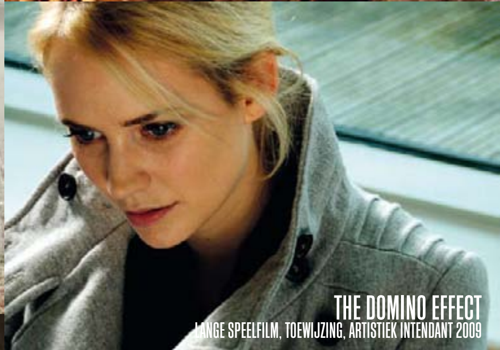
THE DOMINO EFFECT LANGE SPEELFILM, TOEWIJZING, ARTISTIEK INTENDANT 2009