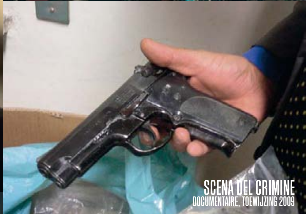
SCENA DEL CRIMINE DOCUMENTAIRE, TOEWIJZING 2009