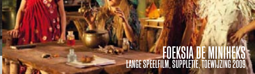
FOEKZIA DE MINIHEKS LANGE SPEELFILM, SUPPLETIE, TOEWIJZING 2009