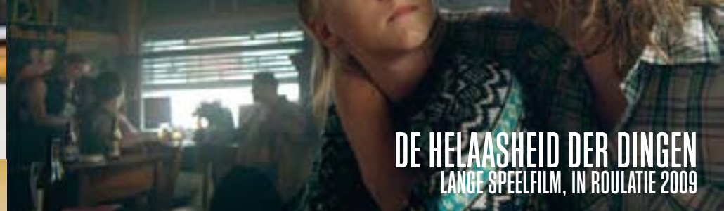
DE HELAASHEID DER DINGEN LANGE SPEELFILM, IN ROULATIE 2009