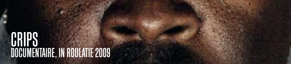
CRIPS DOCUMENTAIRE, IN ROULATIE 2009