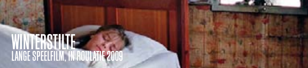
WINTERSTILTE LANGE SPEELFILM, IN ROULATIE 2009