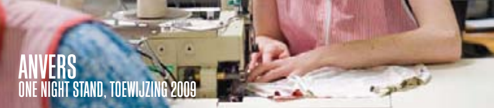
ANVERS ONE NIGHT STAND, TOEWIJZING 2009