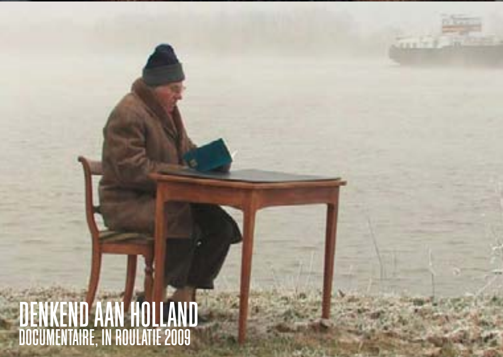
DENKEND AAN HOLLAND DOCUMENTAIRE, IN ROULATIE 2009