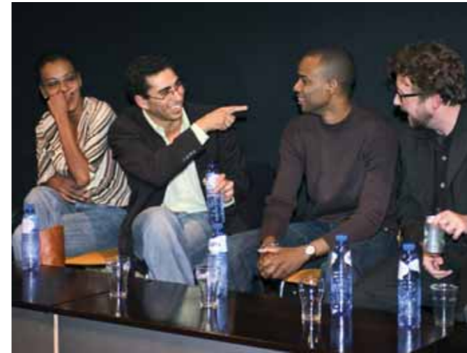
Discussie allochtone jongeren en film