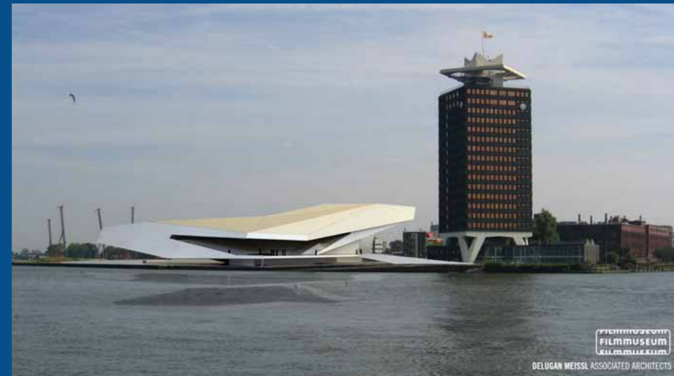
Schetsontwerp nieuwbouw Filmmuseum en Filmfonds, gezien vanaf Amsterdam Centraal Station

Het Filmfonds besluit eind 2004 te onderzoeken of het mogelijk is aan te haken bij de plannen van het Filmmuseum. Deling van faciliteiten en de wens om een hotspot voor film te versterken zijn de achterliggende gedachten. Bovendien zal de huur in Amsterdam-Noord aanzienlijk lager zijn. Het ministerie van OCW en de gemeente Amsterdam reageerden enthousiast op de samenwerking, die mogelijk een verdere concentratie kan inluiden van filminstellingen in Noord.