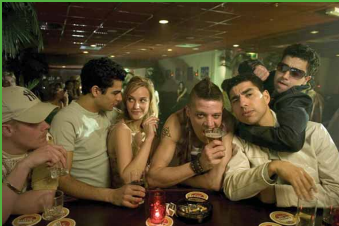
Het Schnitzelparadijs | Martin Koolhoven, regie | Marco van Geffen, scenario | Lemming Film