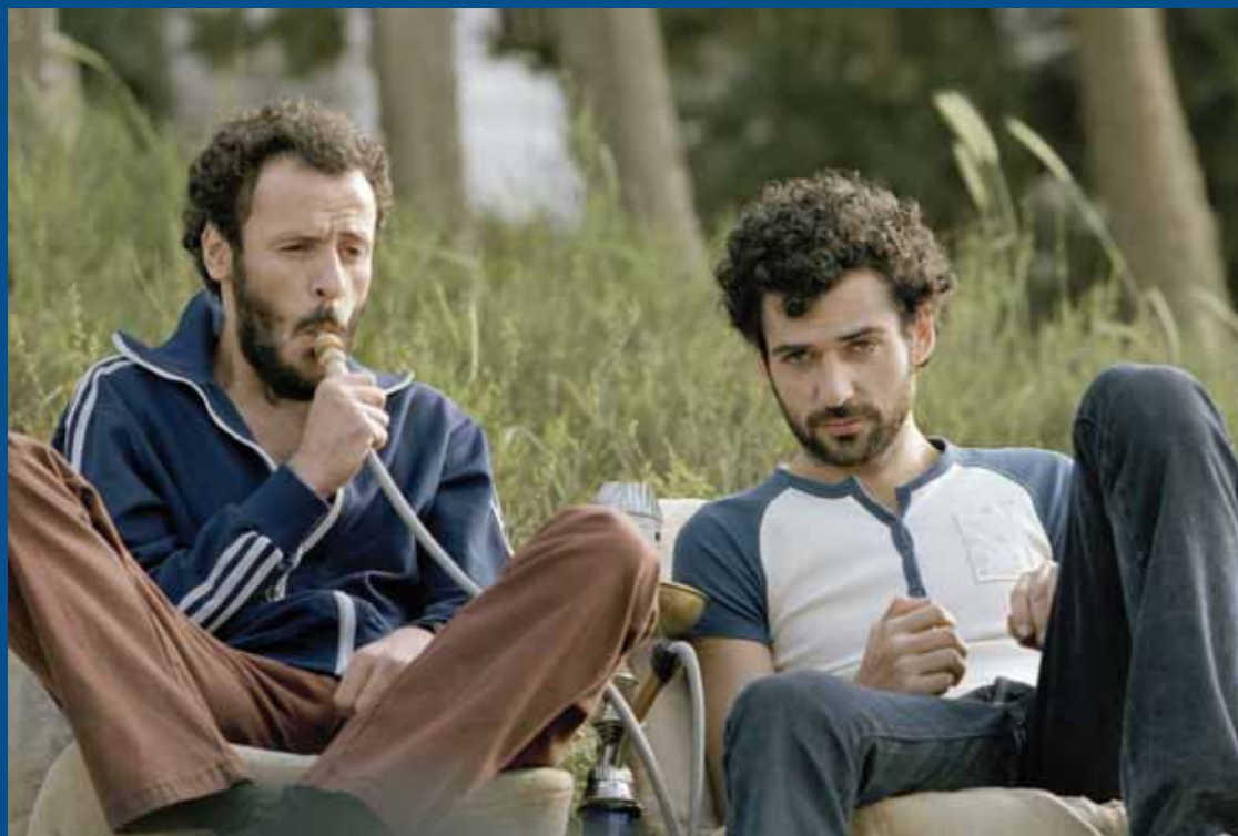
Paradise Now | Hany Abu-Assad, regie | Bero Beyer en Hany Abu-Assad, scenario | Augustus Film