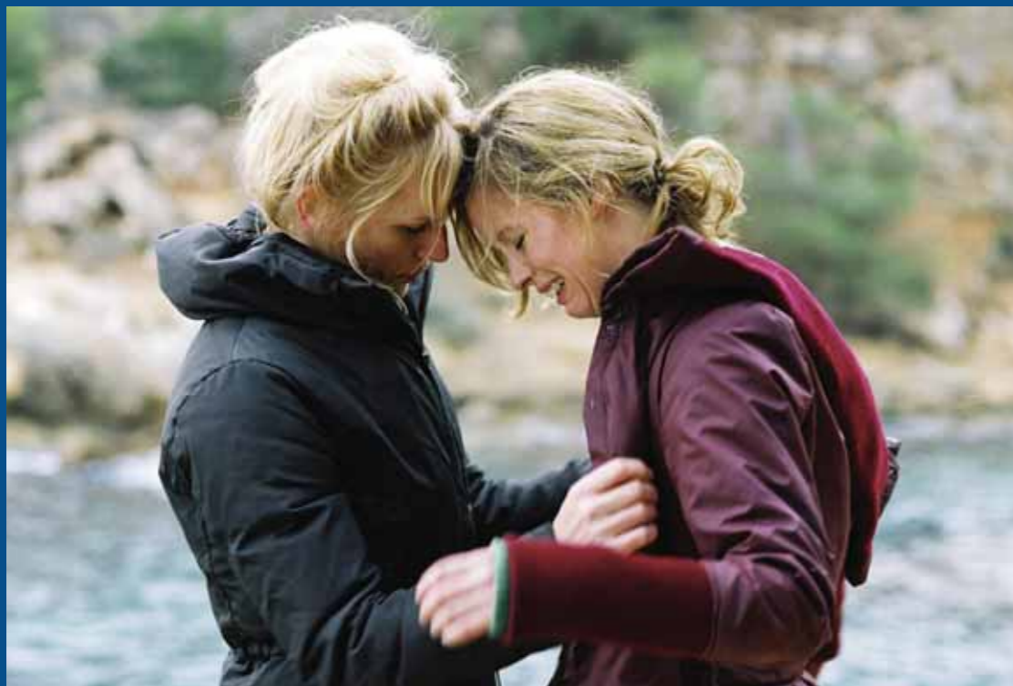
Guernsey | Nanouk Leopold, scenario en regie | Circe Films