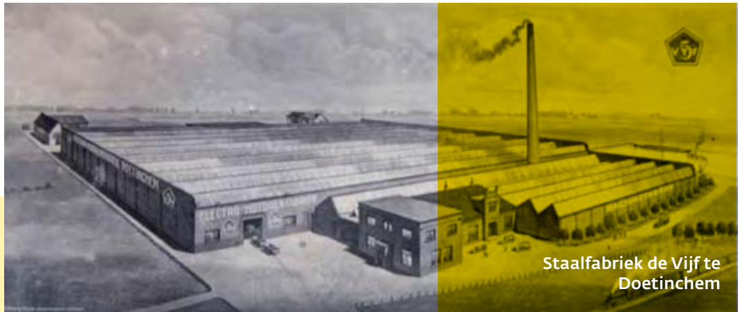
Staalfabriek de Vijf te Doetinchem

Wat het geheugen is voor ieder mens afzonderlijk, is erfgoed voor de samenleving als geheel. Zonder dit gezamenlijke geheugen weten we niet wat onze plaats is in de samenleving. De toekomst is hierdoor al even vaag en verward als het verleden. Erfgoed, voor een goede balans tussen dichtbij en ver, tussen vertrouwd en vreemd.