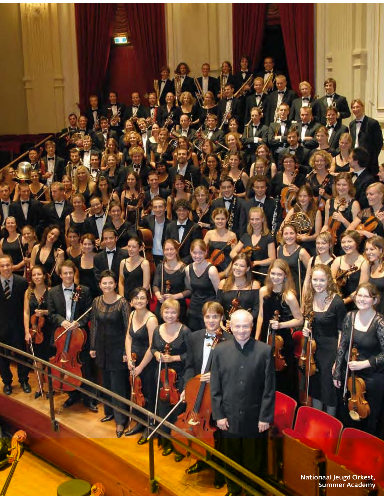
Nationaal Jeugd Orkest, Summer Academy