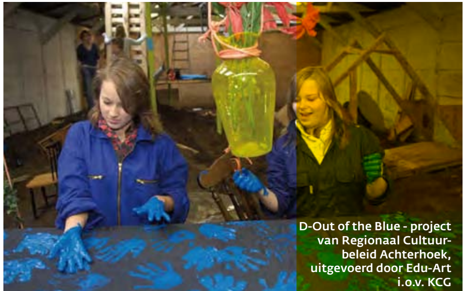
D-Out of the Blue - project van Regionaal Cultuurbeleid Achterhoek, uitgevoerd door Edu-Art i.o.v. KCG

De amateurkunst verandert. Vroeger was een amateur óf lid van een vereniging óf hij volgde een cursus bij een Centrum voor de Kunsten. De 'nieuwe' amateur is minder honkvast, werkt soms alleen, soms (tijdelijk) bij een vereniging, soms bij een school. De ambities van de amateur en de manier waarop hij daarmee omgaat, zijn duidelijk anders geworden. Dit betekent