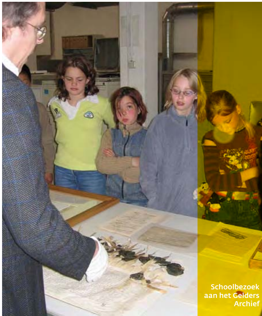
Schoolbezoek aan het Gelders Archief

Het verleden nemen we met ons mee, vaker en indringender dan we misschien denken. Soms is erfgoed direct waarneembaar en elke dag om ons heen. Voorbeelden zijn monumenten, het historische landschap of de waardevolle collecties in musea. Maar soms is erfgoed ook indirect aanwezig, het zit als het ware in ons hoofd . Dit is het immateriële erfgoed. Voorbeelden zijn de streektaal, allerlei in het verleden gegroeide gebruiken en onze geschiedenis zoals die in talloze boeken staat.