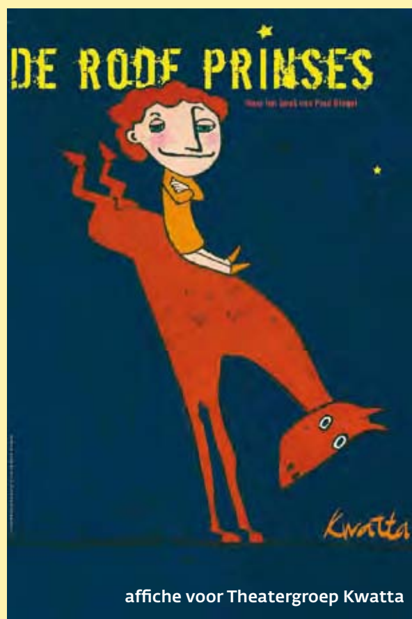
affiche voor Theatergroep Kwatta