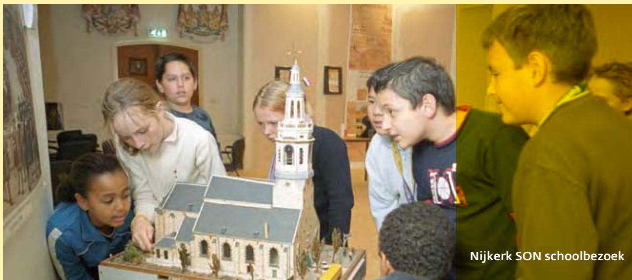
Nijkerk SON schoolbezoek