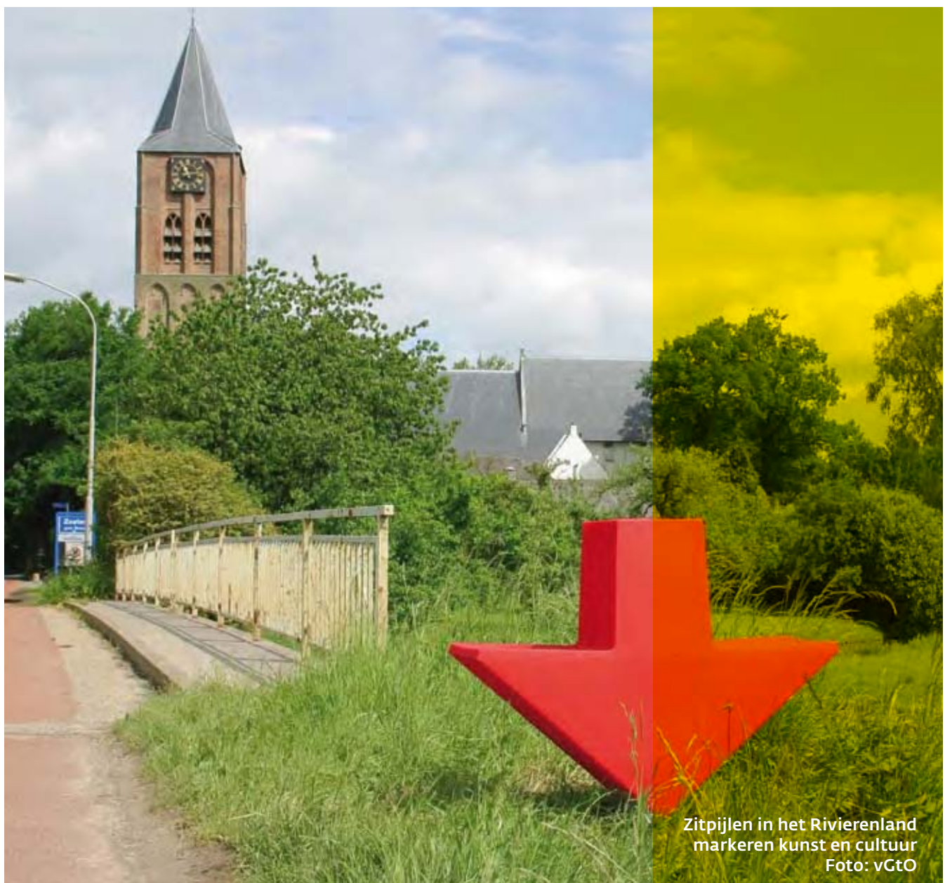
Zitpijlen in het Rivierenland markeren kunst en cultuur

Wij beginnen met groepen die nog een klein duwtje nodig hebben of waar belangrijke kansen liggen. Dit zijn gezinnen met kinderen in de basisschoolleeftijd, jongeren van 16-20 jaar en amateur beeldende kunstenaars. Daarna richten we ons op publieksgroepen die een grotere afstand moeten overbruggen. De Geldstroom beeldende kunst en vormgeving van het Rijk is met ingang van 2009 alleen voor de vier grootste steden in Gelderland (Apeldoorn, Arnhem,