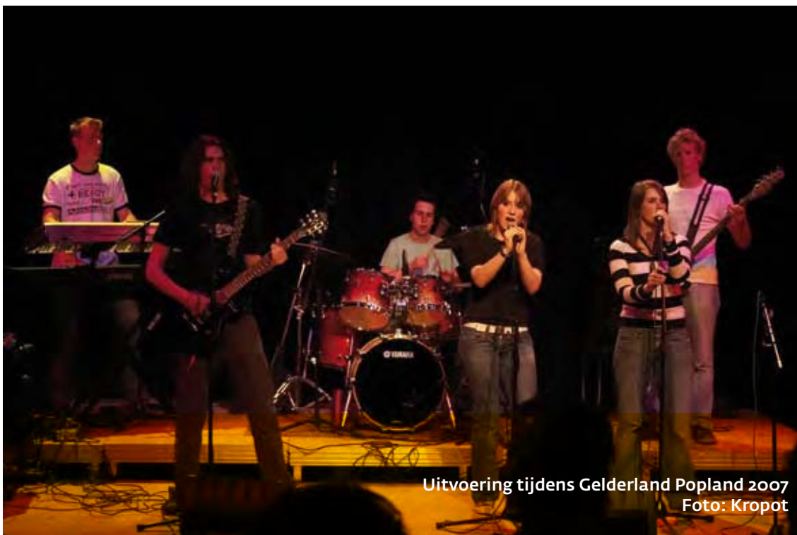
Uitvoering tijdens Gelderland Popland 2007

Het moet gaan om projecten met een effect op de lange termijn voor de culturele relatie met Noordrijn-Westfalen. Daarom cofinancieren wij ook cultuurprojecten in het kader van het Europese Interregprogramma. In de komende jaren willen wij intensiever samenwerken met de Kulturraum Niederrhein. Deze organisatie is actief in het gebied tussen de grens en het Ruhrgebied en is daarom geografisch en qua schaal een natuurlijke partner.