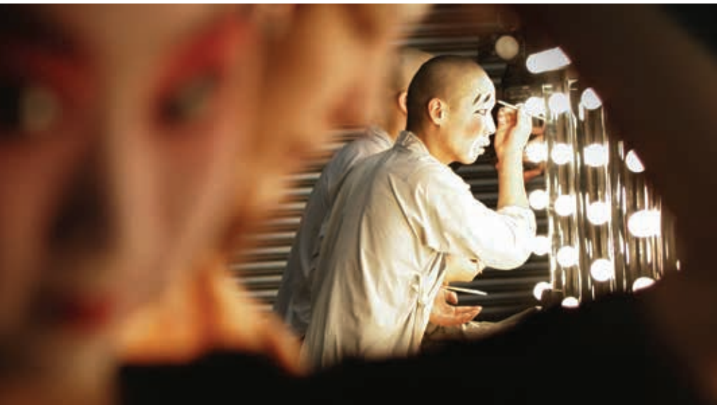
Beijing Opera School

entered into a long-term co-operative partnership with Challenge. In the autumn of 2012 a CD series of Amsterdam opera productions was launched with the issue of the Elektra CD, recorded live by The Amsterdam Music Theatre audiovisual service during performances of De Nederlandse Opera in 2011. The result was highly acclaimed by the international press.