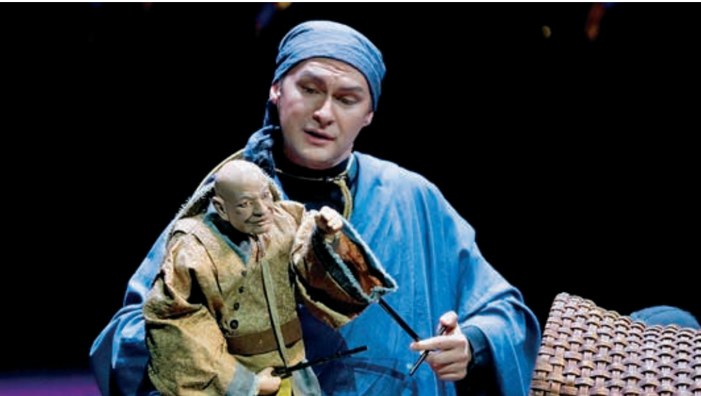
De nachtegaal en andere fabels