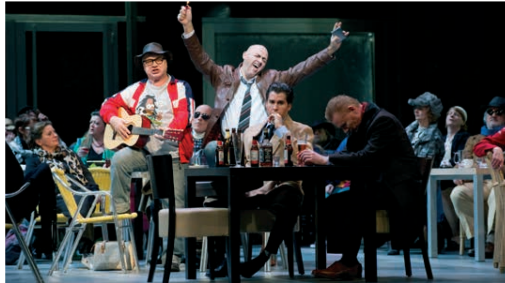
De legende van de onzichtbare stad Kitesj en het meisje Fevronja

By far the most significant development involving the organisation was the merging of the three foundations, The Amsterdam Music Theatre, The Dutch National Ballet and De Nederlandse Opera. During the past three years (2010-2012) preparations