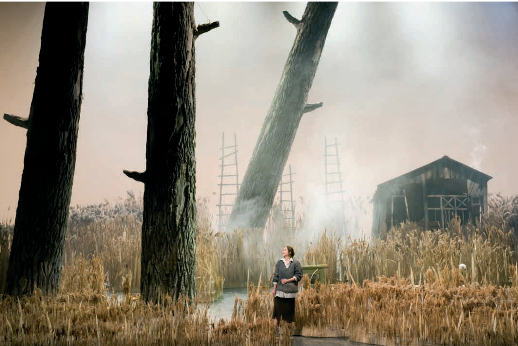
De legende van de onzichtbare stad Kitesj en het meisje Fevronja