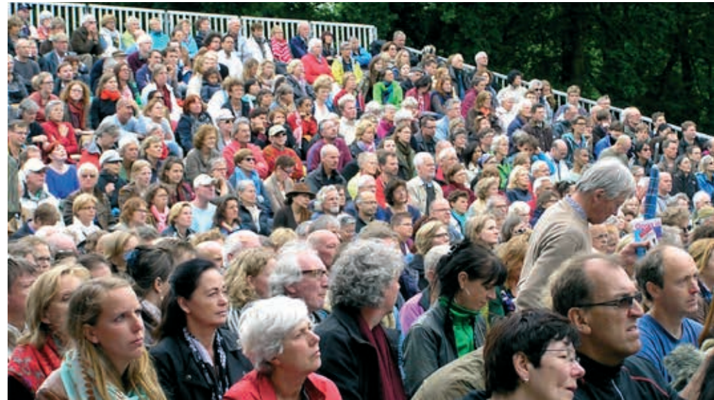
Parsifal in het Park

Despite the effects of the government cutbacks we have a positive attitude to the future. The merged Foundation The Amsterdam Music Theatre embarks on a new phase in 2013 with fresh élan and in a healthy financial state. The resident companies De Nederlandse Opera and The Dutch National Ballet enjoy a strong position. Their world-class status and great international renown results in many collaborative projects with fellow institutions and media companies throughout the world. The merged organisation is capable of positioning itself more strongly and unequivocally as a national and international top-notch institution for opera and ballet. The presently available experience, know-how and extreme professionalism in a variety of specialised areas that are necessary for fulfilling the mission provide a solid basis for strengthening the ties with a broad public and other interested parties.