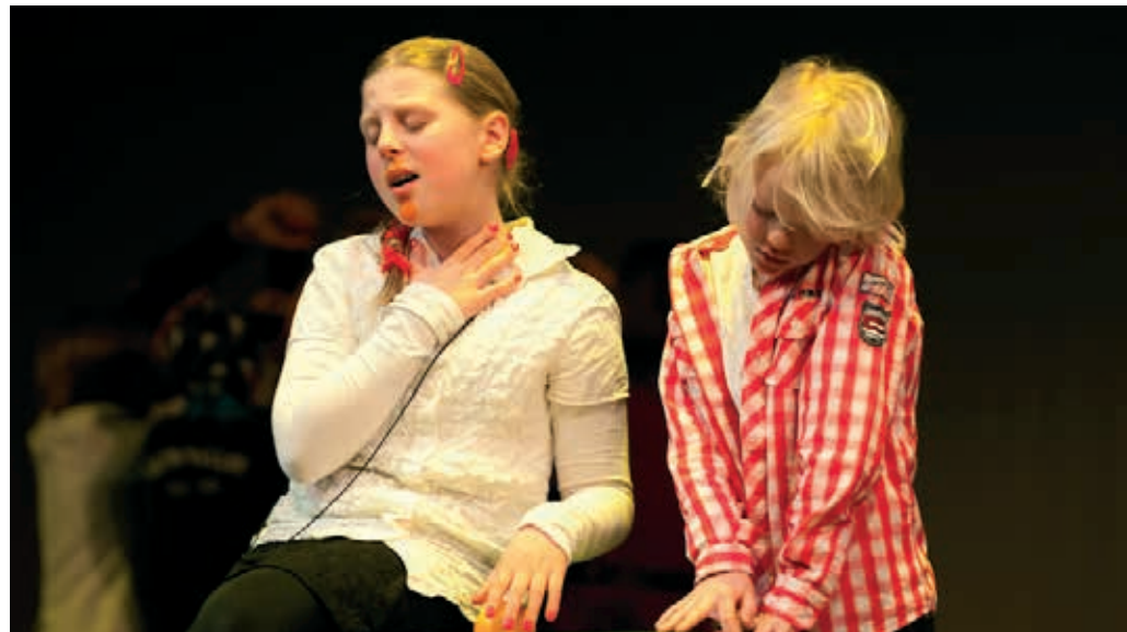
Zingen bij De Nederlandse Opera

In 2012 the second edition took place of the large-scale participation project Singing at De Nederlandse Opera , which aims to arouse people's enthusiasm for classical singing and the artistic riches of the opera art form in an accessible manner. A total of 544 people sang in the project. Besides the Big Choir and the Advanced Choir, this year there was also a Children's Choir for