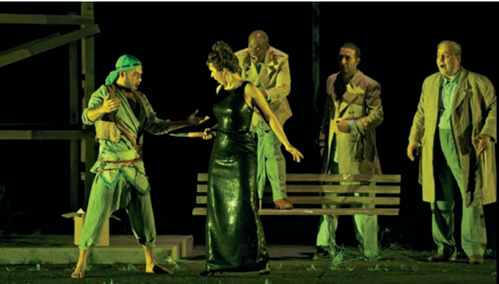
Il turco in Italia

has been given a new look as of September. The traditional photograph yearbook financed by the Friends and reviewing the 2011-2012 season appeared in September. At the Christmas Matinee the Prix d'Amis was awarded to Olga Peretyatko for her role in Il turco in Italia . Kitez was pronounced the Friends' favourite production. The prizes were announced before the start of the Christmas Matinee by means of a short film produced in collaboration with The Amsterdam Music Theatre audiovisual service. The annual financial contribution to De Nederlandse Opera was used to finance the pre-performance introductions and the cast gathering following the final performance of a production, among other things.