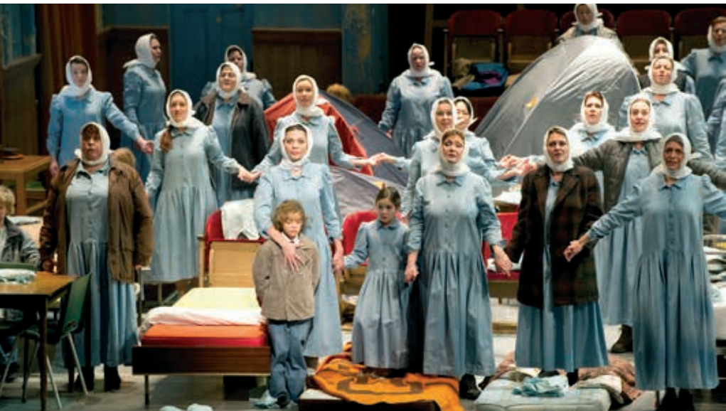
De legende van de onzichtbare stad Kitesj en het meisje Fevronja

were made for the merger, which came into effect with the commencement of the current 2013-2016 arts subsidy plan. This has cost management, staff and the Supervisory Board a great deal of time and effort. The merging process took place smoothly, aided by the constructive attitude of both subsidising parties.