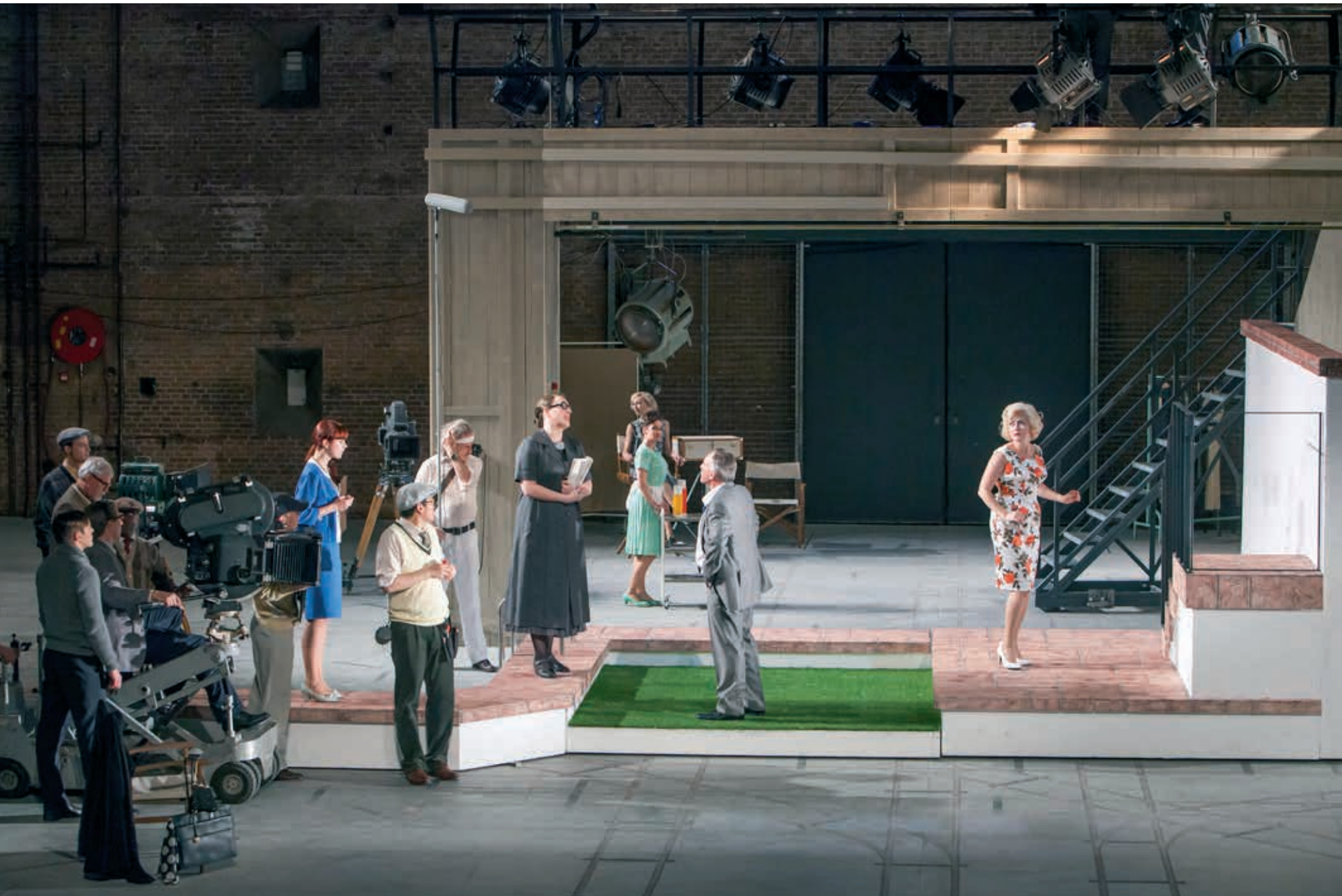
Waiting for Miss Monroe