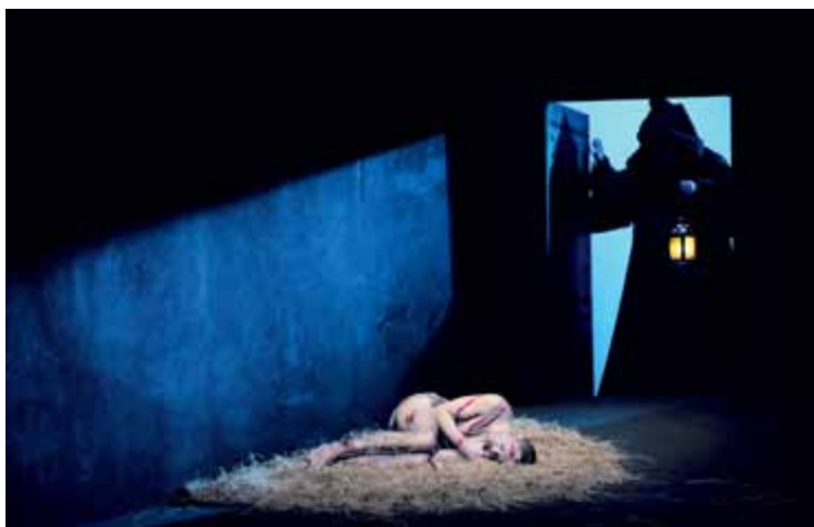
Il prigioniero | Hertog Blauwbaards burcht

landse Opera and the Netherlands Philharmonic Orchestra, with its stirring masses of sound, the interpretation of Beethoven's only opera Fidelio by the future chief conductor Marc Albrecht was as analytical and transparent as it was moving.