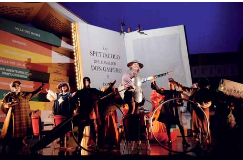
Don Chisciotte in Sierra Morena

meten aan de verhouding daarvan tot de nieuwste ontwikkelingen in de kunstvorm. Daarom ziet De Nederlandse Opera het als haar plicht om het publiek elk jaar een wereldpremière te presenteren. Met Alexander Raskatovs opera A Dog's Heart oogstte het gezelschap daarbij een verrassende triomf. Het was niet alleen de eerste opera van de Russische componist, wiens stijl in de traditie van Dmitri Sjostakovitsj ( De neus ) en Alfred Schnittke ( Life with an Idiot ) staat – beide werken waren bij De Nederlandse Opera te zien – maar ook de eerste opera-encensering van de beroemde Engelse toneelregisseur Simon McBurney. Zijn specifieke, in het Russische constructivisme wortelende verteltrant en de combinatie met het tegelijkertijd vervreemdende en aansprekende poppenspel maakten deze voorstellingen tot een bijzondere belevenis. Overweldigende reacties leidden tot een grote belangstelling van de kant van internationale operahuizen, met uitnodigingen naar Londen (English National Opera, september 2010), New York (Metropolitan Opera), Lyon en Madrid. Hierdoor werd de internationale reputatie van De Nederlandse Opera weer eens bevestigd en versterkt. De haalbaarheid van uitvoeringen in Rusland, het land waar het verhaal van deze opera is ontstaan en tevens het vaderland van de componist, wordt nog onderzocht.