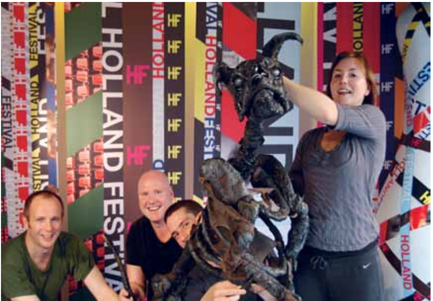
A Dog's Heart in De Bijenkorf Amsterdam