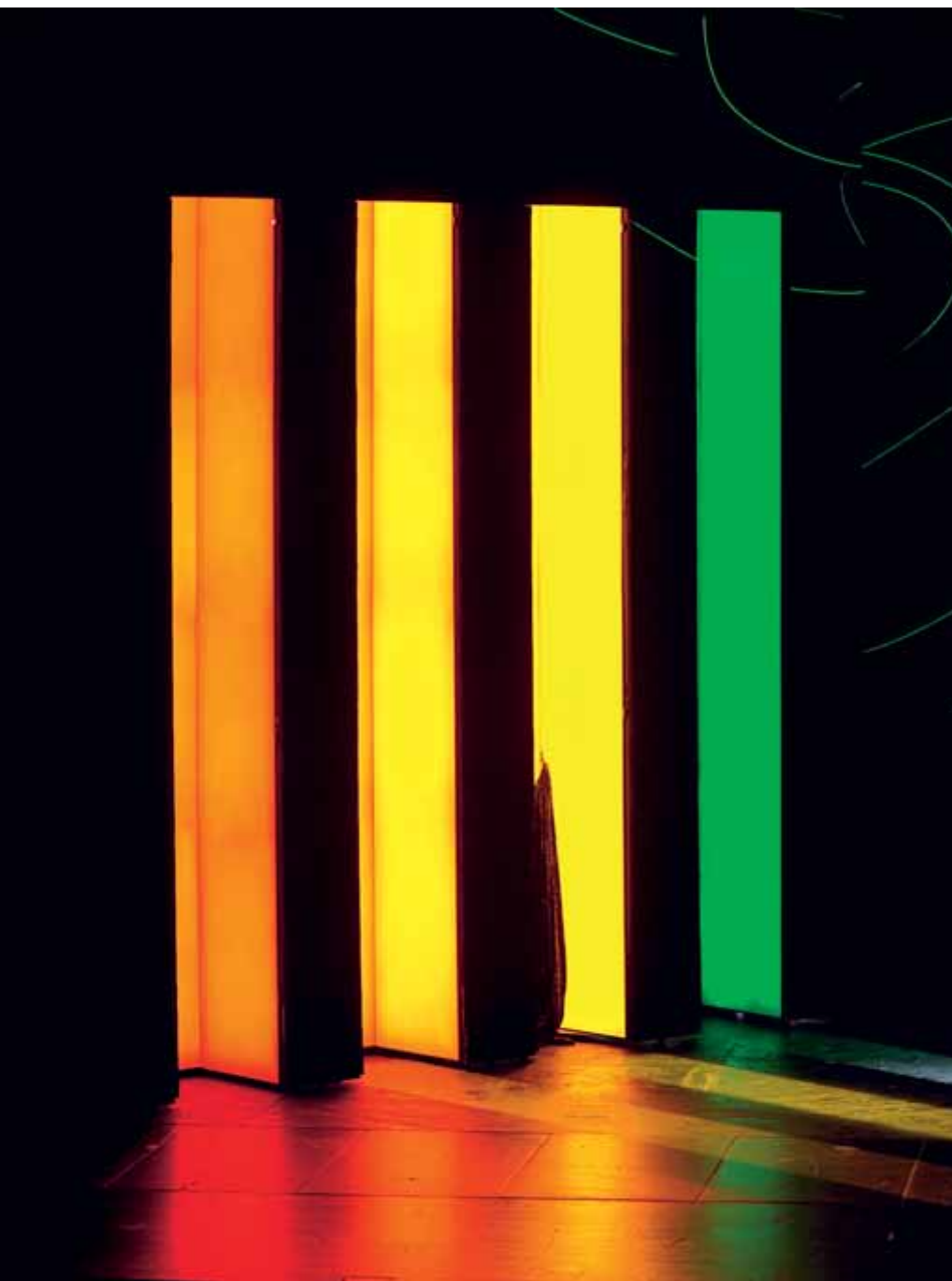
Il prigioniero | Hertog Blauwbaards burcht