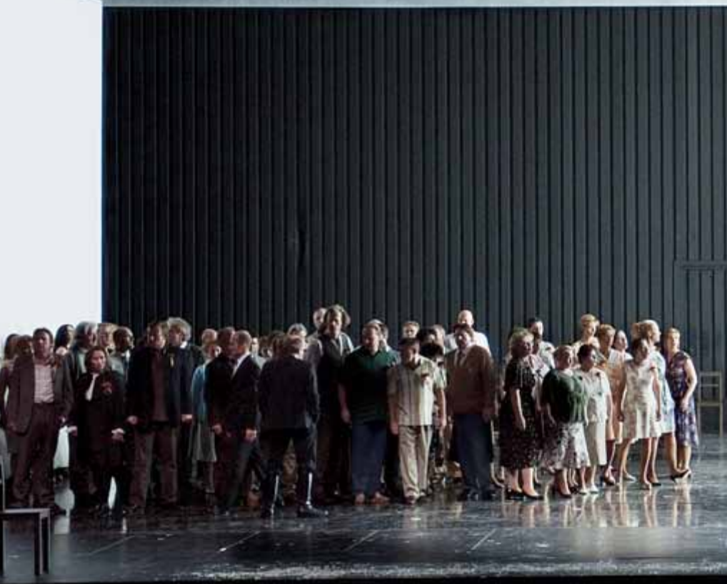
Les vêpres siciliennes