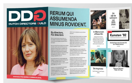
Voorbeeld van huisstijl, veel mogelijkheden met verschillende kleuren