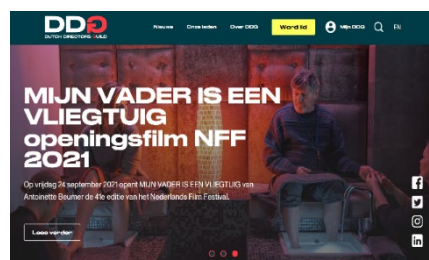
Het nieuwe websitedesign