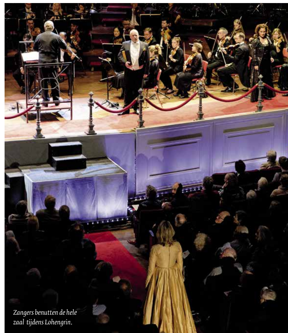
Zangers benutten de hele zaal tijdens Lohengrin.