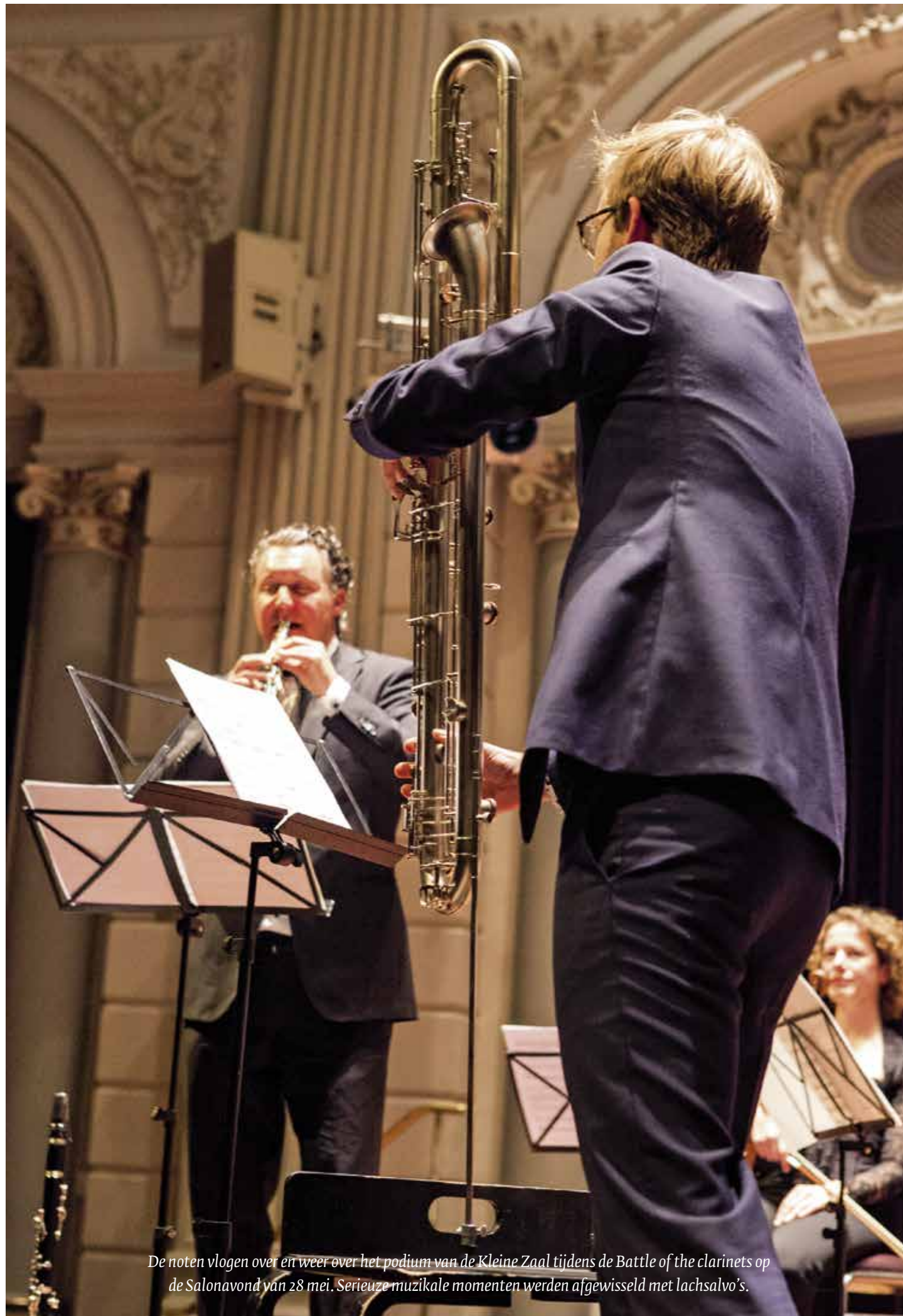
De noten vlogen over en weer over het podium van de Kleine Zaal tijdens de Battle of the clarinets op de Salonavond van 28 mei. Serieuze muzikale momenten werden afgewisseld met lachsalvo's.