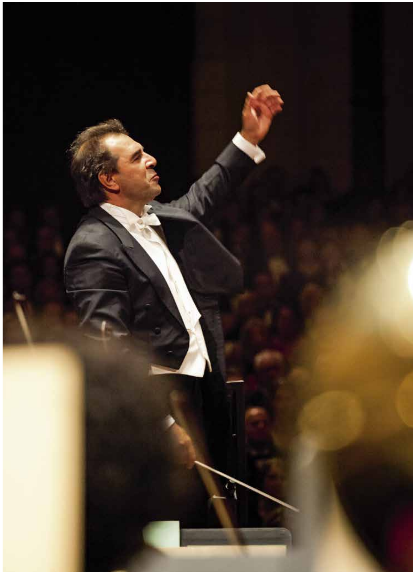
De Opening Night op 10 september was een van de nieuwe initiatieven van 2015. Toekomstig chef-dirigent Daniele Gatti leidde het orkest in aanwezigheid van het koninklijk paar. Het concert werd in 51 landen uitgezonden.