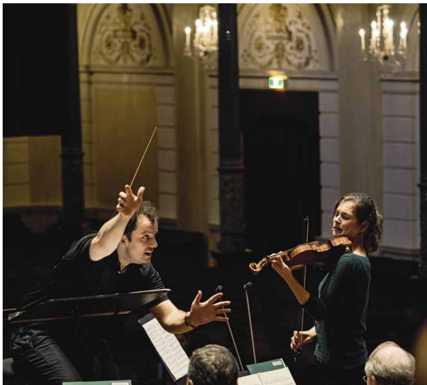
Zeer intens was de samenwerking tussen dirigent Andris Nelsons en violiste Janine Jansen in het Eerste vioolconcert van Béla Bartók op 16 september. 'Klik van Andris Nelsons met het Koninklijk Concertgebouworkest voelbaar', kopte de NRC een dag later.