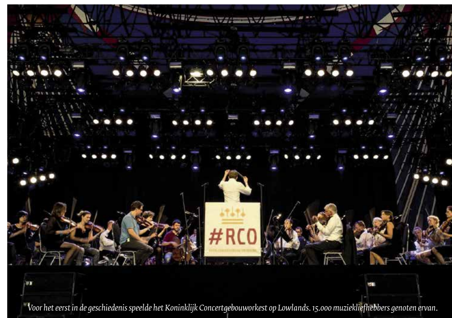
Voor het eerst in de geschiedenis speelde het Koninklijk Concertgebouworkest op Lowlands. 15.000 muzikiefliefhebbers genoten ervan.