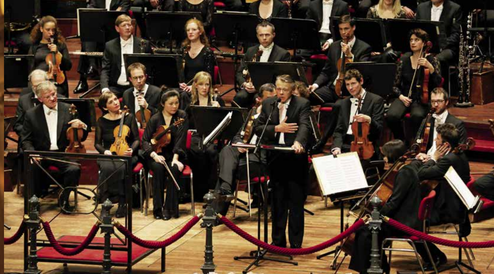
'Ik heb voor jullie gespeeld, publiek. Jullie waren fantastisch: deskundig, ontwikkeld, enthousiast. Dit is een geweldig orkest. Blijf het steunen. Alstublieft. Het is een schat.'