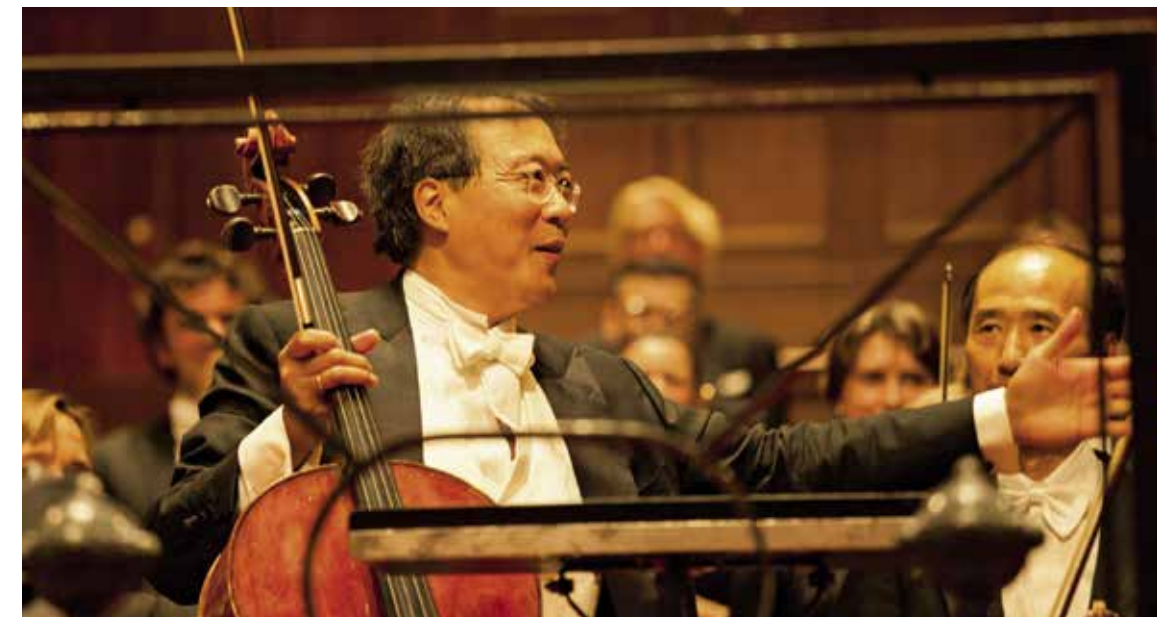
Cellist Yo-Yo Ma vierde dat hij na 20 jaar weer terug was bij het Koninklijk Concertgebouworkest. Samen met de cellogroep kreeg hij met de toegift El cant dels ocells van Pablo Casals de Grote Zaal aan zijn voeten.

Veel donateurs ontmoetten elkaar, de musici en andere gasten op de Opening Night, een van de nieuwe initiatieven die het Koninklijk Concertgebouworkest dit jaar ontplooidde. Toekomstig chef-dirigent Daniele Gatti leidde de seizoenopening in stijl op 10 september, in aanwezigheid van beschermvrouwe Koningin Máxima. Een Grote Zaal in black tie luisterde onder meer naar stercellist Yo-Yo Ma die voor het eerst in twintig jaar weer met het Koninklijk Concertgebouworkest speelde en met een toegift samen met de cellogroep de zaal betoverde. Veel Global Friends maakten gebruik van het aanbod naar Nederland te komen om elkaar en andere muzikliefhebbers te ontmoeten.