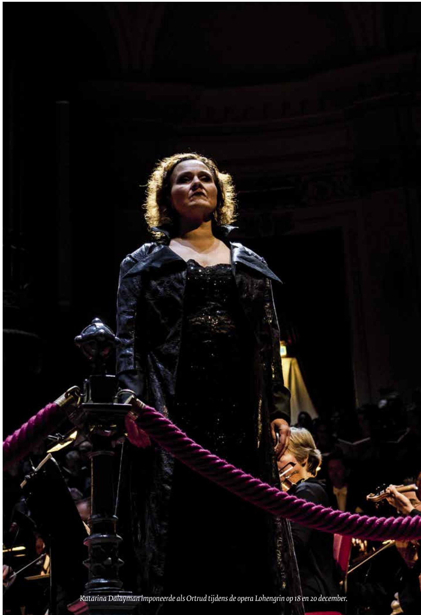
Katarina Dalayman imponeerde als Ortrud tijdens de opera Lohengrin op 18 en 20 december.