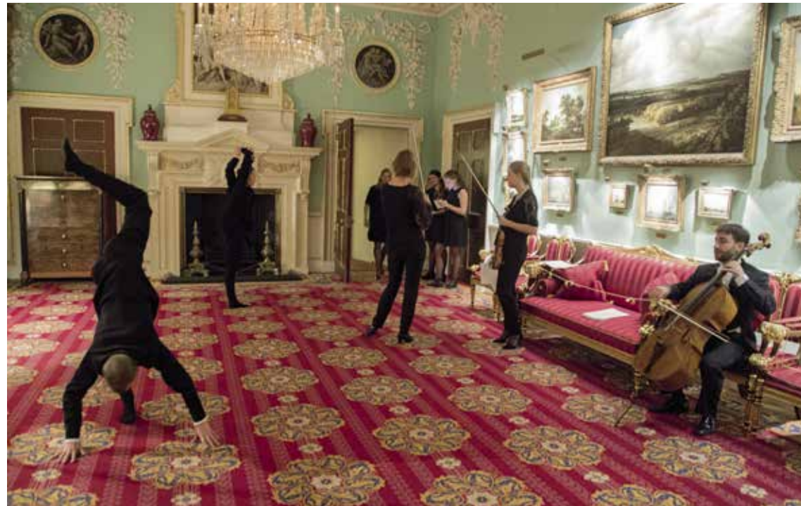
Samen met dansers van het Nederlands Dans Theater doen musici uit het orkest een warming-up in Londen.