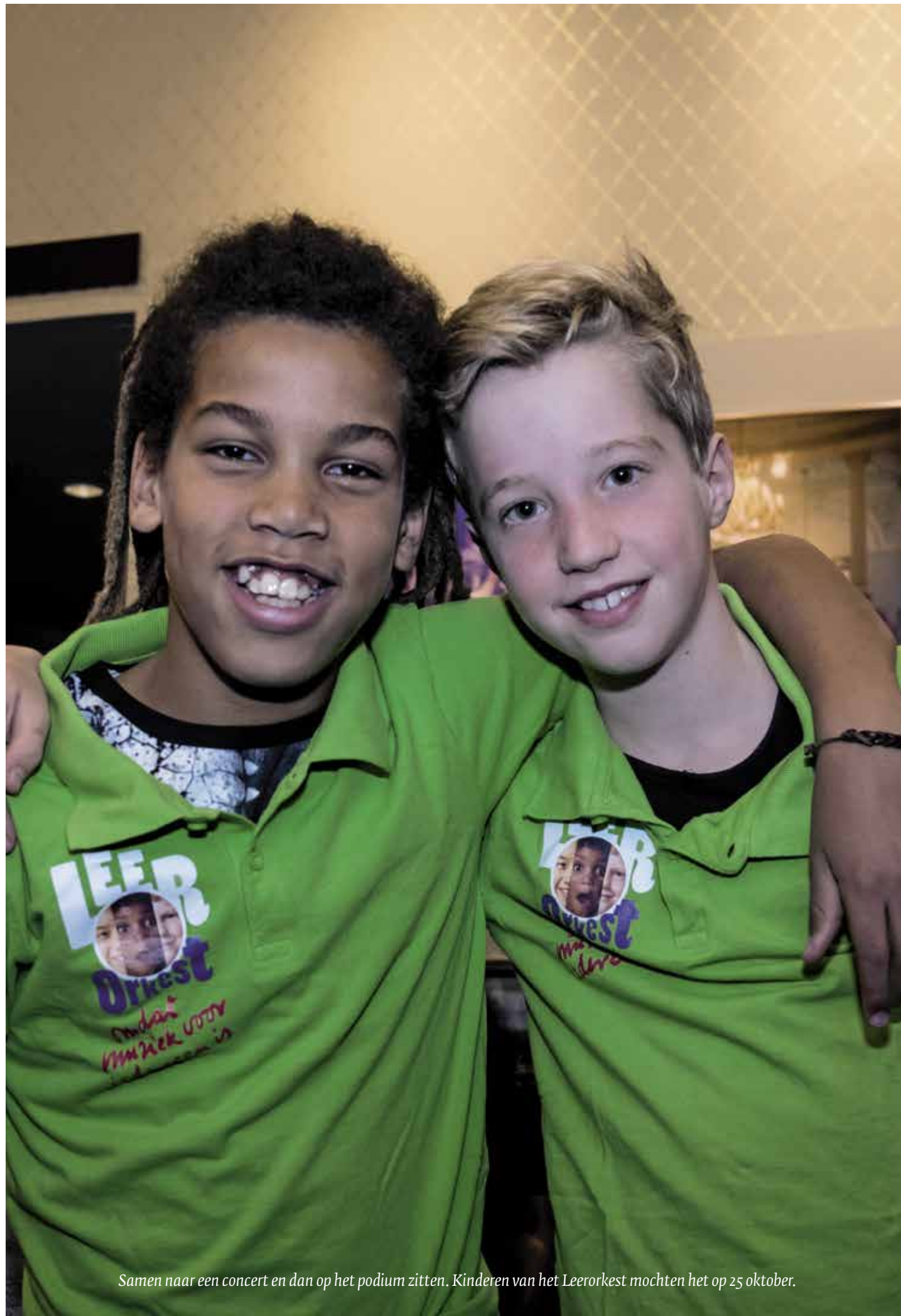
Samen naar een concert en dan op het podium zitten. Kinderen van het Leerorkest mochten het op 25 oktober.