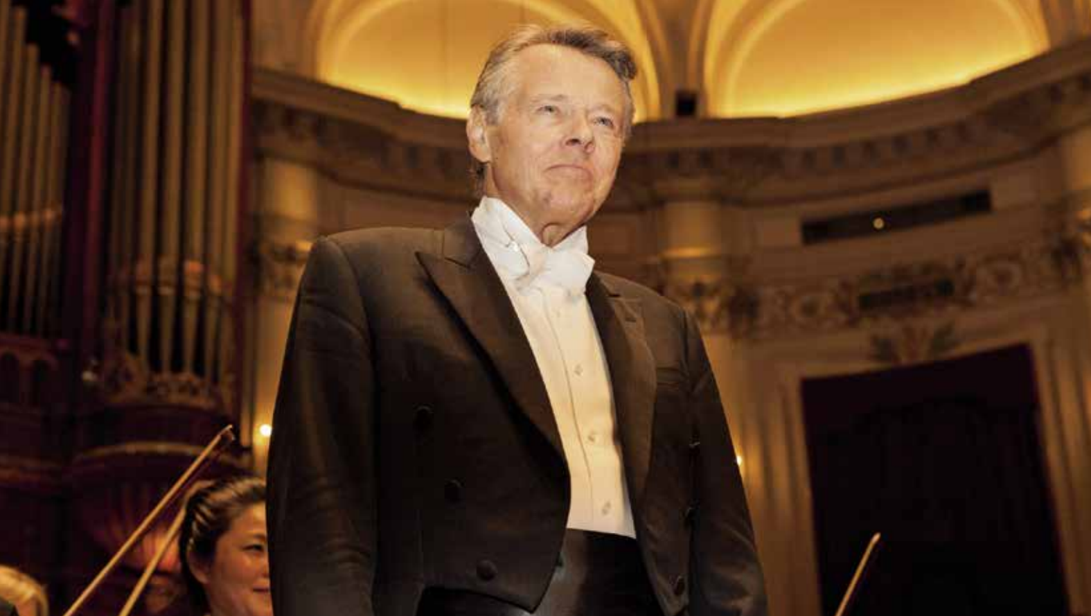
'Er waren veel mooie muzikale momenten. Mijn leermeester Von Karajan zei altijd: "Je moet het orkest niet te veel storen." Ik denk niet dat me dat altijd gelukt is, maar OK.'