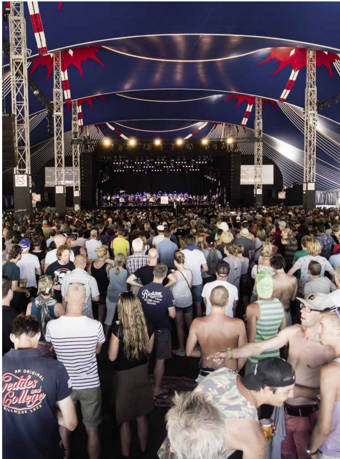
'Volgens mij is dit het refrein.' Het was even wennen voor veel bezoekers op Lowlands. Het Koninklijk Concertgebouworkest speelde er Le sacre du printemps van Igor Stravinsky. Zo'n 15.000 jongeren maakten kennis met deze revolutionaire muziek.

het orkest actief fondsen werft, sluit aan bij de internationale profilering van het orkest en het voorziet in het aangaan van meer bestendige relaties met enkele vooraanstaande Europese concertzalen. Met concertzalen in Parijs, Brussel, Londen en Frankfurt heeft het orkest nu een 'in residence'-relatie. Ook bij verschillende Europese festivals, zoals in Luzern, trekt het orkest jaarlijks volle zalen. Naast de reguliere concerten geeft het orkest daar regelmatig kamermuziekoptredens en workshops voor jonge talentvolle musici uit dat land en ontplooit het orkest andere activiteiten op het gebied van educatie en talentontwikkeling. De rol van de buitenlandse vriendenverenigingen en Global Friends, bijvoorbeeld als liaison tussen het orkest en jong talent in de betreffende landen, wordt naar verwachting de komende jaren groter.