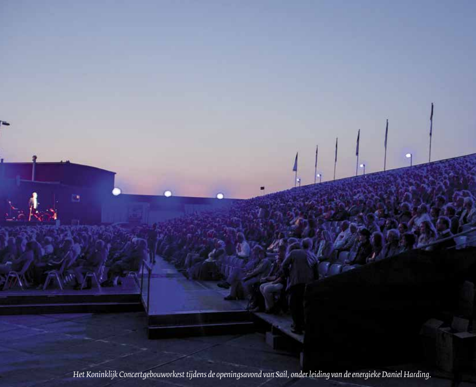
Het Koninklijk Concertgebouworkest tijdens de openingsavond van Sail, onder leiding van de energieke Daniel Harding.

De Stichting Donateurs vertaalt deze doelstelling naar vier bestedingsdoelen: