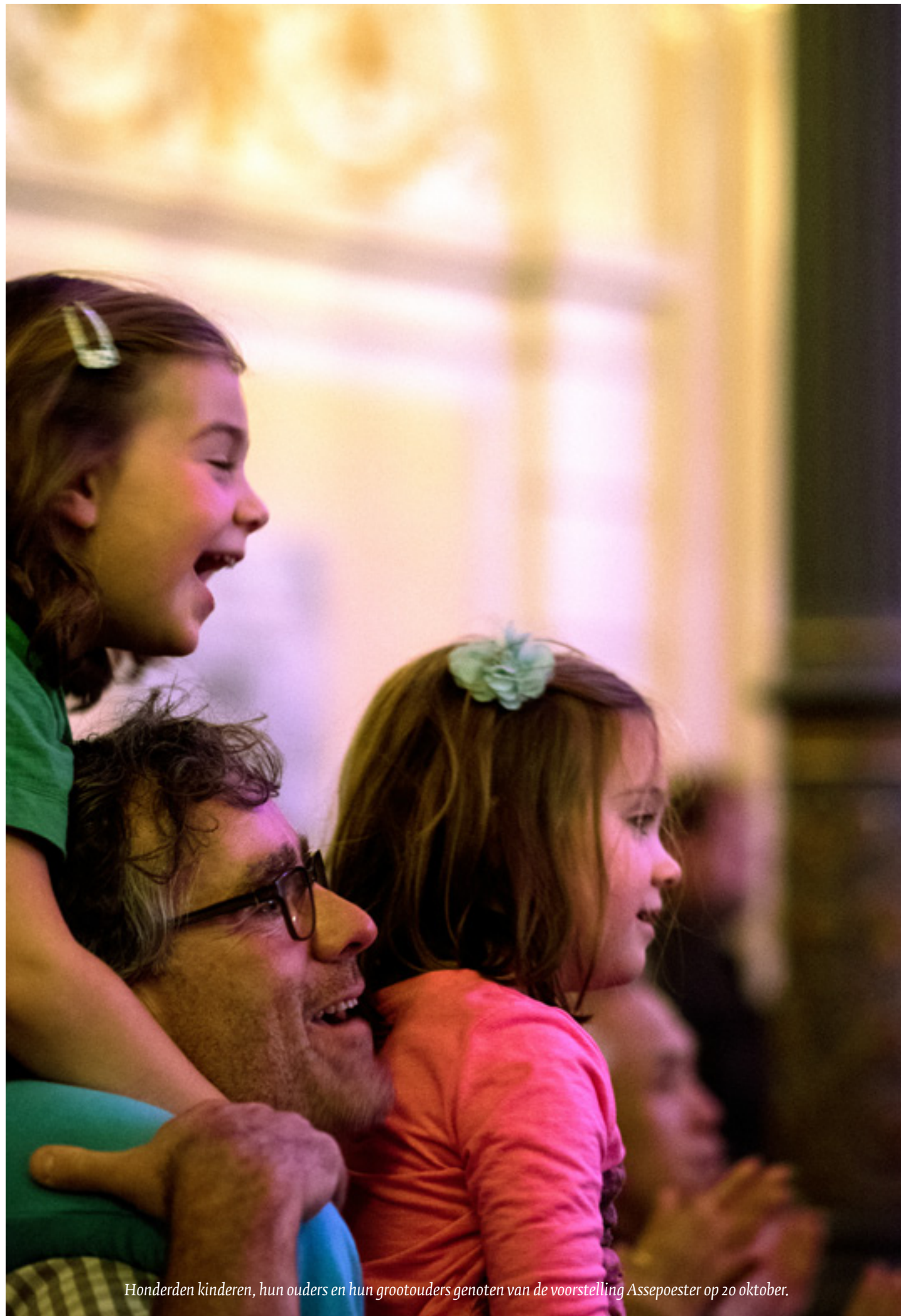
Honderden kinderen, hun ouders en hun grootouders genoten van de voorstelling Assepoester op 20 oktober.