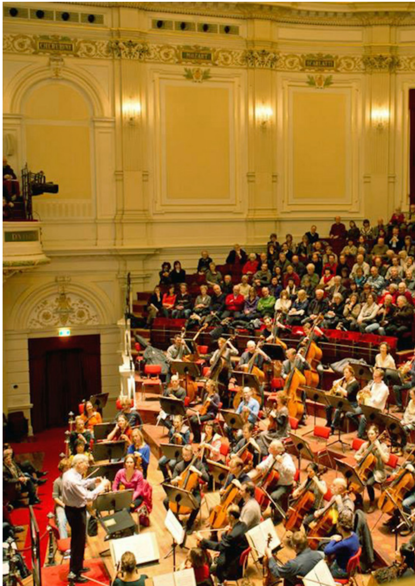
Met 2000 luisteraars was de Grote Zaal volledig gevuld voor het lunchconcert op 15 januari met dirigent Herbert Blomstedt.