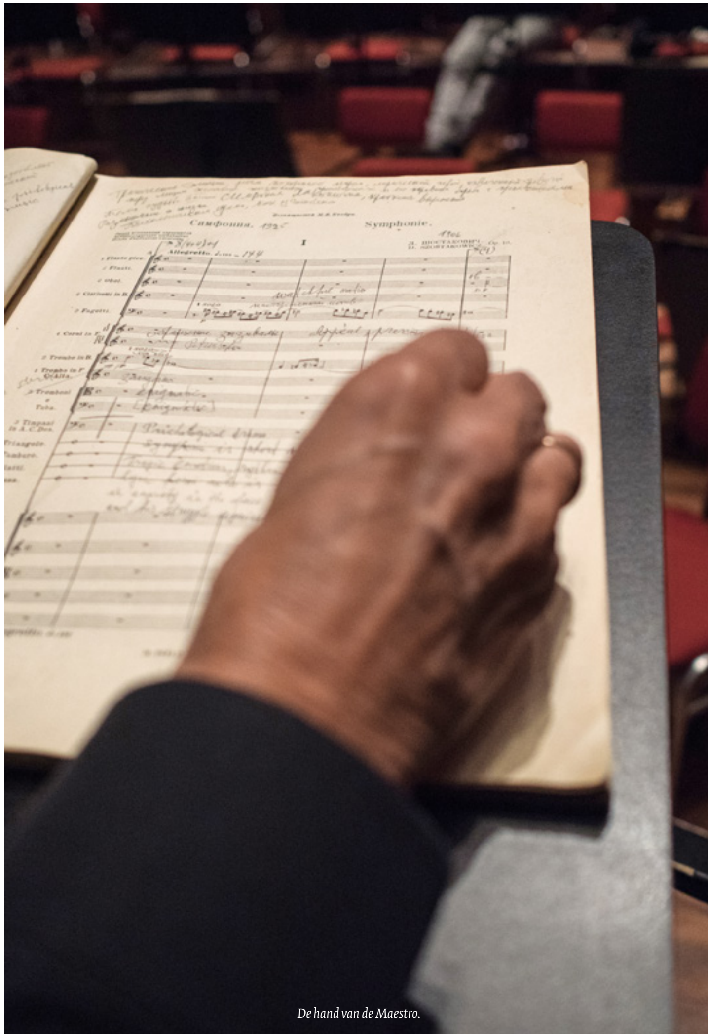
De hand van de Maestro.