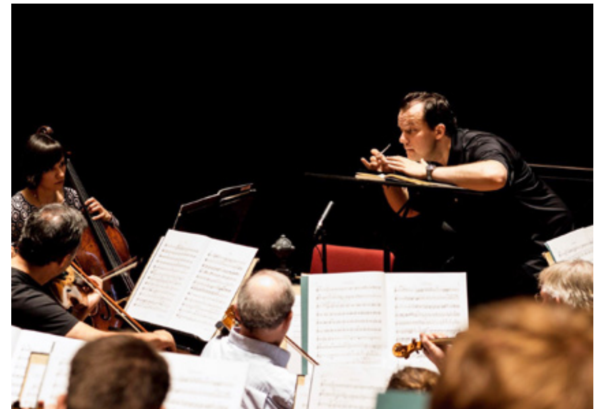
Repetitie van de Vijfde symfonie van Sjostakovitsj met dirigent Andris Nelsons, 6 oktober.

Voor het werven en onderhouden van toenemende baten uit grotere donaties, Fondsen op Naam en uit het buitenland wordt voorzien in een uitbreiding van de fondsenwervende capaciteit.