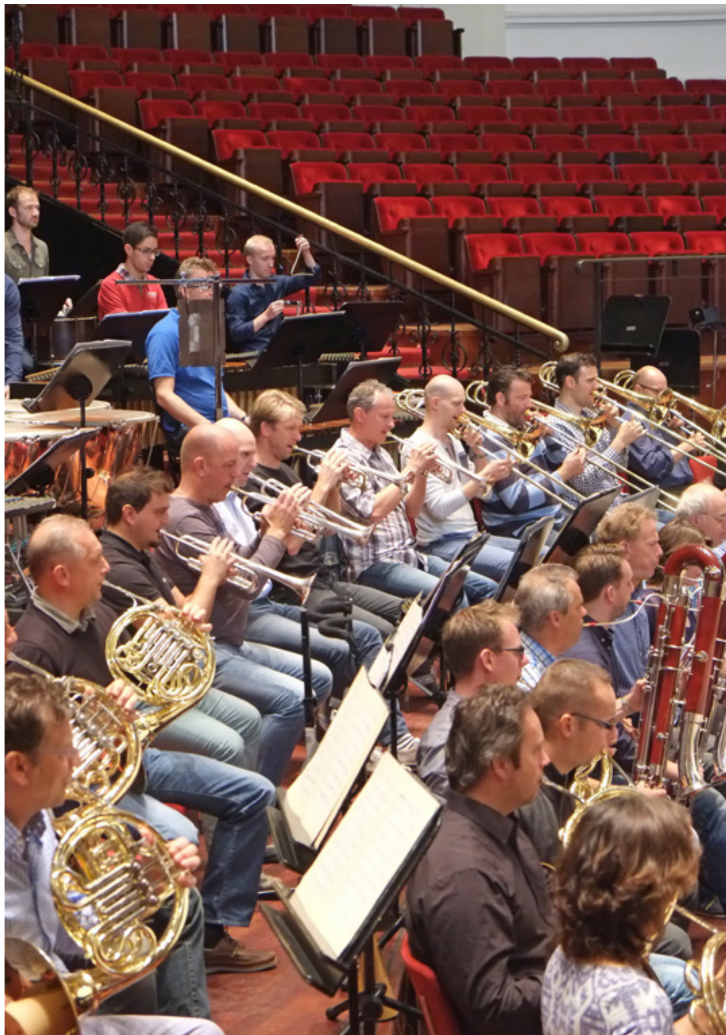
De koperblazerssectie voor Arcana van Edgard Varèse tijdens de repetitie op 23 september.