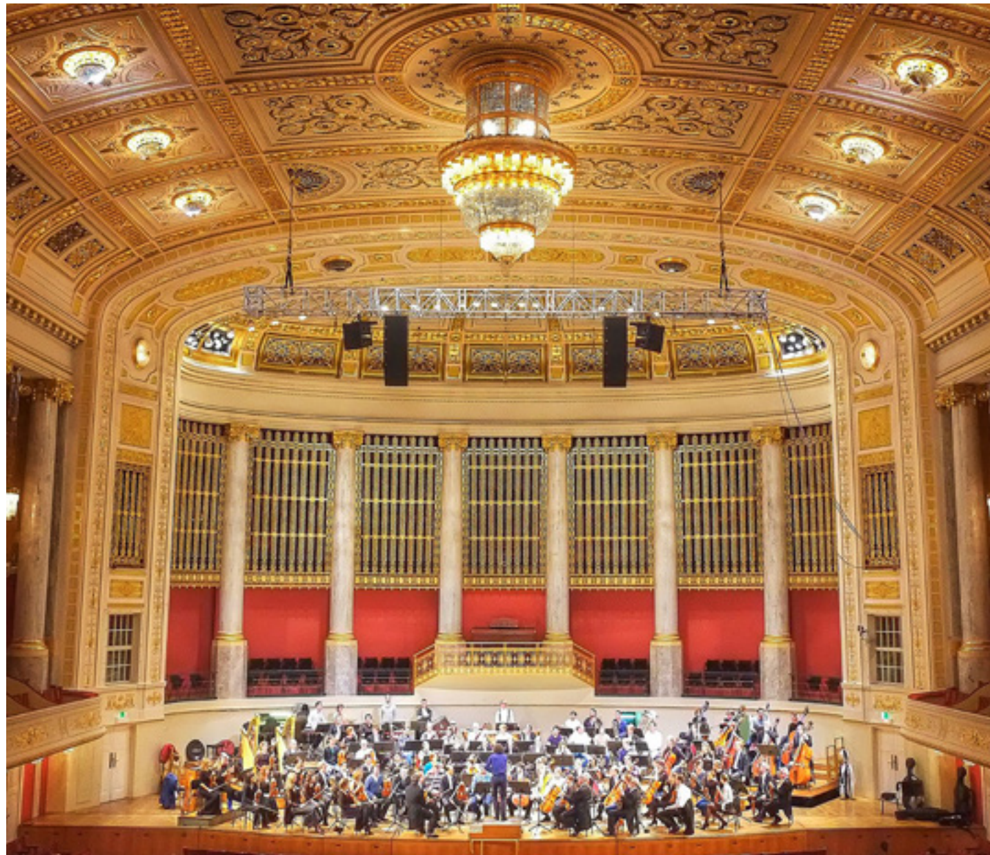
Per seizoen geven we ongeveer 100 concerten in Nederland en zo'n 35 in buitenlandse concertzalen. Hier repeteren we met dirigent Robin Ticciati in het Wiener Konzerthaus, 19 november.