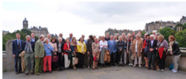
Mee op tournee naar Edinburgh