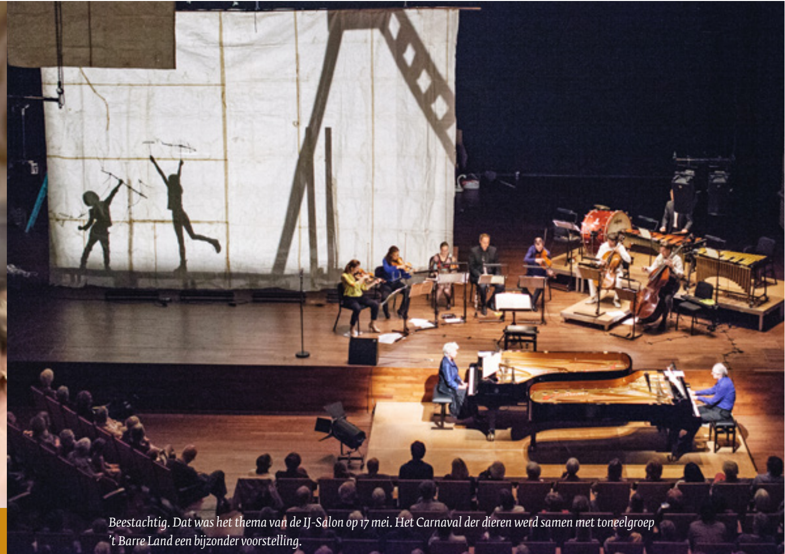
Beestachtig. Dat was het thema van de IJ-Salon op 17 mei. Het Carnaval der dieren werd samen met toneelgroep 't Barre Land een bijzonder voorstelling.