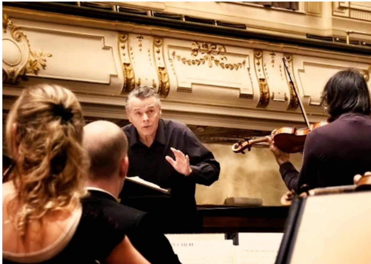
Op weg naar weer een spannende samenwerking met artist in residence Leonidas Kavakos, 2 september in Graz.