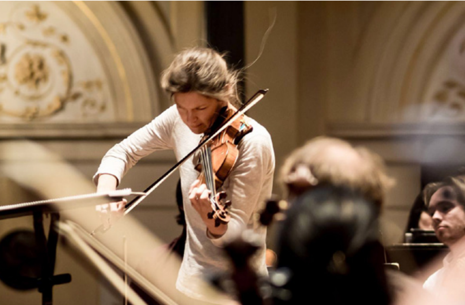
Janine Jansen repeteert het Violconcert dat Michel van der Aa speciaal voor haar schreef en dat ze samen met het Koninklijk Concertgebouworkest op 6 november voor het eerst uitvoerde.