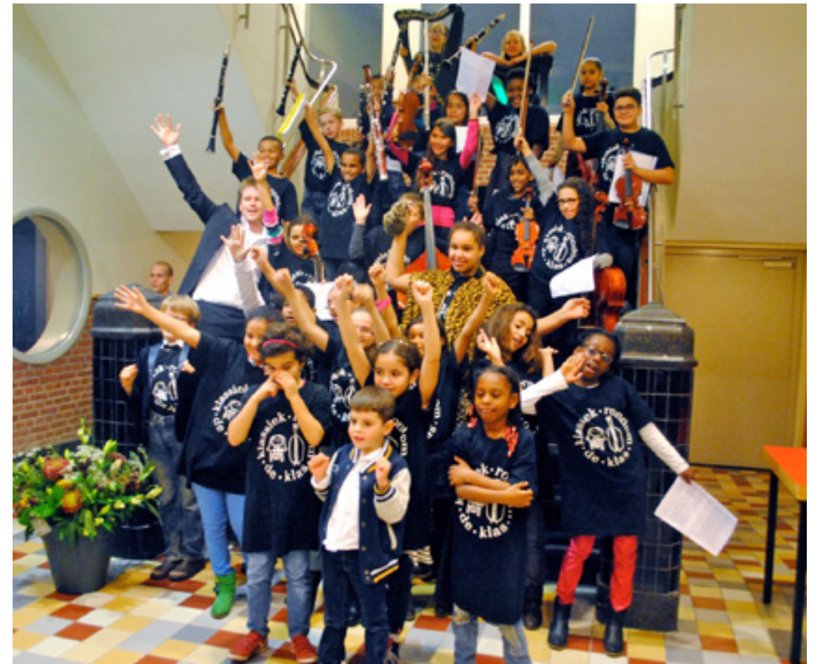
De cast van Doe normaal Driss poseert na afloop voor de camera's.