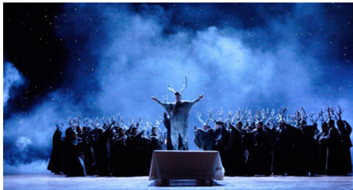
'Zo'n enorme Falstaff zie je eens in je leven', aldus Trouw van 10 juni over de uitvoering van de opera van Giuseppe Verdi door het Koninklijk Concertgebouworkest onder leiding van dirigent Daniele Gatti, samen met De Nederlandse Opera.