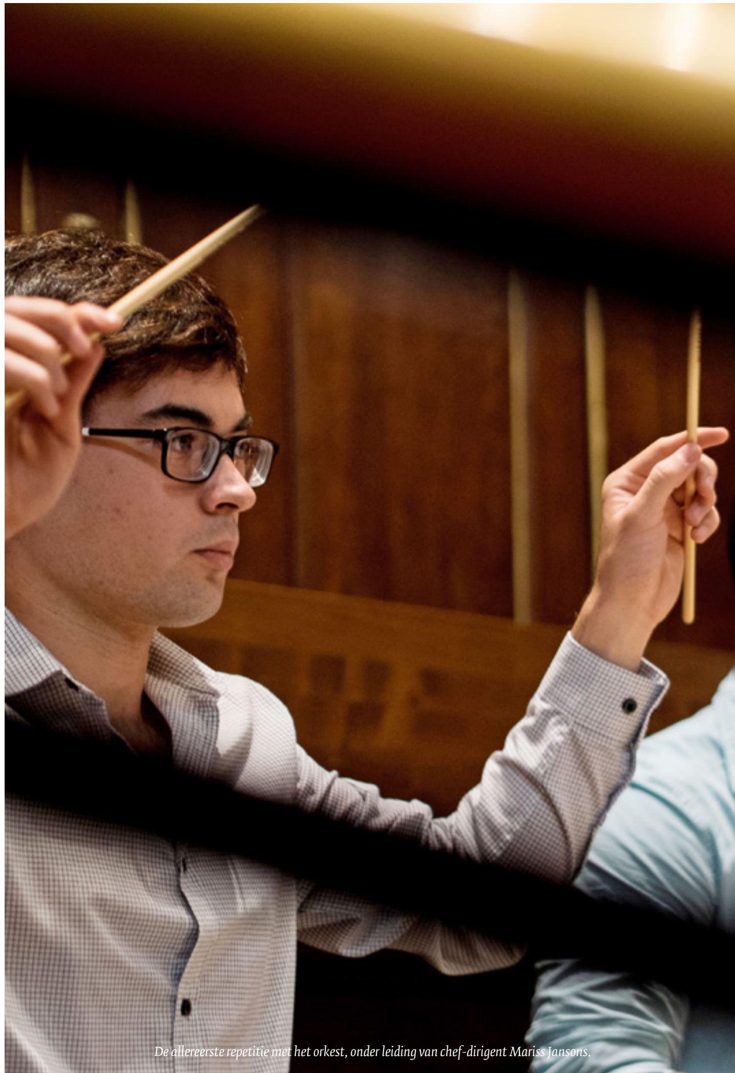
De allereerste repetitie met het orkest, onder leiding van chef-dirigent Mariss Jansons.