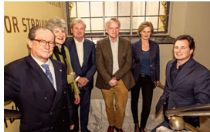
Het bestuur van de Stichting Donateurs (vlnr)