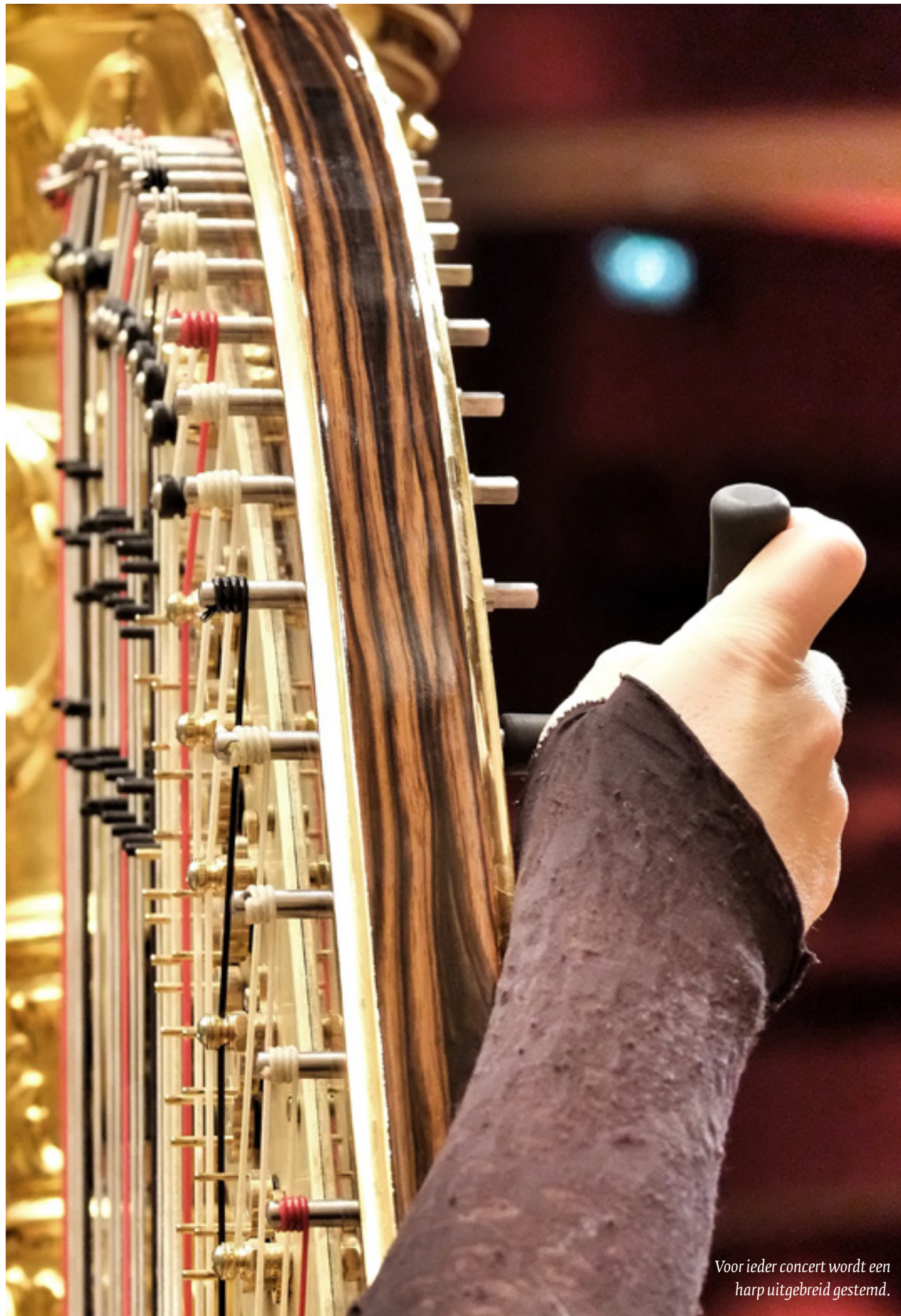
Voor ieder concert wordt een harp uitgebreid gestemd.