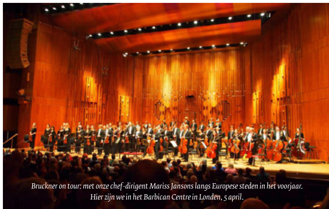
Bruckner on tour: met onze chef-dirigent Mariss Jansons langs Europese steden in het voorjaar. Hier zijn we in het Barbican Centre in Londen, 5 april.