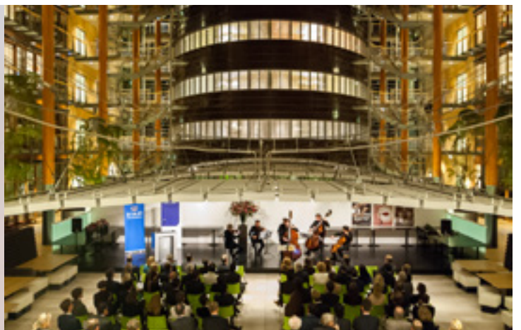
De uitreiking van de Prix de Salon op het kantoor van sponsor Loyens & Loeff op 30 oktober