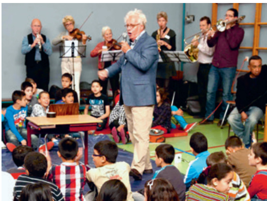
Kinderen krijgen uitleg voor Klassiek rondom de Klas, waarin ze zelf kunnen spelen. Het Willem en Wilhelmina Bouwes Fonds steunt het project.