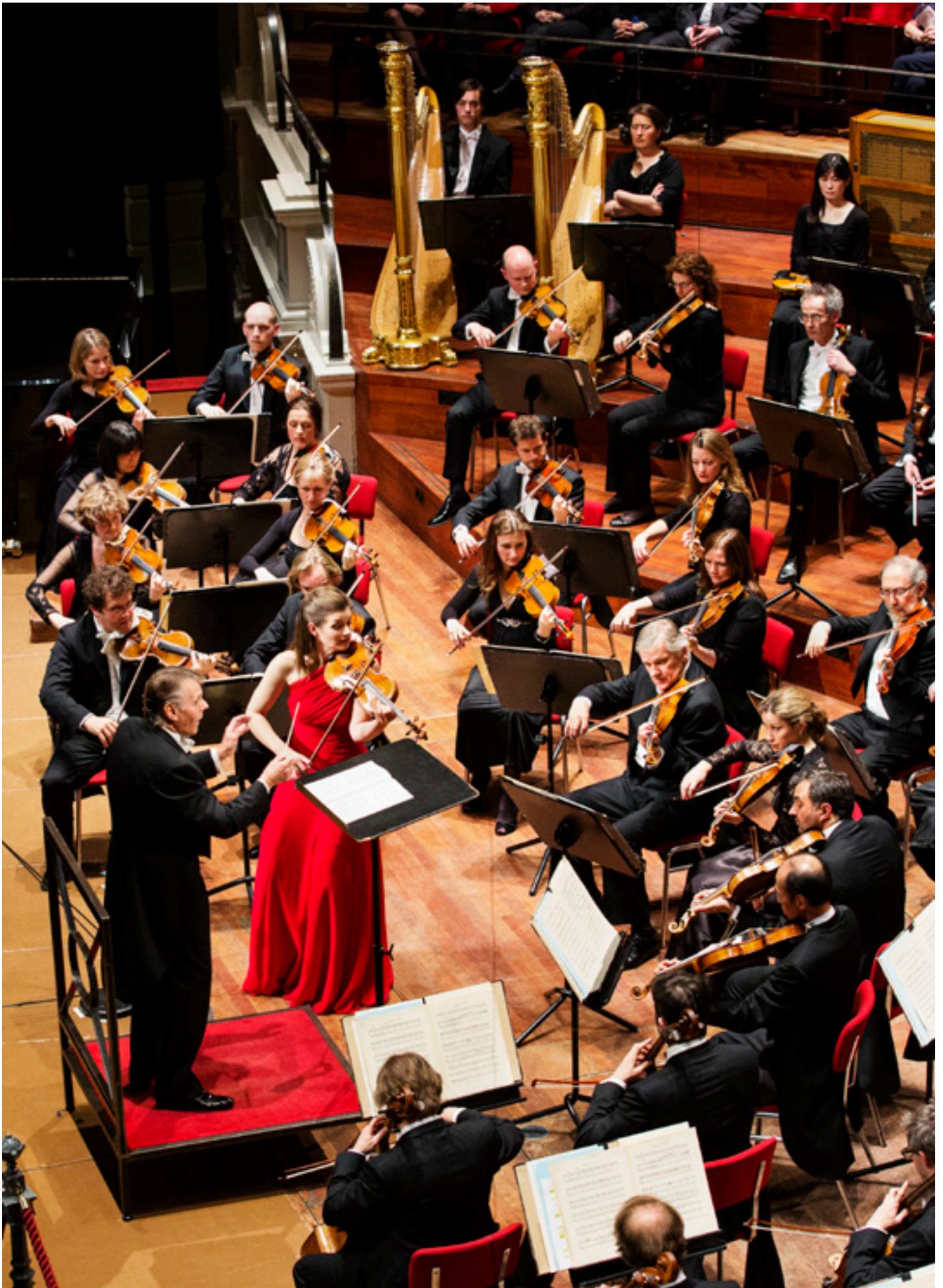
Violiste Janine Jansen kwam het 125-jarig jubileum mee vieren op het jubileumconcert van 10 april. De maand ervoor was ze met het orkest mee geweest op tournee naar Zuid-Afrika.