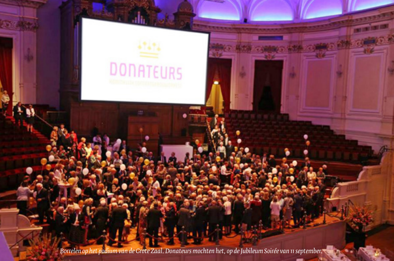
Borrelen op het podium van de Grote Zaal. Donateurs mochten het, op de Jubileum Soirée van 11 september.

De Stichting Donateurs vertaalt deze doelstelling naar vier bestedingsdoelen: