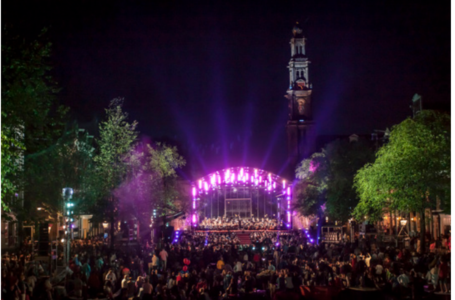
Het Prinsengrachtconcert op 24 augustus trok niet alleen veel bezoekers lang de kant, ook op tv zorgde het optreden van het orkest voor een record aantal kijkers: 919.000.