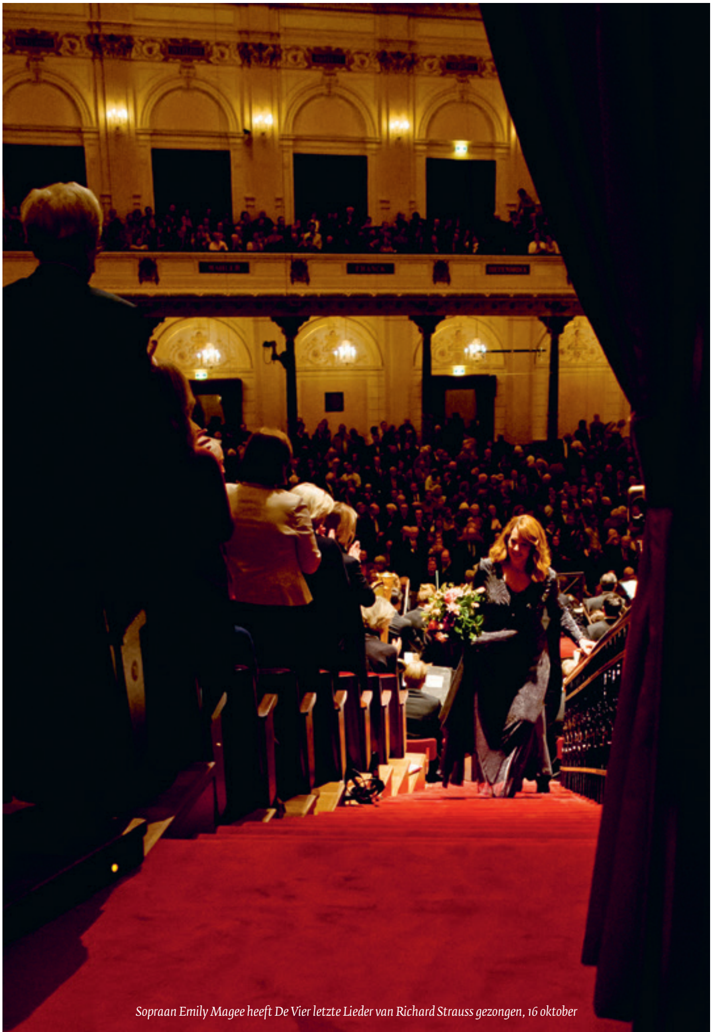
Sopraan Emily Magee heeft De Vier letzte Lieder van Richard Strauss gezongen, 16 oktober