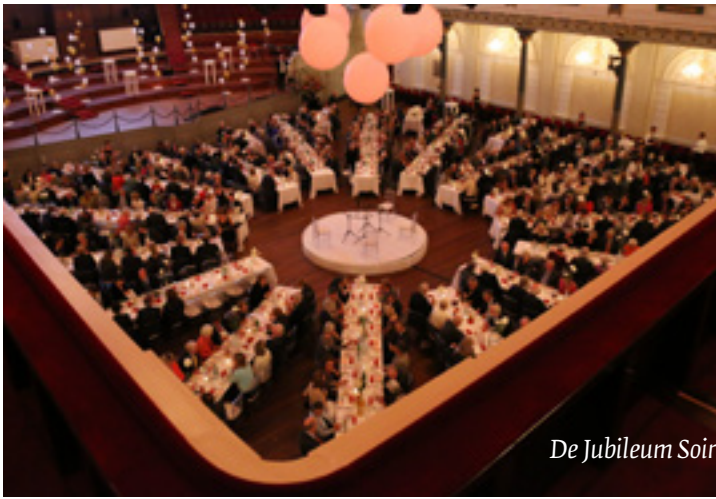
De Jubileum Soirée op 11 september