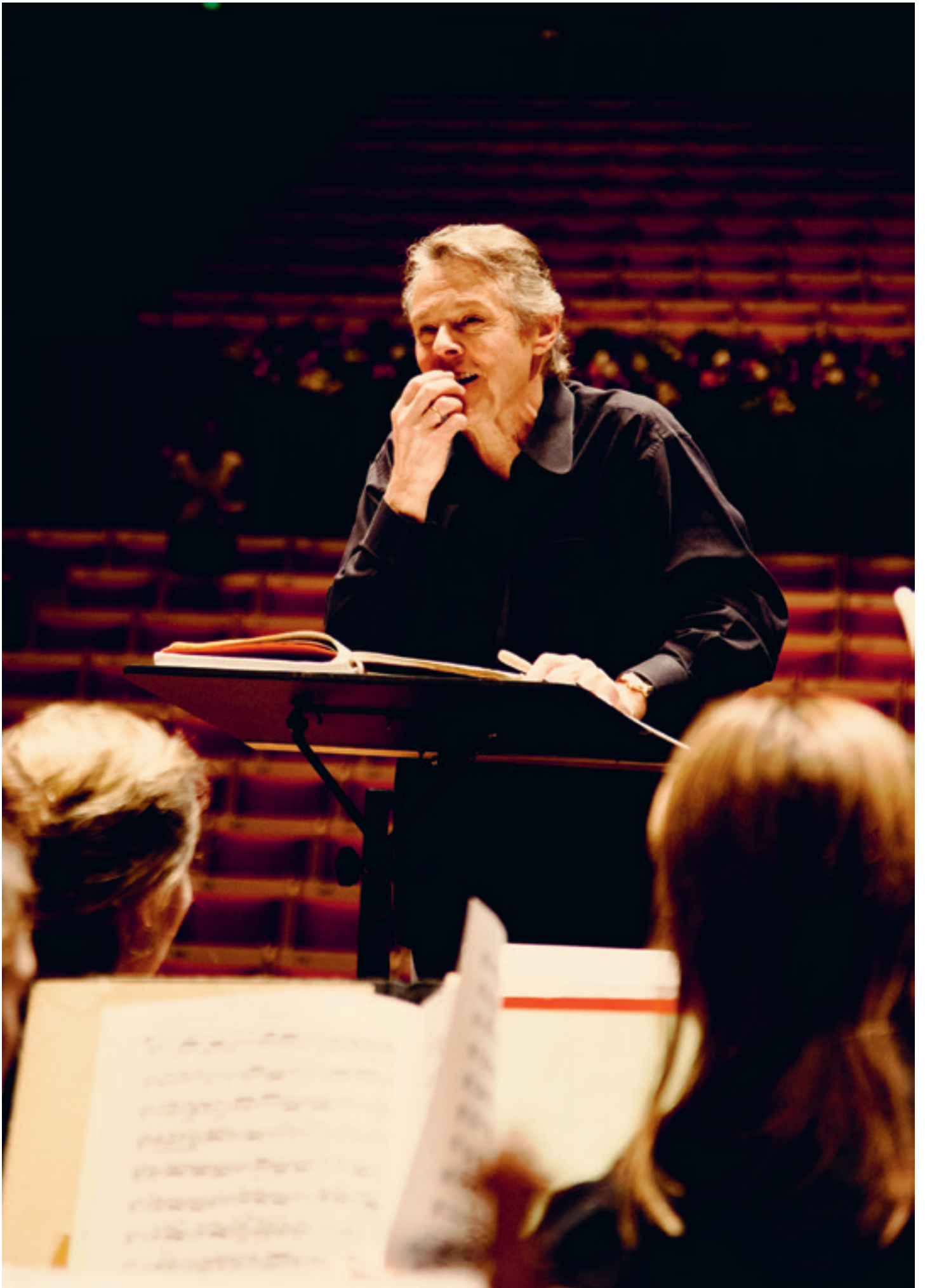
Chef-dirigent Mariss Jansons geniet in het Sydney Opera House van de repetitie met het orkest.