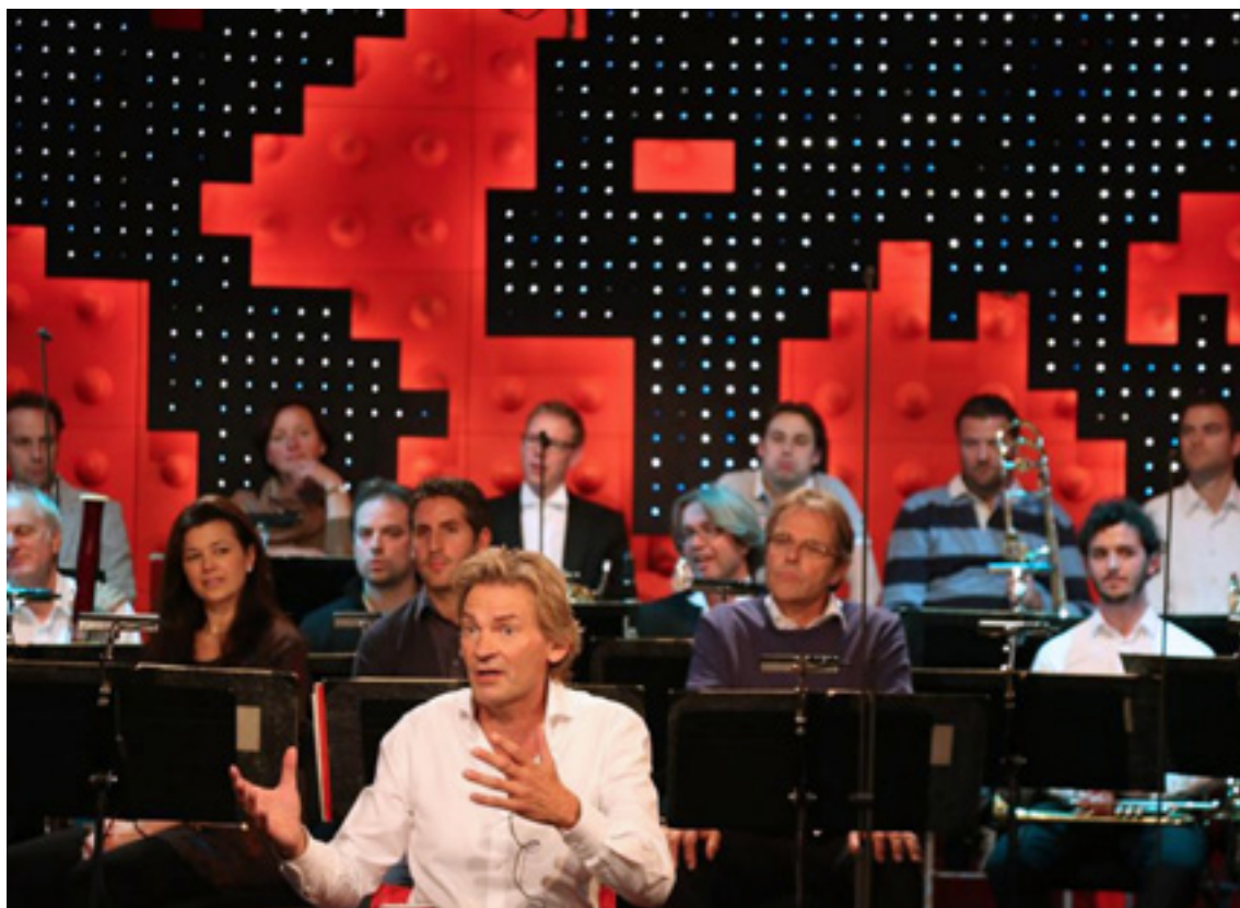
Repetitie voor De Wereld Draait Door

Donateurs kwamen positief in het nieuws, toen zij het woord konden voeren in een uitzending van De Wereld Draait Door op 30 september, die speciaal gewijd was aan het Koninklijk Concertgebouworkest.