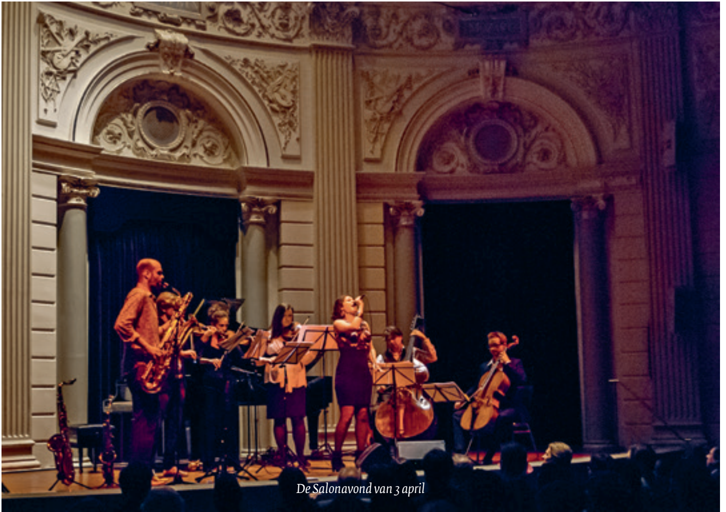
De Salonavond van 3 april