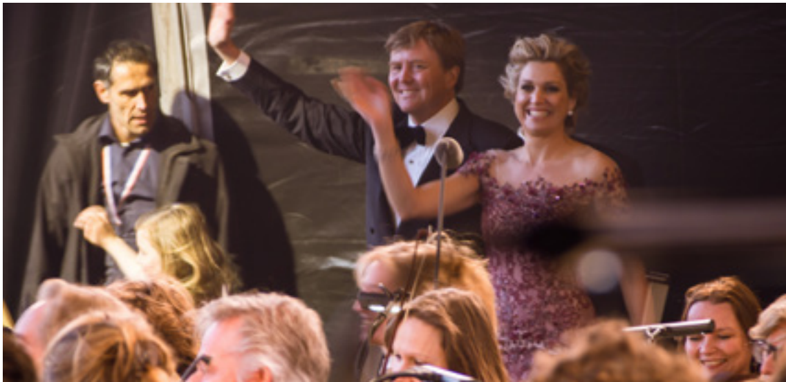
Onverwacht stapten Zijne Koninklijke Hoogheid Koning Willem-Alexander en Hare Koninklijke Hoogheid Prinses M a xima en hun kinderen van de boot om het Koninklijk Concertgebouworkest en Armin van Buuren te begroeten. Koningsdag, 30 april.

De Salon , de zakelijke kring van donateurs, bleef ondanks het tegenzittende economisch tij onverminderd succesvol. De Salonavonden, die een hoog artistiek niveau kennen, blijken tevens laagdrempelig voor nieuw publiek en missen hun uitwerking niet. Het aantal leden nam in 2013 toe. Er is alle reden om deze benadering voort te zetten.