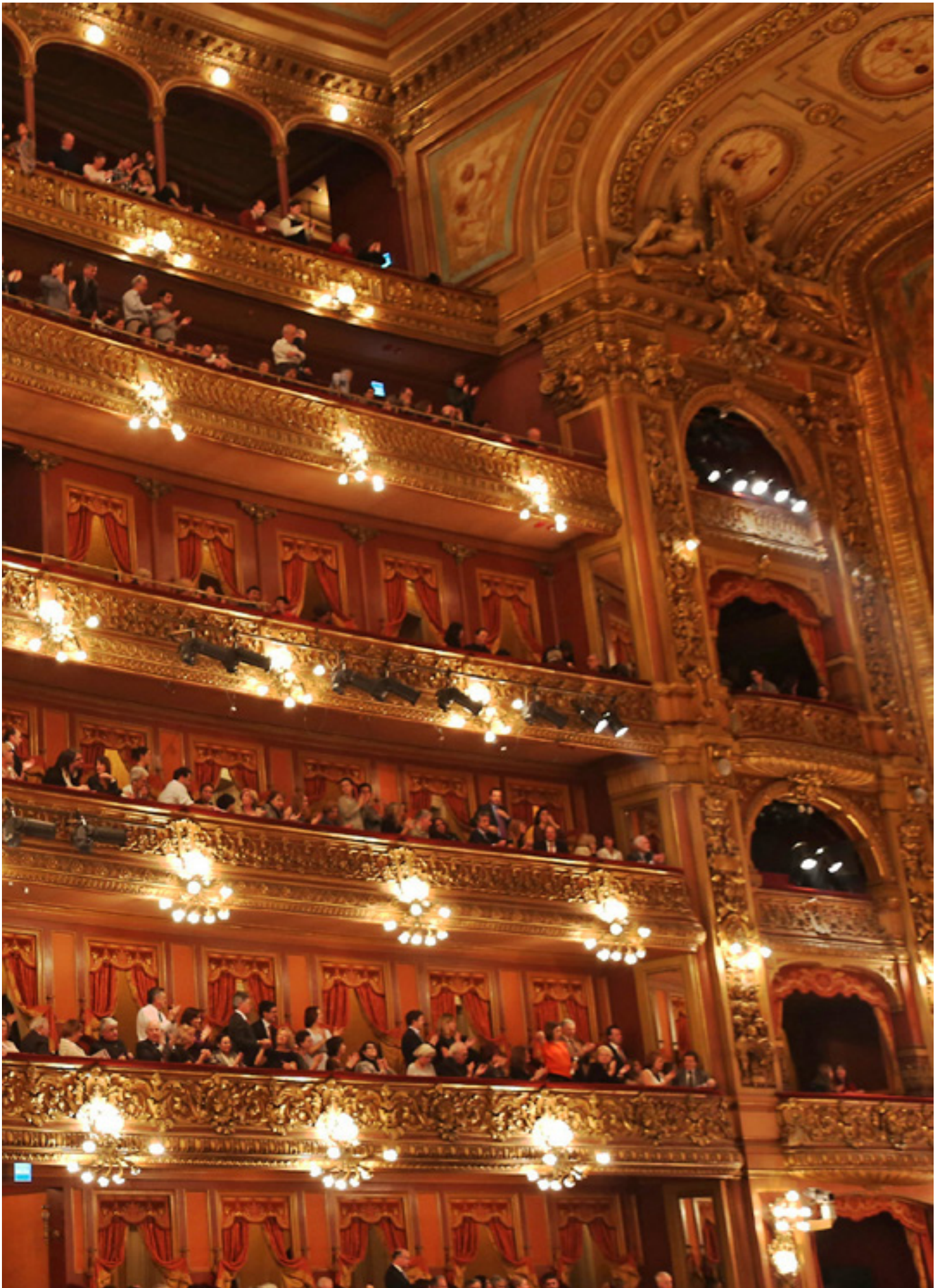
Teatro Colón in Buenos Aires is niet alleen mooi. Het heeft ook een uitstekende akoestiek, zo was de ervaring van de musici tijdens concerten op 28 en 29 juni.