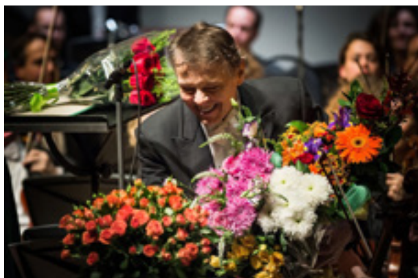
Na afloop van het concert in Moskou

'[...] onder de legendarische directie van Mariss Jansons. [...] Het is verlichtend om te zien hoe Mariss Jansons dirigeert, samenwerkend met de musici, waarderend en respectvol in plaats van autoritair. Hij geeft aan wat hij wil en vertrouwt de musici het waar te maken en dat doen ze.'