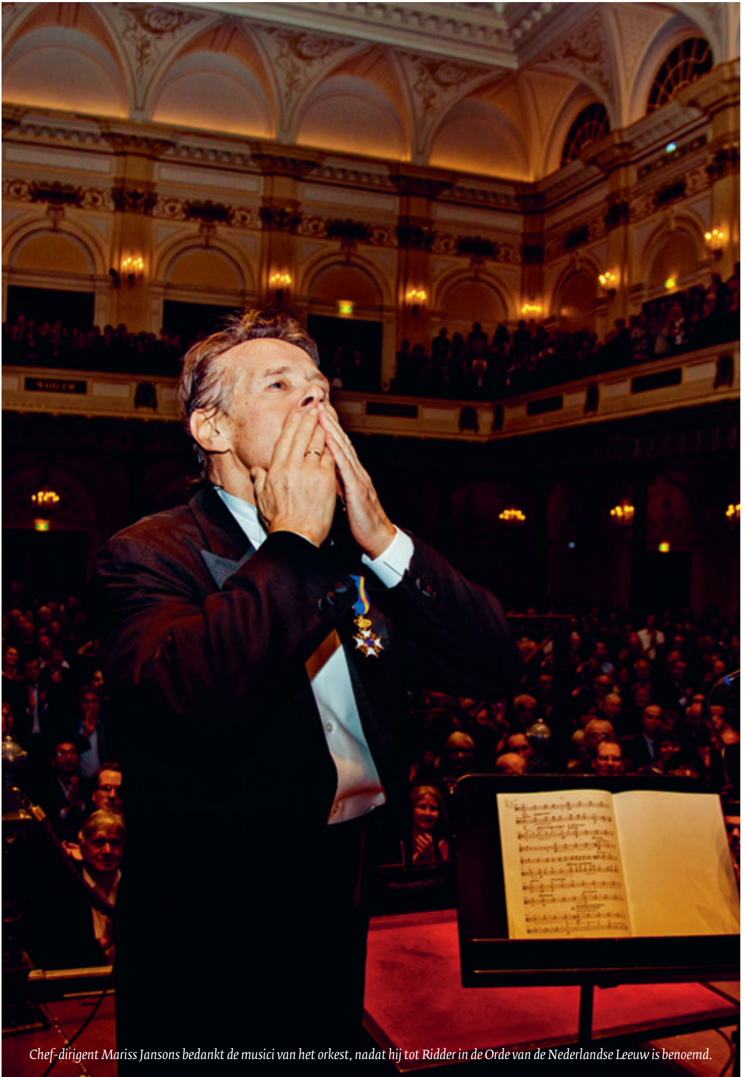
Chef-dirigent Mariss Jansons bedankt de musici van het orkest, nadat hij tot Ridder in de Orde van de Nederlandse Leeuw is benoemd.