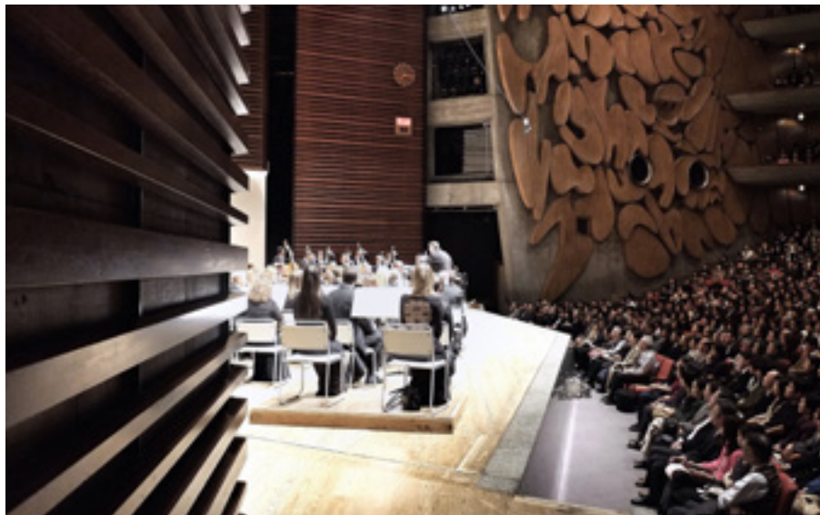
Bunka Kaikan, de concertzaal in Tokio

Juist betrouwbaarheid van de organisatie is een van de belangrijke factoren bij de actuele toename van het aantal ontvangen en toegezegde nalatenschappen . Steeds meer particuliere schenkers nemen het de Stichting Donateurs Koninklijk Concertgebouworkest op in hun testament. De stichting wil deze ontwikkeling ook de komende jaren actief onder de aandacht blijven brengen.