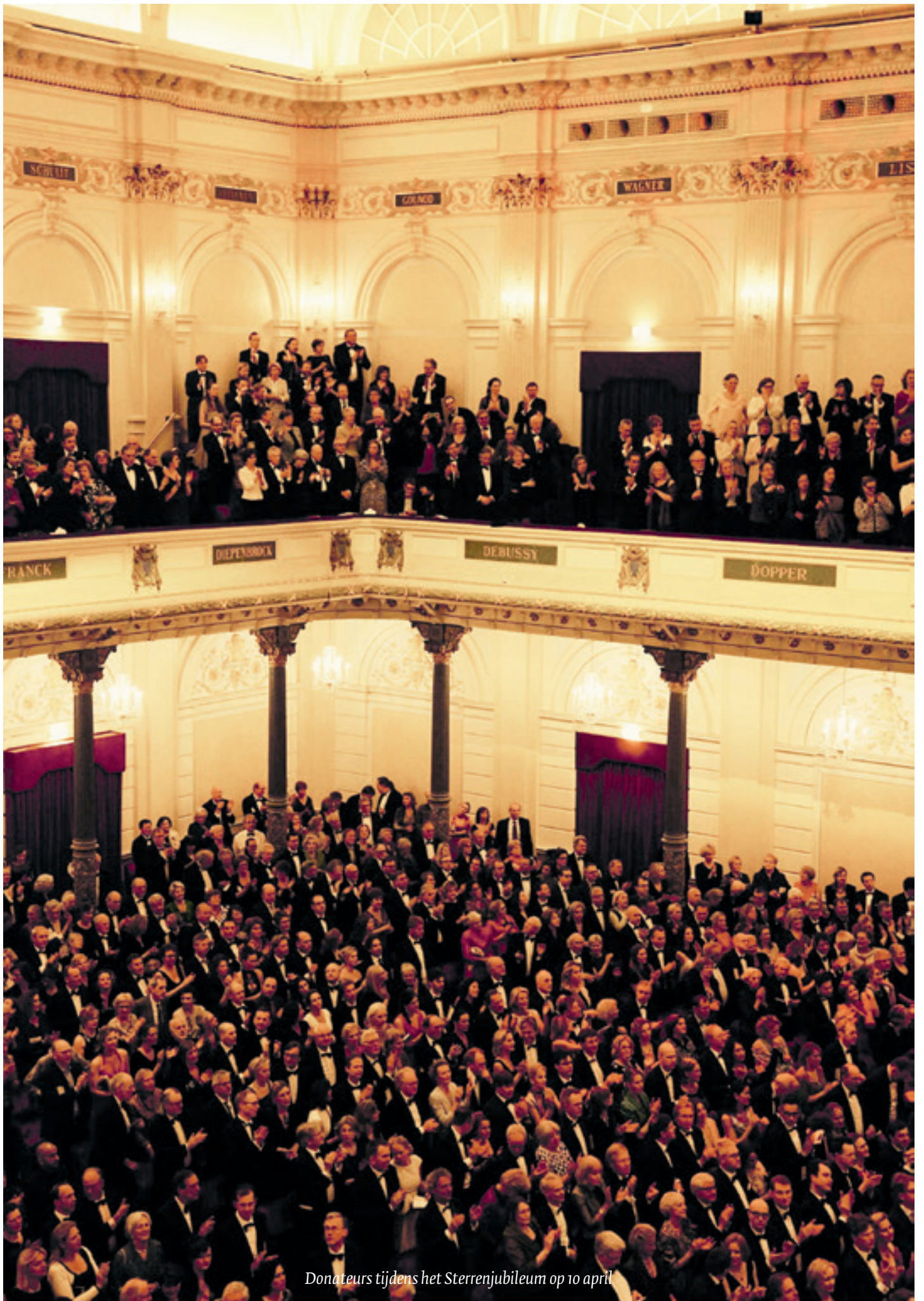
Donateurs tijdens het Sterrenjubiläum op 10 april