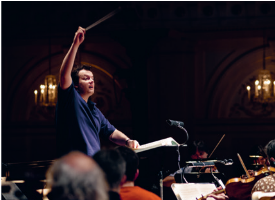
Repetitie voor Der fliegende Holländer met Andris Nelsons, 23 mei

Uiteraard maakt ook dit jaarverslag deel uit van de communicatie. Na publicatie verschijnt het op de website van het Koninklijk Concertgebouworkest en wordt het toegezonden aan donateurs, belanghebbenden en op verzoek ook aan andere geïnteresseerden.