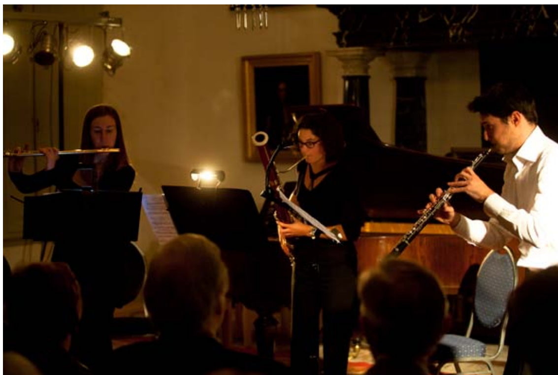
Talenten van de Orkestacademie geven een concert op kasteel Amerongen, in september