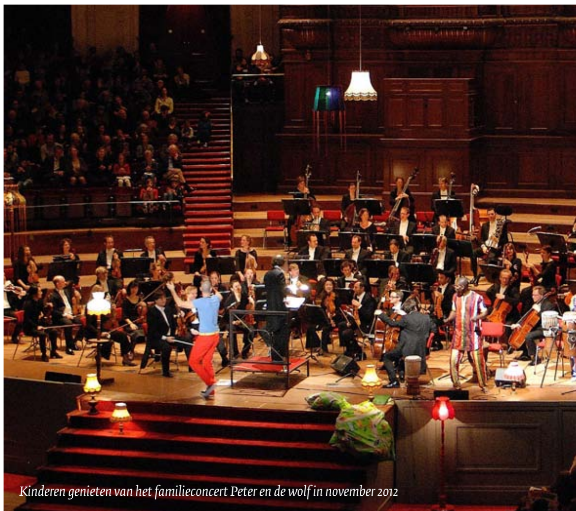
Kinderen genieten van het familieconcert Peter en de wolf in november 2012