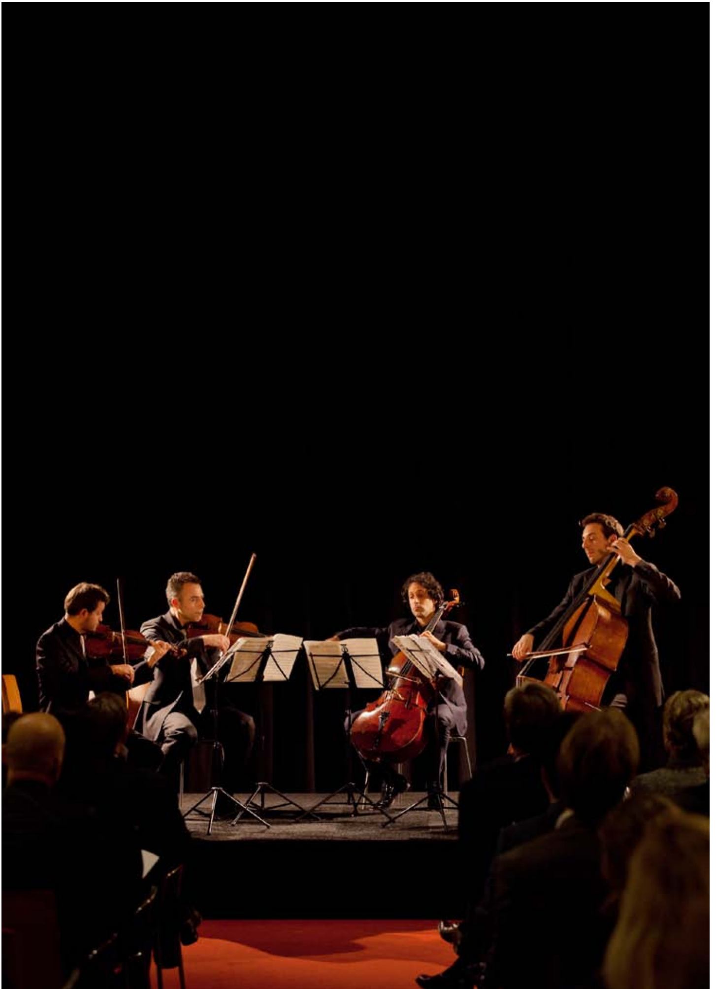
Een ensemble van het orkest speelde in januari op de Salonavond bij PWC, die speciaal voor de gelegenheid een concertzaal in hun kantoor bouwde.