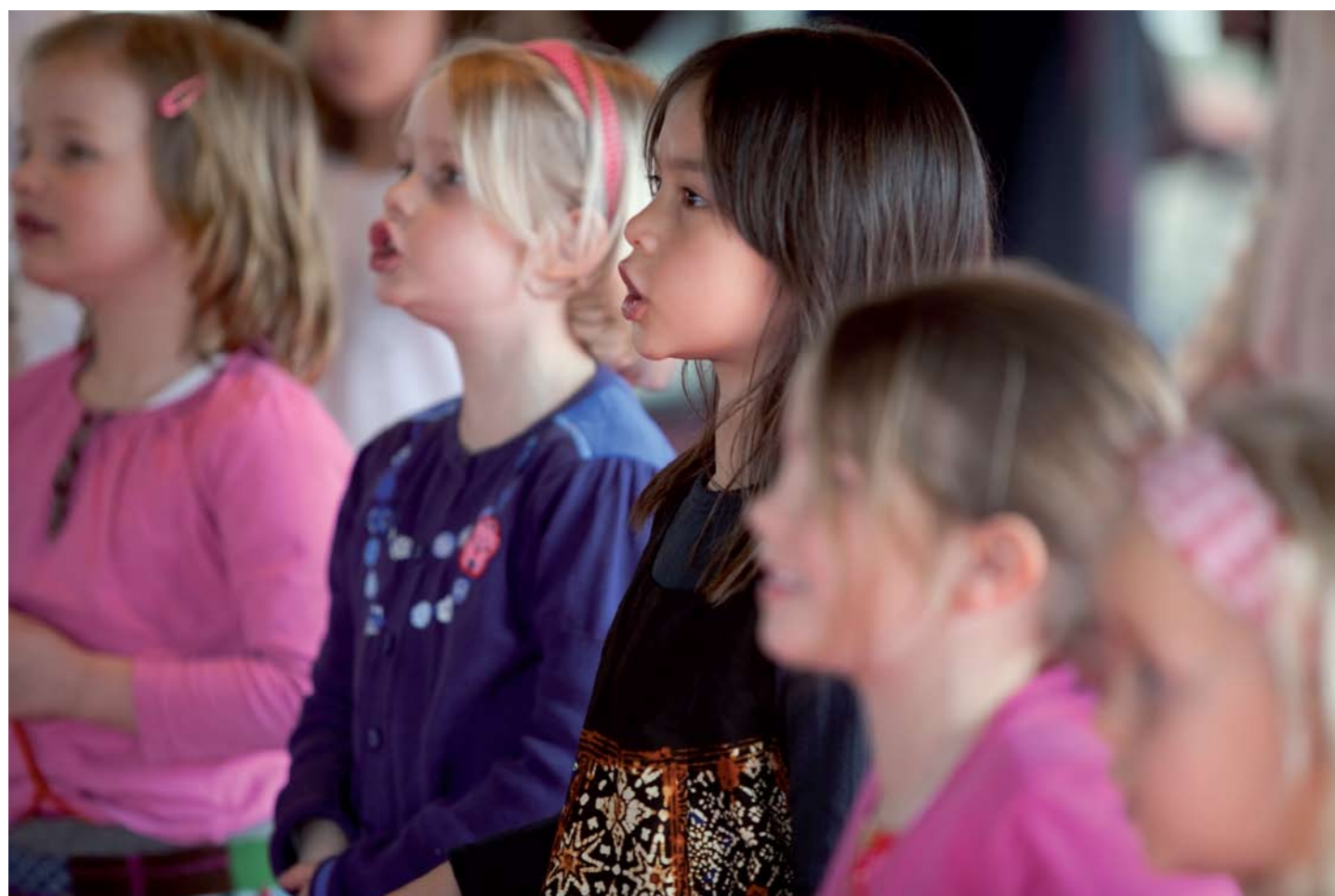
Het Koninklijk Concertgebouworkest programmeert ieder jaar een familieconcert dat tot stand komt door bijdragen van donateurs.