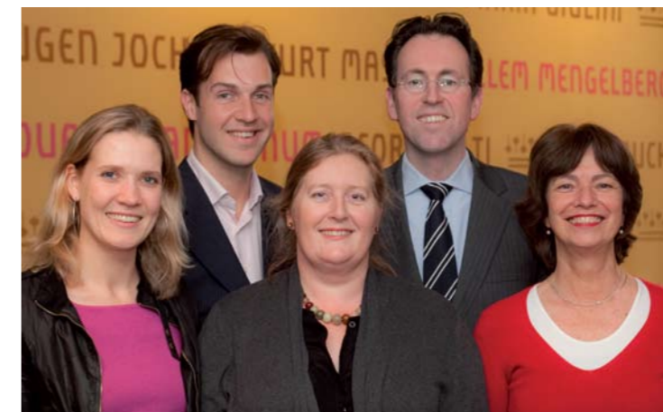
Het team van de Stichting Donateurs (vlnr)