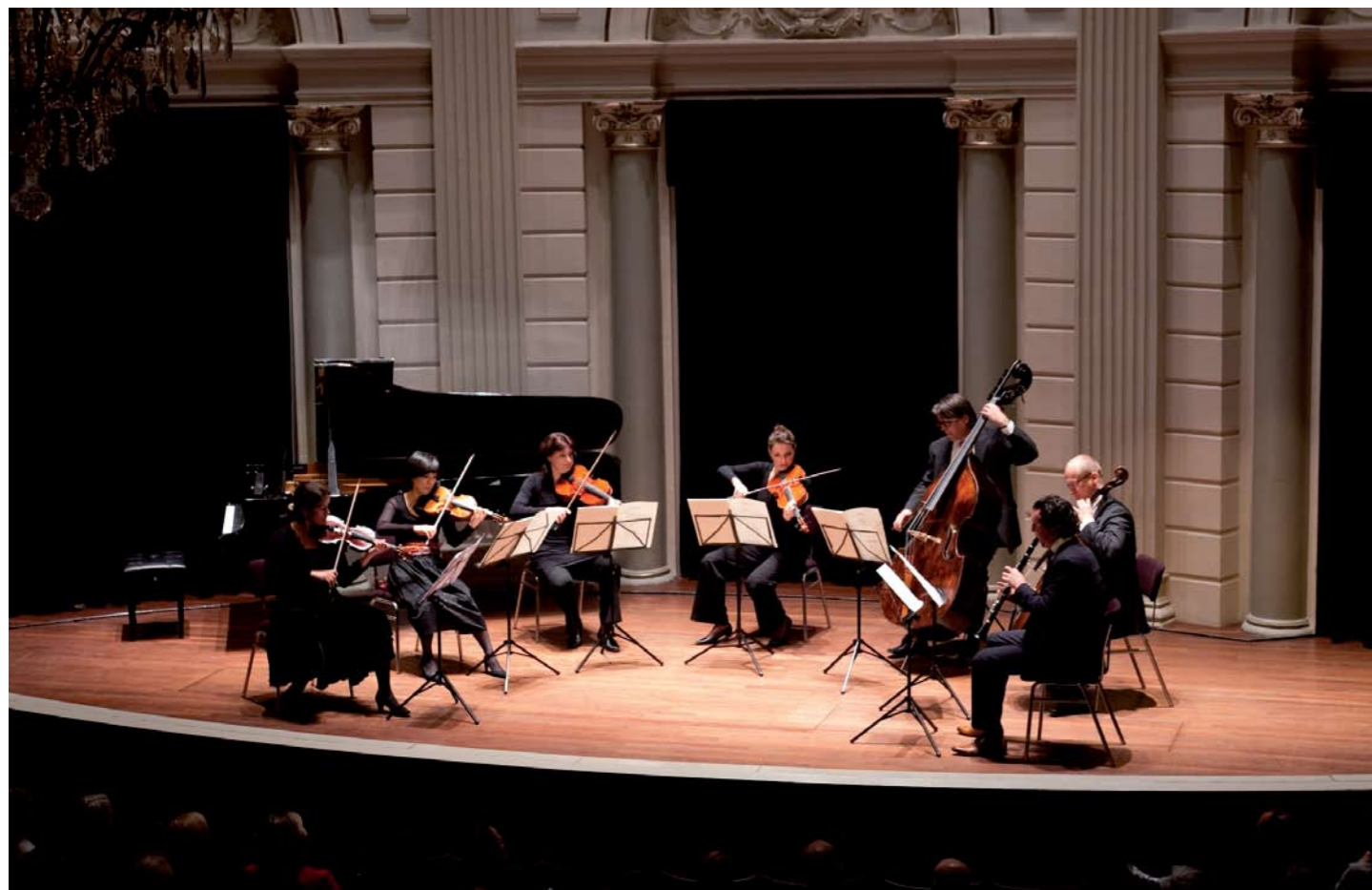
Gouden Gilde-leden krijgen elk jaar de gelegenheid de exclusieve Gouden Gilde Soiree bij te wonen. Musici van het Koninklijk Concertgebouworkest brengen deze avond muziek ten gehore, gespeeld op instrumenten die dankzij de steun van donateurs zijn aangekocht.

Een Fonds op Naam is de meest persoonlijke en ook de meest invloedrijke manier van schenken aan het Koninklijk Concertgebouworkest. Oprichters bepalen namelijk niet alleen de doelstelling van hun Fonds. Zij worden ook, desgewenst, betrokken bij de jaarlijkse besluitvorming over de precieze besteding. Een Fonds op Naam kan anoniem zijn, de naam dragen van de oprichter of van een overleden dierbare.