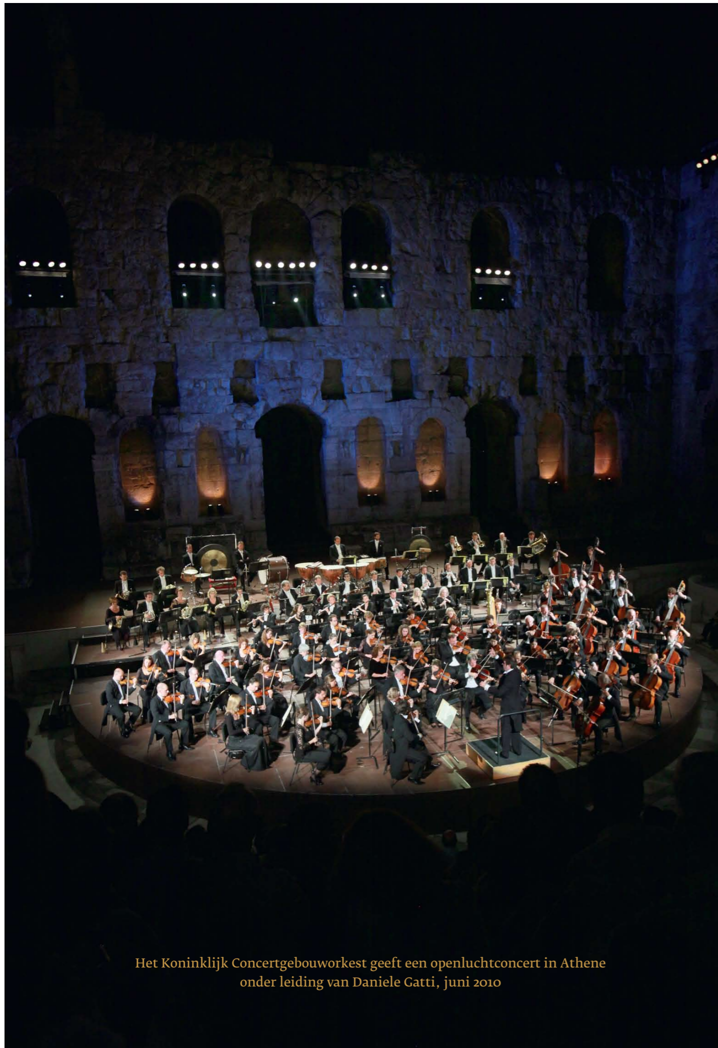
Het Koninklijk Concertgebouworkest geeft een openluchtconcert in Athene onder leiding van Daniele Gatti, juni 2010