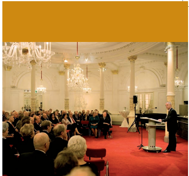
Gouden Gilde Soiree in de Spiegelzaal.

Het aantal leden van het Gouden Gilde bedraagt op dit moment ruim vierhonderd, waarvan het overgrote deel een abonnement heeft in een van de B-series. Ieder seizoen worden een of meer exclusieve bijeenkomsten georganiseerd voor leden van het Gilde, waarbij de musici van het Concertgebouworkest centraal staan. Zo zal in 2007 een Gouden Gilde Soirée worden georganiseerd, waarin studenten van de Orkestacademie en hun mentoren uit het KCO zich zullen presenteren. Daarnaast krijgen Gouden Gilde leden voorrang bij de intekening voor bijzondere concerten.