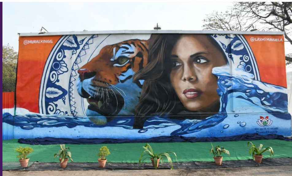
Mural Art - A Creative Connect between India and the Netherlands Copyrights for Bengaluru: Delhi Street Art