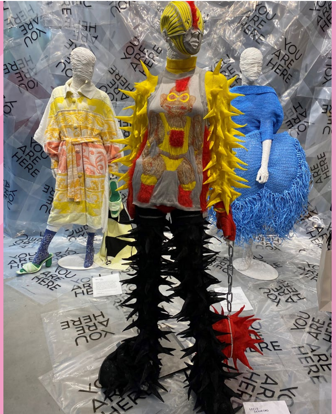
'New Order of Fashion' tentoonstelling op Dutch Design Week 2021.