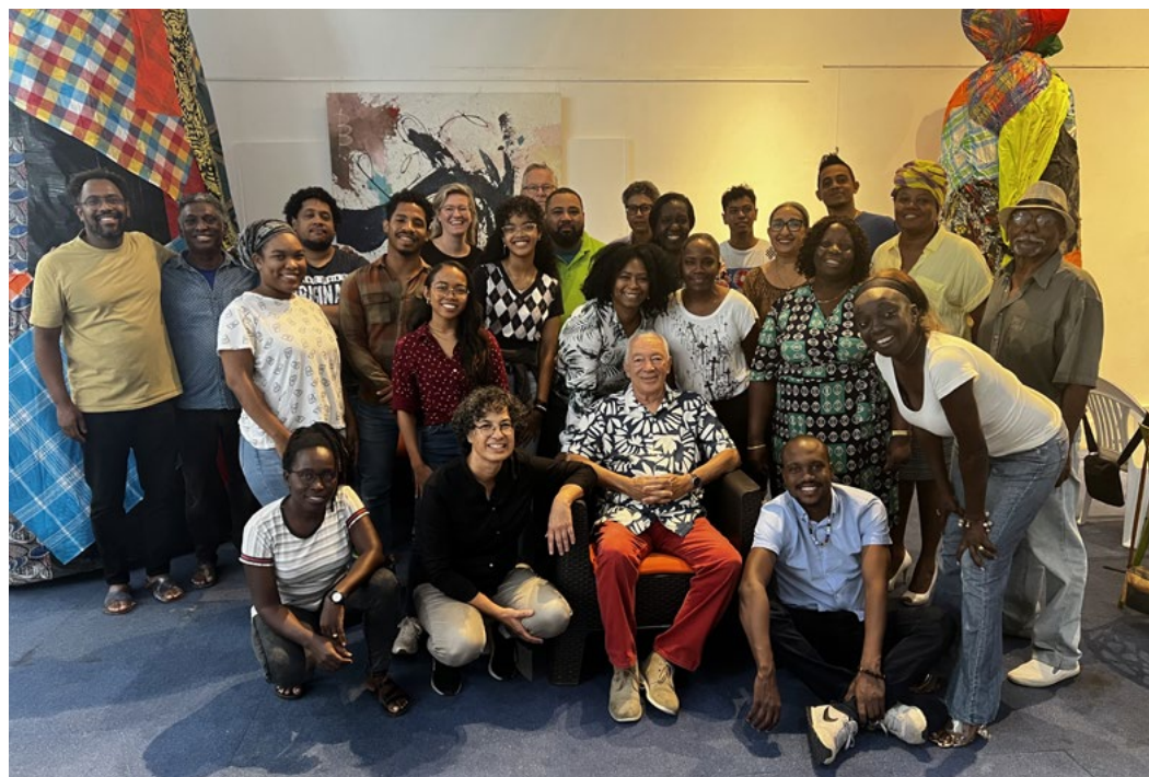
Project Doculab '10 voor 50', georganiseerd door Filmfonds, Netherlands Film Commission en Stichting The Back Lot.

De creatieve industrie is een levendige economische topsector. Deze draagt met diverse instrumenten bij aan marktontwikkeling, marktverruiming, benutting en internationale promotie, het laatste via het internationale programma CreativeNL . 37 De Nederlandse ontwerpende aanpak heeft een grote vlucht genomen. Het benadert maatschappelijke vraagstukken in eerste instantie als een ontwerpogave, waarbij op nieuwe manieren wordt gekeken naar uitdagingen en problemen. Ook de digitale cultuur is sterk in opkomst en draagt bij aan culturele vernieuwing.