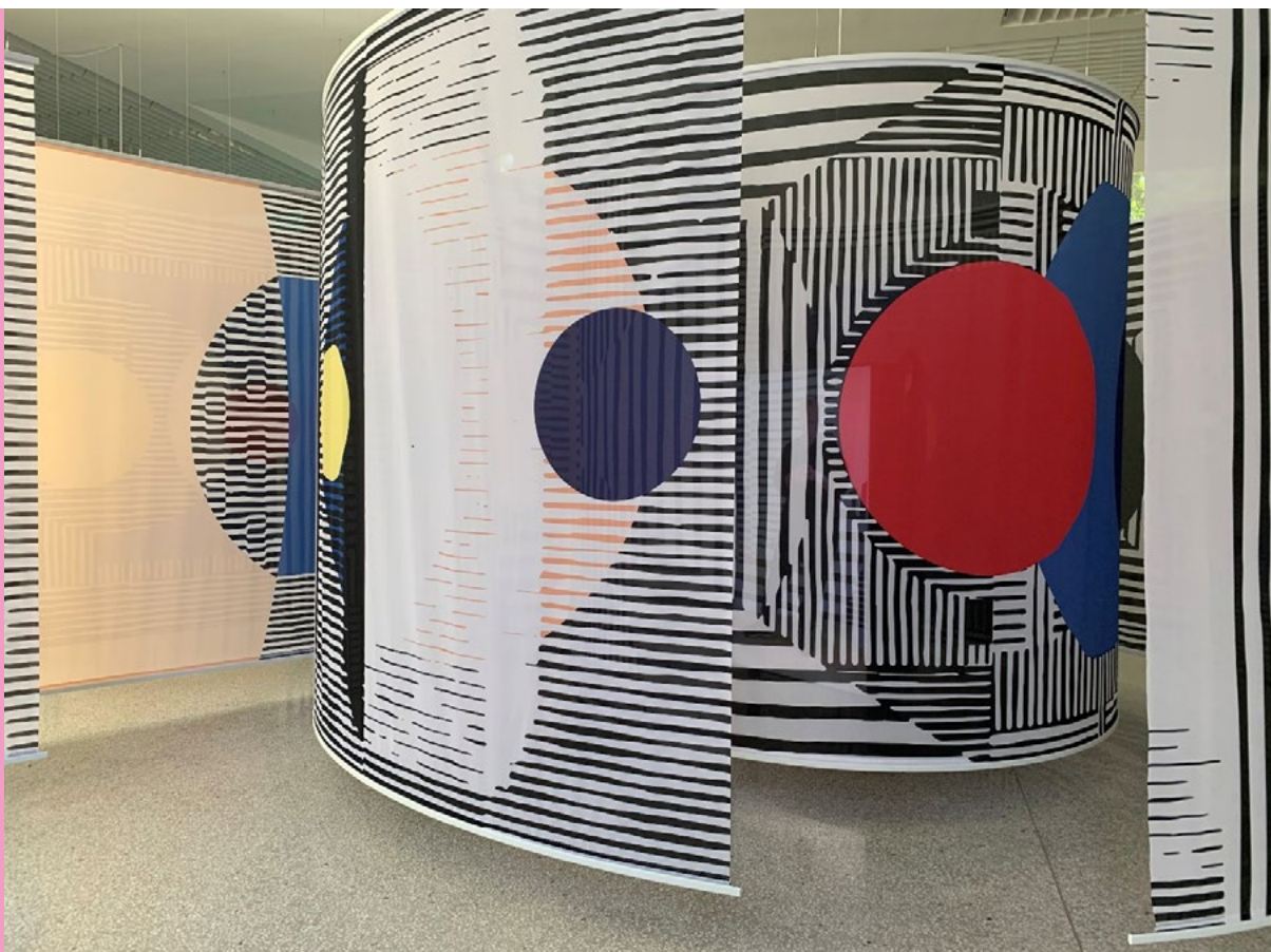
“Space of Other”. Concept en design door Afaina de Jong en InnaVisions. Onderdeel van “Who is We? Nederlandse paviljoen op de 17e Internationale Architectuurtentoonstelling” – La Biennale di Venezia.