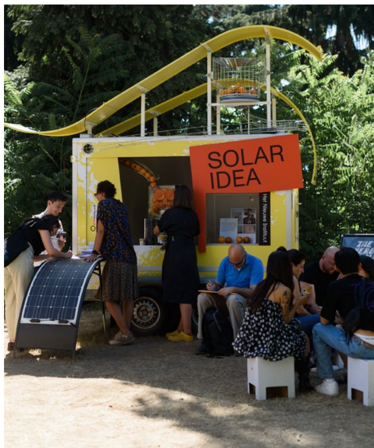
The Solar Energy Kiosk* op Salone del Mobile, Milaan.

In het ICB staat duurzaamheid centraal. Nederland heeft het Klimaatverdrag van Parijs geratificeerd en vervolgens in de nationale klimaatwet vastgelegd in 2050 klimaatneutraal te zijn. 19 Ook de culturele sector draagt hieraan bij. 20 We werken aan ecologische verduurzaming, oftewel het verkleinen van de klimaatimpact, het verbruik van energie en grondstoffen en de daar uit voortkomende vervuiling en uitstoot van broeikasgassen. We werken ook aan sociale verduurzaming, ten aanzien van duurzame waardeketens, goede arbeidsrelaties, eerlijke betaling en het creëren van duurzame samenwerkingsrelaties met partners in het buitenland. 21