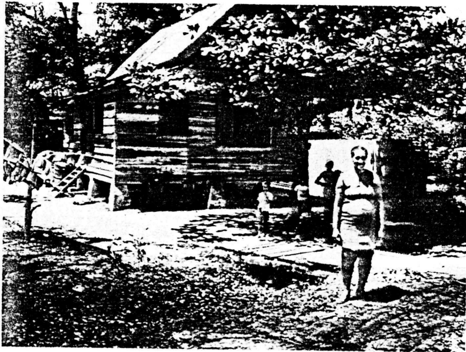
De behuizing van mevrouw Thijm in Paramaribo

nemers aan het project, situaties te laten vergelijken met de positie van andere cultureel en/of economisch gediscrimineerde groepen of volken, ook in Nederland. Op deze wijze kan wellicht een houding van actieve solidariteit bereikt worden. Het basismateriaal wordt desgewenst beschikbaar gesteld aan actiegroepen, culturele instellingen en onderwijsinstututen elders. Docenten of scholen van LBO, MAVO, HAVO en VWO kunnen op aanvraag het bronnenmateriaal en twee lesbrieven gratis via de boekhandel toegezonden krijgen. Men biedt ook nog de mogelijkheid aan na afloop van dit onderwijsproject met begeleiding van medewerkers van participerende instellingen aansluitende onderwijsprojecten te realiseren, teneinde het mondiale vormingsproces in gang te brengen of te houden, waarvoor zoals gezegd, ook nu weer het in Rotterdam vervaardigde basismateriaal in de vorm van brochures, folders, werkboekjes, leerkit en mini-pakket van de ten-