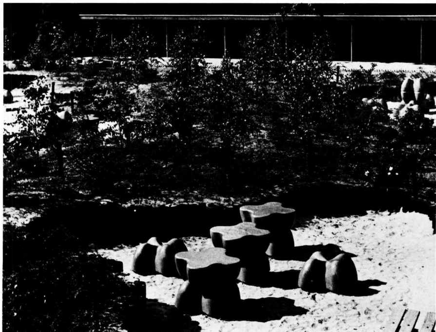
Henk Schuring, speelplaat, 1975, beton, Goor (schoolplein 'Heeckeren')