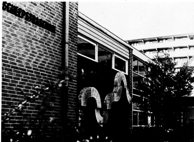
Jan Baetsen, 'Kronkel', 1972, aluminium, 209 x 370 x 25 cm, Enschede (Scheepstraschool)