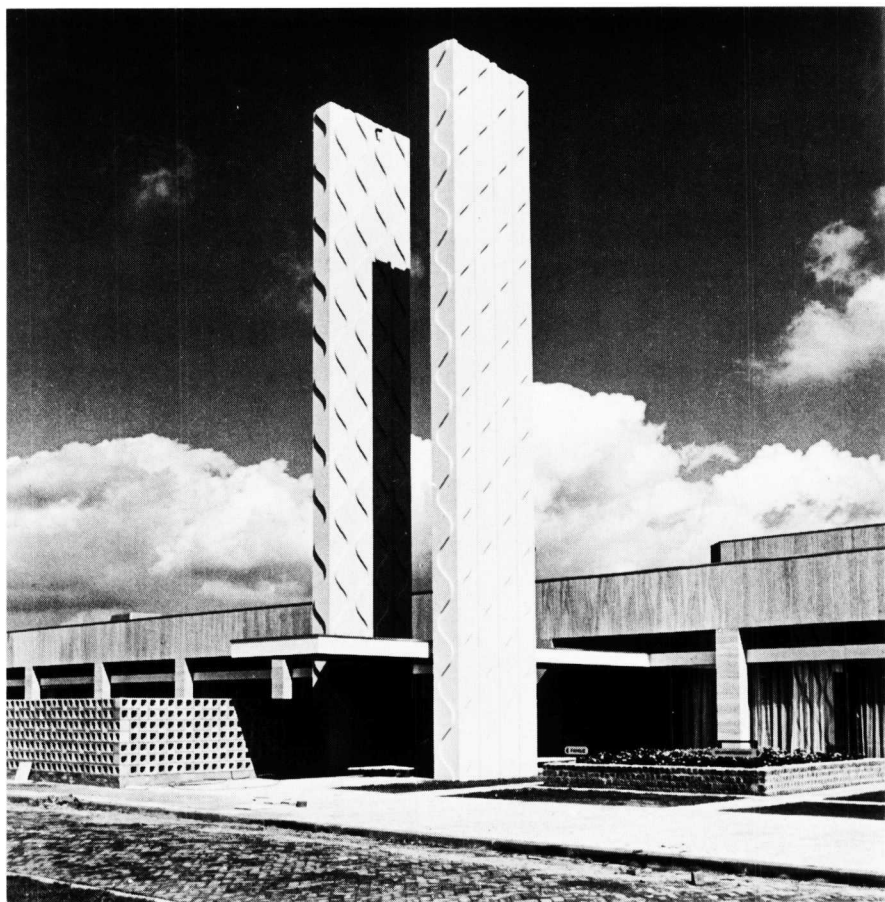
Hans Morselt, reliëfwanden, 1971, beton, 2 x 15 m., Enschede (crematorium)