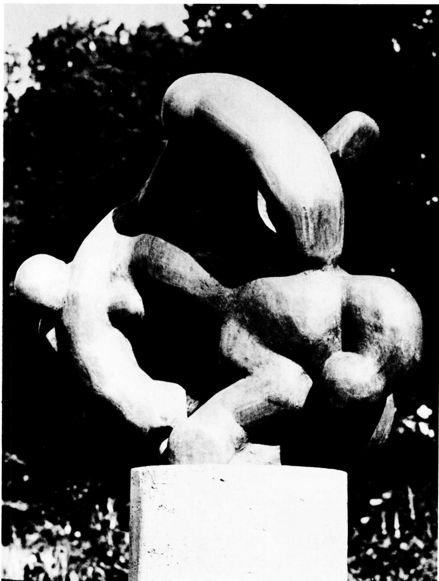
Gooitzen de Jong. Pegasus, 1973, brons, 140 x 130 cm, Enschede (Boswinkel)