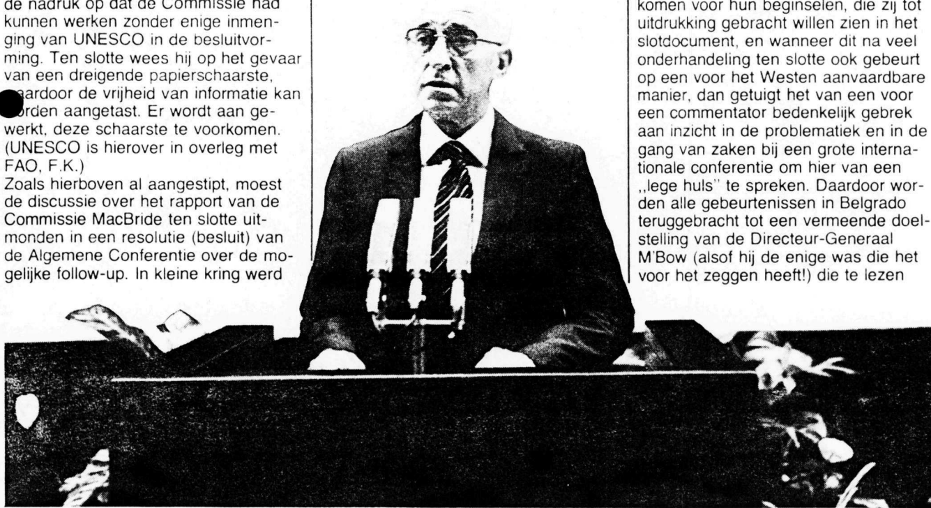
Voorzitter C. Mijatovic van het presidium van Joegoslavië verrichtte de opening van de 21ste Algemene Conferentie van Unesco die in Belgrado is gehouden.

Wanneer nu Westerse vertegenwoordigers (w.o. Nederland) met kracht opkomen voor hun beginselen, die zij tot uitdrukking gebracht willen zien in het slotdocument, en wanneer dit na veel onderhandeling ten slotte ook gebeurt op een voor het Westen aanvaardbare manier, dan getuigt het van een voor een commentator bedenkelijk gebrek aan inzicht in de problematiek en in de gang van zaken bij een grote internationale conferentie om hier van een „lege huls” te spreken. Daardoor worden alle gebeurtenissen in Belgrado teruggebracht tot een vermeende doelstelling van de Directeur-Generaal M'Bow (alsof hij de enige was die het voor het zeggen heeft!) die te lezen