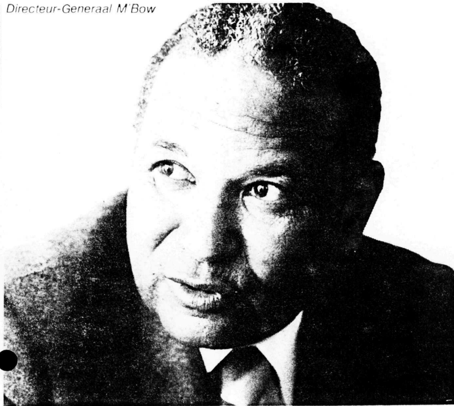
Directeur-Generaal M Bow

de bestaande meningsverschillen over de inhoud van een NIICO opnieuw kon aanwakkeren.