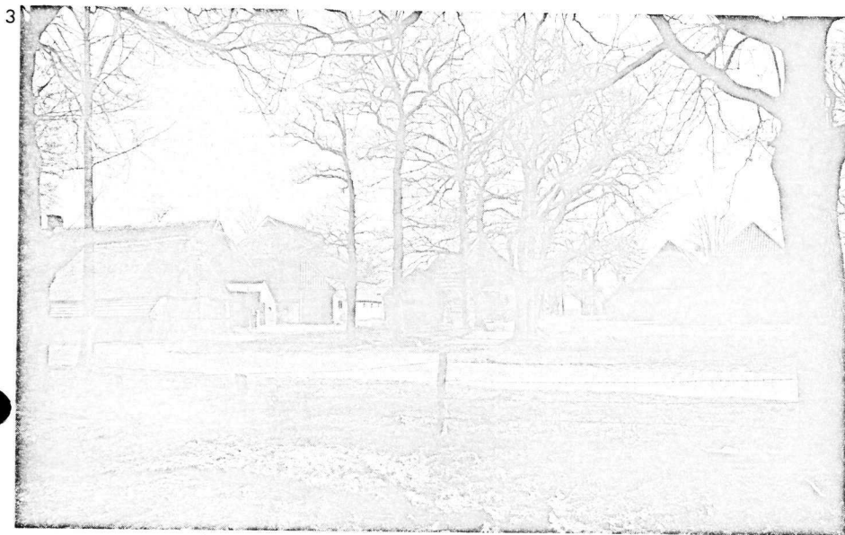
Afb. 3: Ook de „plattelandsbouwkunst” valt onder de monumentenzorg.

Er zijn betrekkingen ontstaan; behalve van deskundigen, óók van verenigingen (Europa Nostra — zie kolom „in de marge” elders in dit nummer — heeft de bundeling van de nationale „Heemschut”-organisaties) en van historische steden in Europa. Veel meer dan vroeger wordt datgene wat in andere landen en steden gebeurt, in het denken betrokken. Er is op het gebied van de monumentenzorg geen verdrag of afspraak, die een voor alle landen bindende gedragslijn inhoudt. Er zijn stapels aanbevelingen op diverse bijeenkomsten opgesteld, die soms een nuttig effect sorteren in een gunstige constellatie, maar meestal snel worden vergeten. Vooral nog ontbreekt het evenwel aan politiek belang en aan geld om aan deze aanbevelingen in internationaal verband gevolg te geven en om de uitvoering in internationaal verband verplicht te stellen. Desalniettemin geven ze uiting aan een algemeen gevoelen, brengen ze telkens weer gemeenschappelijke inzichten en verlangens onder woorden, versterken ze de overtuiging van een ieder die bij de formulering betrokken was dat er iets gegroeid is.