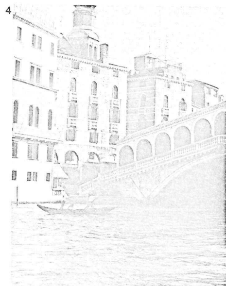
Afb. 4: Het voortbestaan van de fraaie monumenten in Venetië gaat ook ons ter harte.

De vele contacten die er nu zijn, waren er vroeger niet. De vertegenwoordigers op de bijeenkomsten hebben de gewoonte om op te scheppen over wat er in hun buurt voortref-