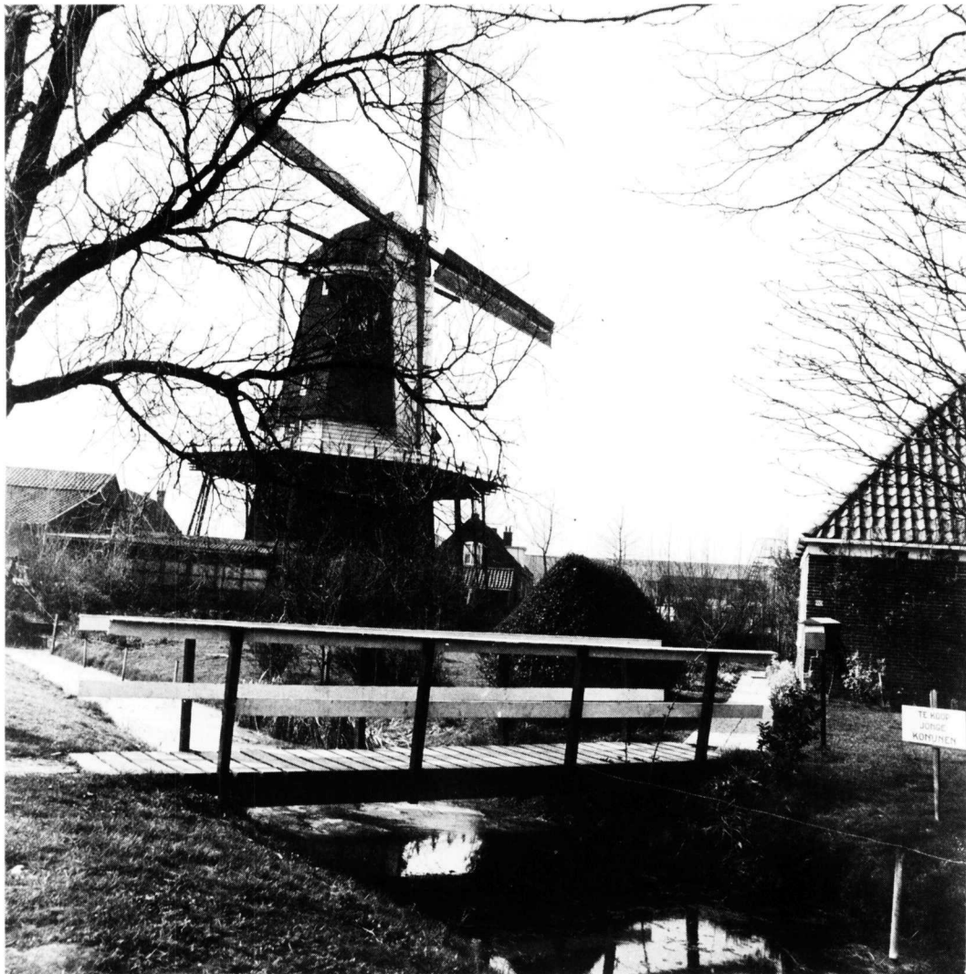
Korenmolen "t Rode Hert" aan de Friesche weg te Oudorp.