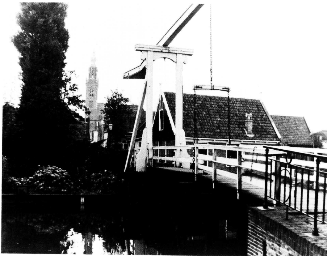
Speeltoren te Edam.

betering van methoden, technieken en capaciteiten op het gebied van de restauratie en de stadsvernieuwing'.