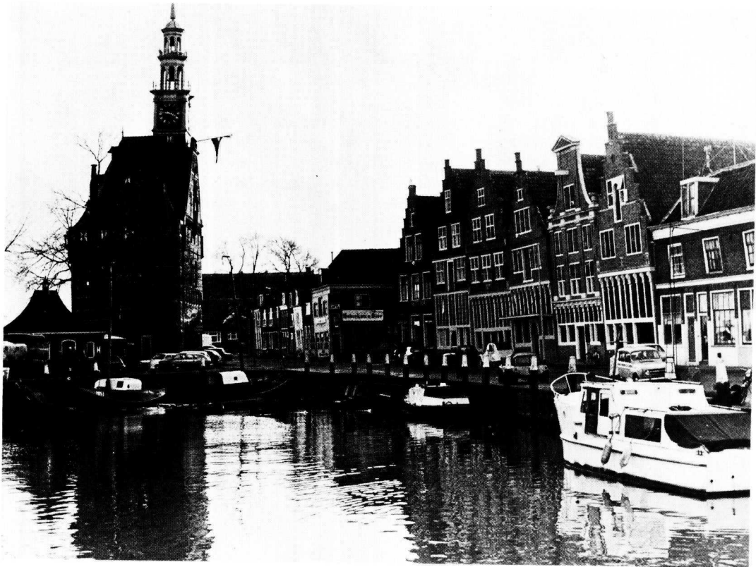
De Hoofdtoren en prachtig gerestaureerde panden aan de Veermanskade te Hoorn.

Deze aangelegenheid zal nog nadere studie vergen, niet alleen om na te gaan, welke juridische consequenties daaraan verbonden zijn, doch ook omdat een aantal monumenten onderverzekerd is, omdat de premies door de eigenaren niet opgebracht kunnen worden (kerken, molens).