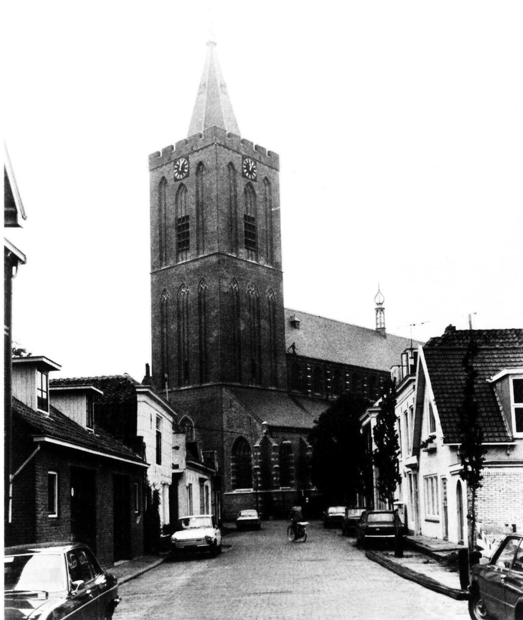
Nederlands Hervormde Kerk te Naarden

Omdat de verhouding grote restauraties: kleine restauraties naar 50 : 50 tendeert, dient er een aftrek plaats te vinden van 50% zodat op basis van een gemiddeld provinciaal subsidiepercentage van ca. 8% een bedrag ten behoeve van de kleinere monumenten noodzakelijk is van ca.