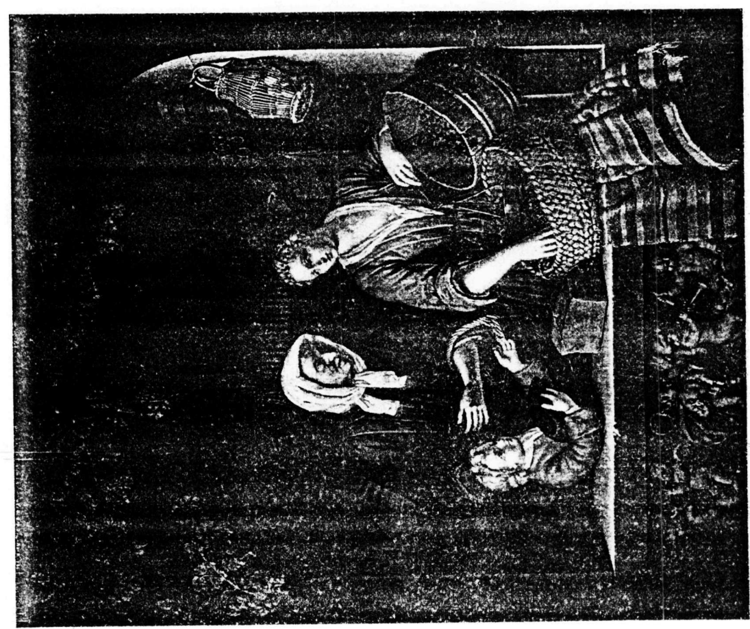
Afb. 3. Frans van Mieris de J., De kruidenierswinkel (1715)