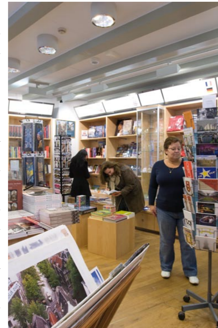
De nieuwe winkel van Athenaeum Boekhandel in het AHM.

Op 19 juni werd in het AHM voor de vierde keer de zeer goed bezochte Veteranendag van de Gemeente Amsterdam gehouden, waarbij burgemeester Cohen een toespraak hield.