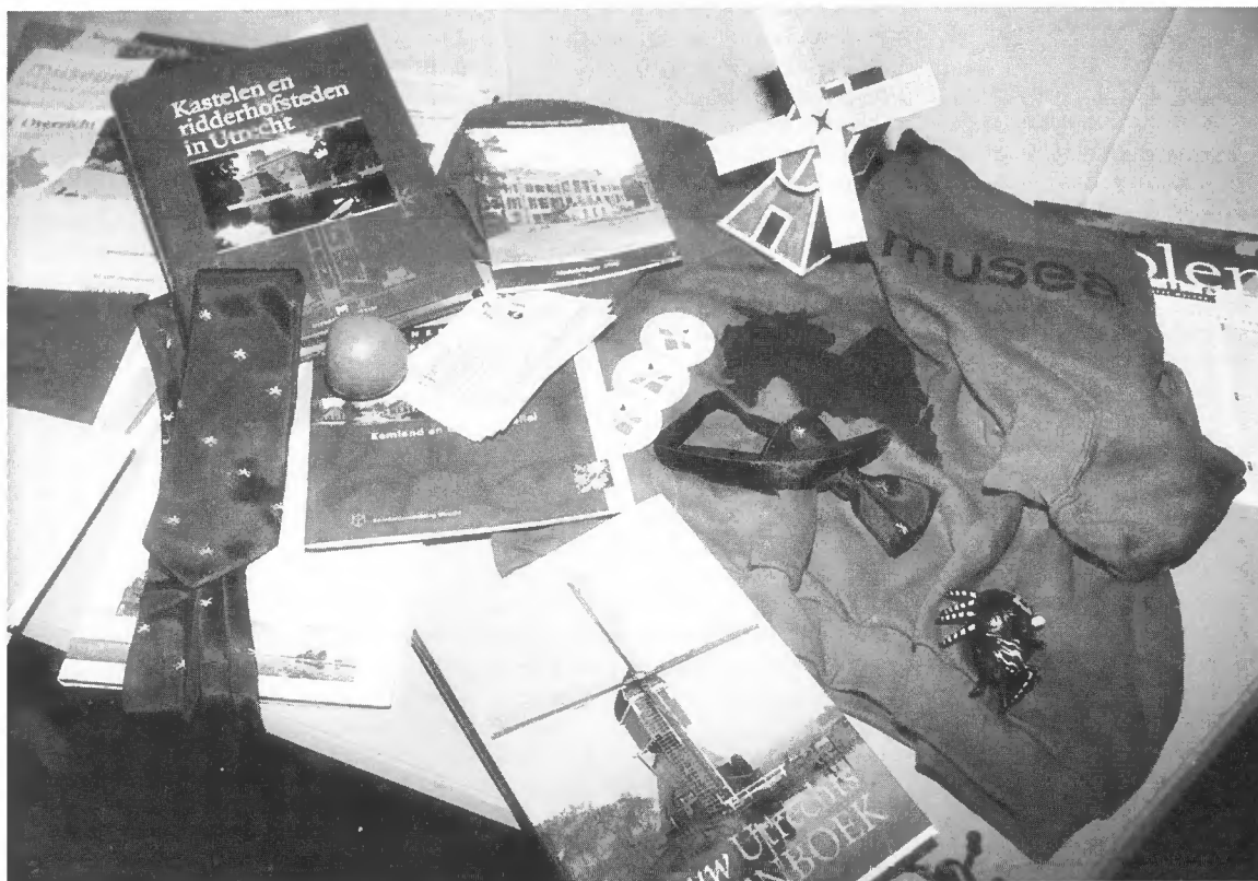
Producten van de Federatie Stichts Cultureel Erfgoed.