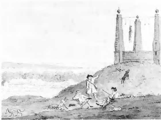
Galg in omgeving van Amersfoort. Tekenaar onbekend.

bereiding is een voorlichtingsbrochure, waarin inwoners van de provincie worden geattendeerd op het nut en het genoeg van archiefbewaarplaatsen.