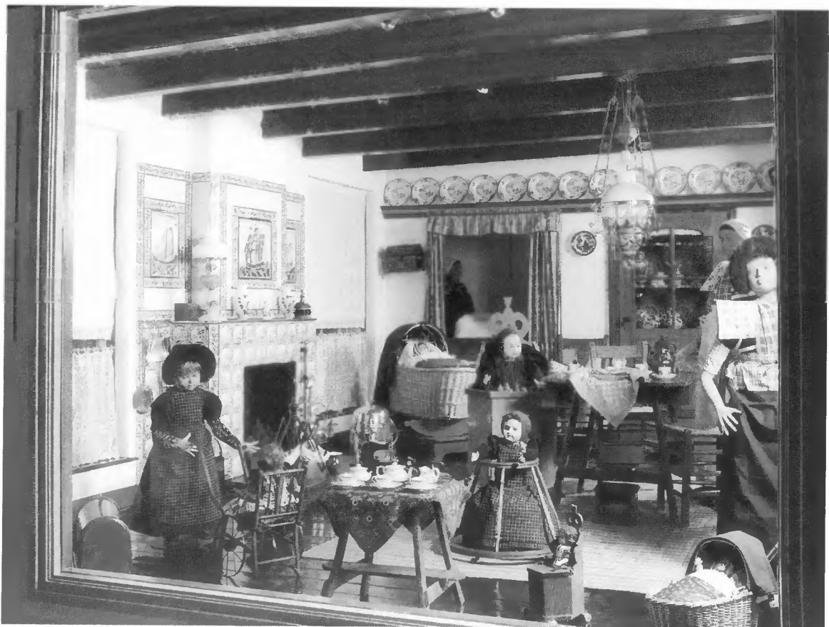
Museum 't Vurhuus, Spakenburg.

Behalve op kwaliteitsverbetering is het beleid gericht op mede-instandhouding van musea die de krachten van een gemeente te boven gaan. In de Museumnota 1986 werden drie kasteel-musea en één gemeentelijk museum geselecteerd: