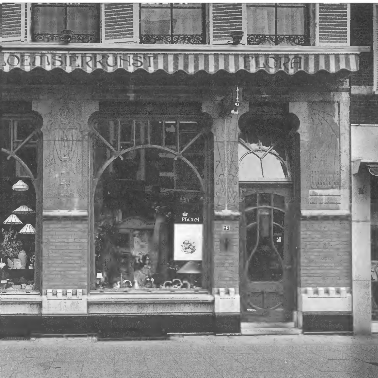
Gemeenten kunnen goede sier maken met monumentenzorg... (Jugendstilpui 1905 aan de Diezerstraat te Zwolle)

Eind 1994 heeft de NCM als voorbereiding op deze studiedag een inventariserend onderzoek laten verrichten naar gemeentelijke internationale samenwerking op het gebied van mo-