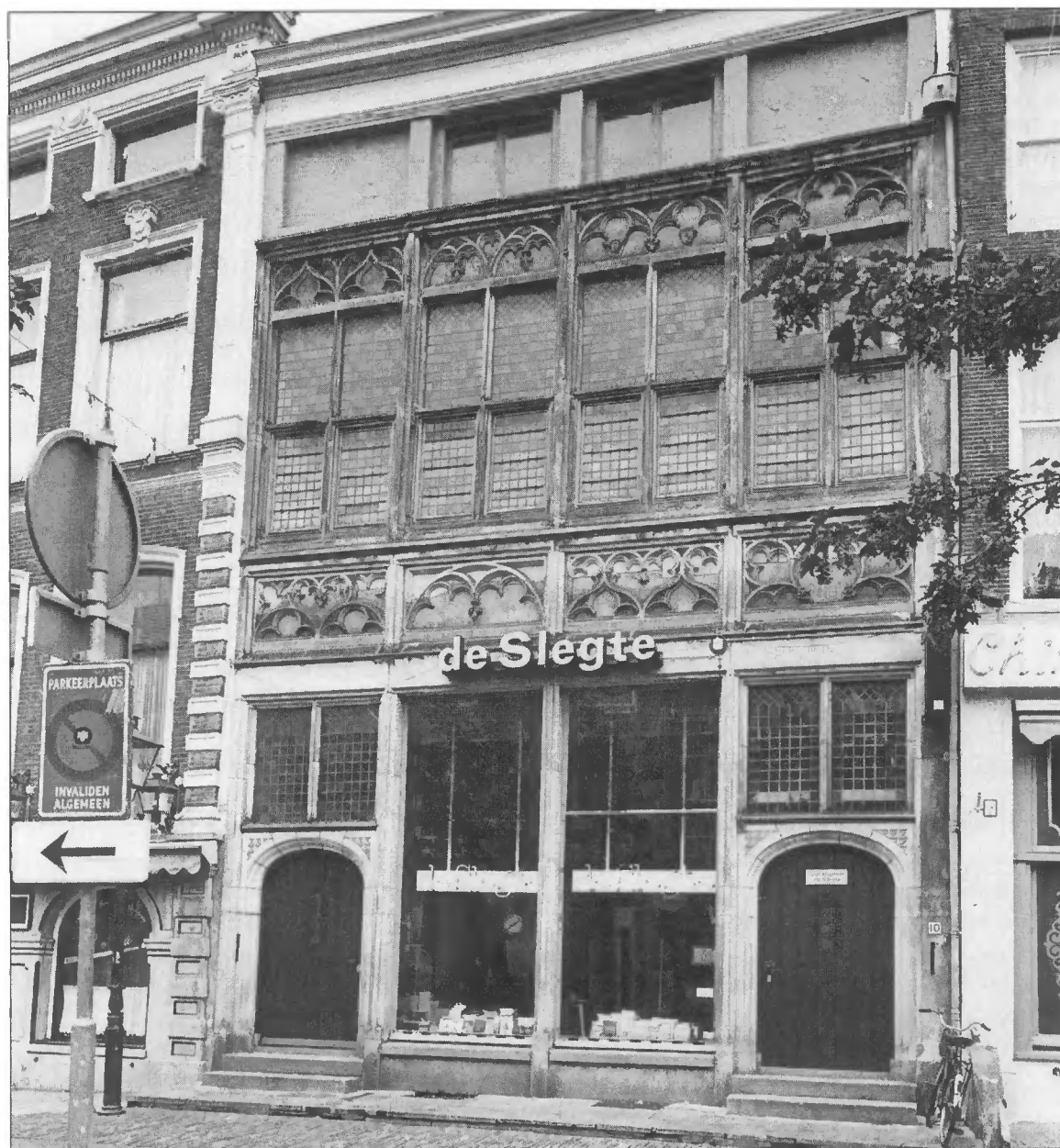
Een Europees boekje open doen... (Gotisch huis aan de Melkmarkt te Zwolle)

tiviteiten te analyseren. Deze laatste werden aan een reeks criteria onderworpen opdat ze zouden beantwoorden aan het subsidiariteitsbeginsel. Allereerst dienden de voorstellen gekenmerkt te zijn door hun Europese dimensie en betrekking hebben op thema's of problemen die voor alle lidstaten relevant waren. Het moest ook meteen duidelijk zijn dat een gemeenschappelijke, d.w.z. communautaire, aanpak voordelen bood ten opzichte van een aanpak op nationaal niveau. De voorstellen dienden tegemoet te komen aan reële behoeften én overeen te stemmen met de prioriteiten van de nationale en/of regionale administraties. Tenslotte dienden zij de internationale samenwerking te bevorderen en uiteraard com-