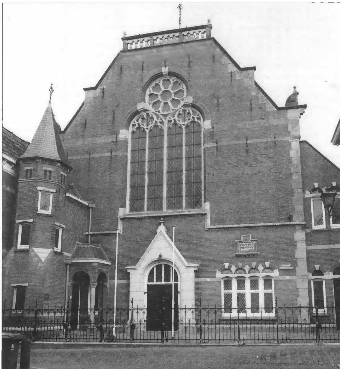
Synagoge 1898 (aan de Schoutenstraat te Zwolle)

Eén van de laatste projecten uit 1994 is de zorg voor de restauratie van de Sankt Niklaus Kirche in Nowgorod in Rusland. Als internationaal symbool zullen vele Hanzesteden een deel van de kosten opbrengen om deze omvangrijke restauratie te bekostigen.