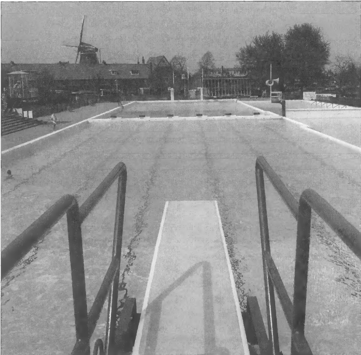
Internationale samenwerking van particuliere organisaties, un mer á boire... (Openluchtbad, G.J. Wiebenga, Zwolle 1933, Rijksmonument sinds 1994)

Een echte pressiegroep op internationaal niveau zal de monumentenzorg in z'n algemeenheid, vrees ik, nooit worden. Op nationaal niveau lukt dat al nauwelijks, ofschoon