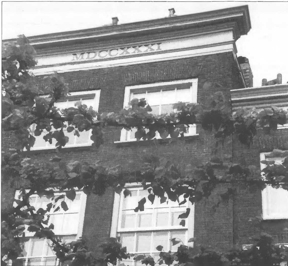
Gedateerde Noordse gevel

onze leefomgeving. Steeds meer mensen zien dat belang in.