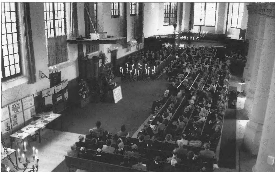
Augustijnen- kerk te Dordrecht