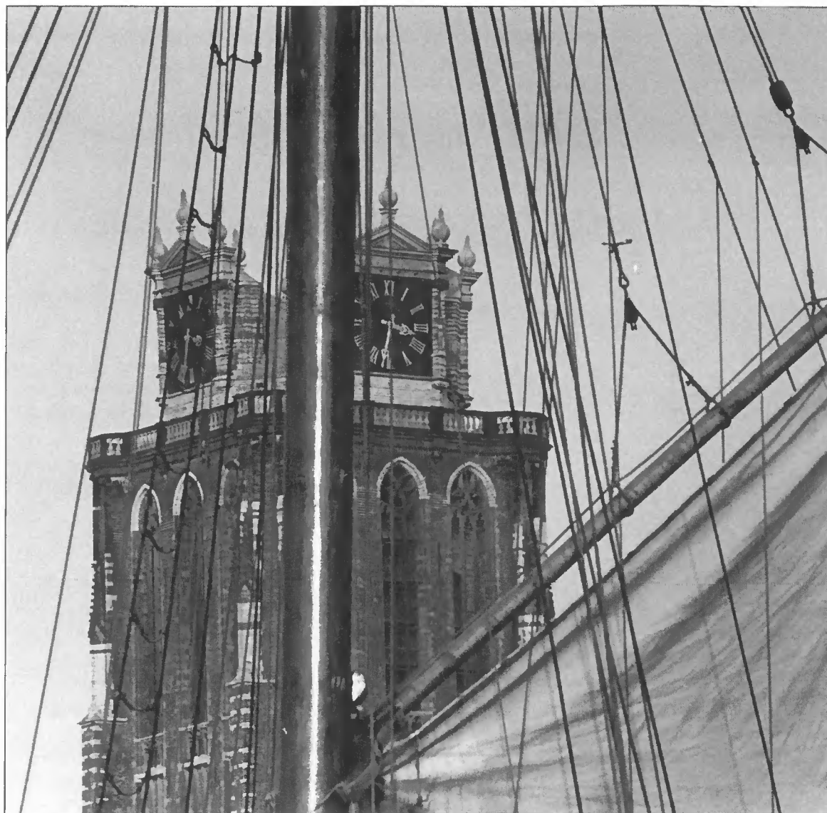
Dordrecht, toren van de Grote Kerk

culier initiatief, het bevorderen van het cultuurhistorisch besef bij de jeugd en het interesseren van de media voor het onderwerp. Ook draagvlakverbreding en actieve participatie zijn immers randvoorwaarden voor een effectieve monumentenzorg. De in september op te richten Vereniging Open Monumenten kan daarbij een belangrijke rol vervullen.