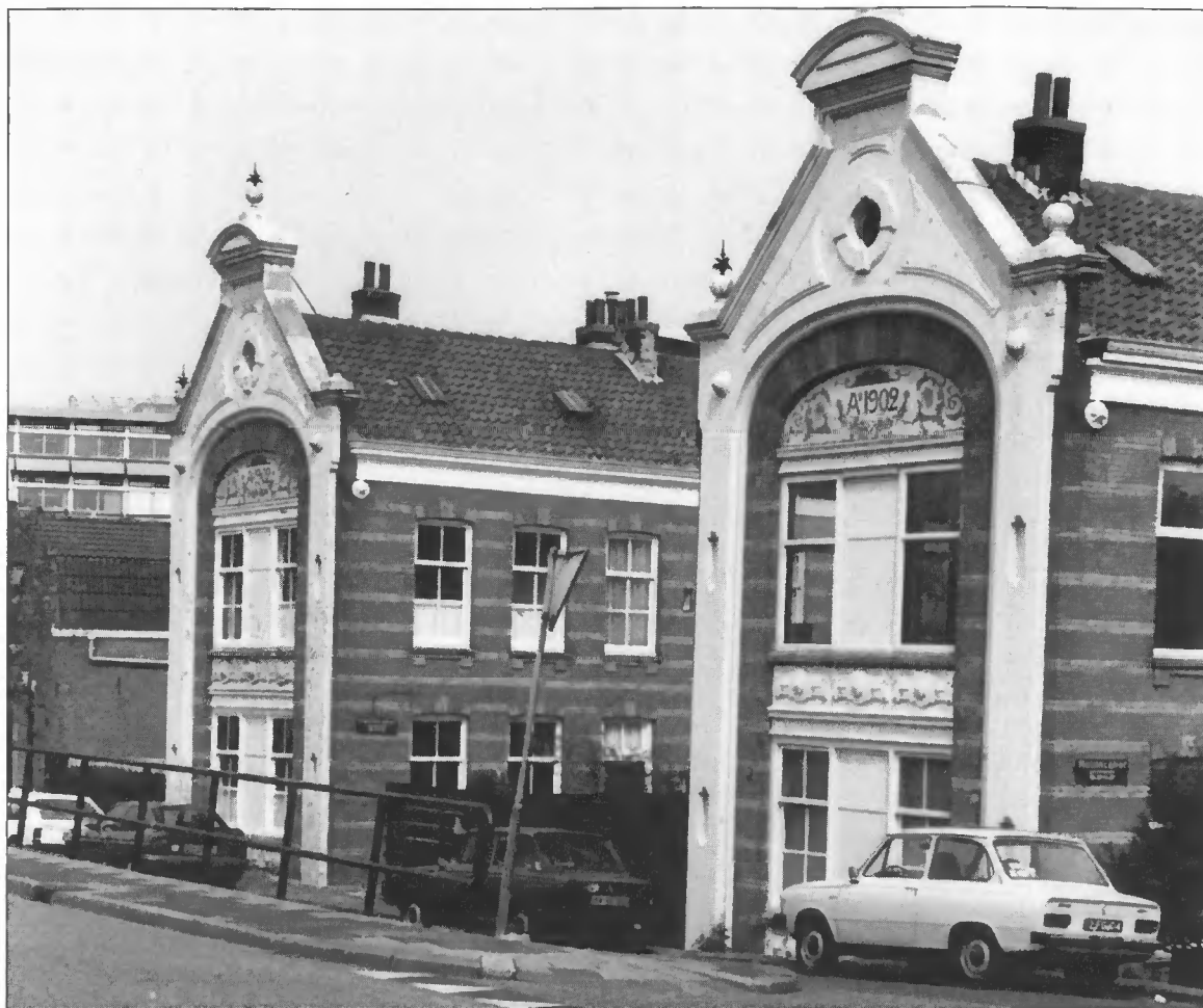
Dordrecht, Hallinck- hof (1902)

ben jullie het zo ver kunnen laten komen!" 6