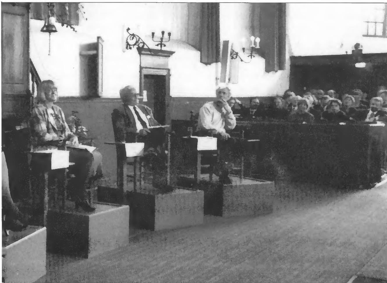
De forumleden van links naar rechts:

Samenvattend kan worden gesteld dat de eerste reacties van de politiek op het Strategisch Plan zeer positief heeft gereageerd op het Strategisch Plan. Het is verheugend dat monumentenzorg een brede politieke steun ondervindt. Benadrukt werd het positieve uitstralingseffect van monumentenzorg op de kwaliteit van de gebouwde omgeving en daarmee op de kwaliteit van het menselijk bestaan.