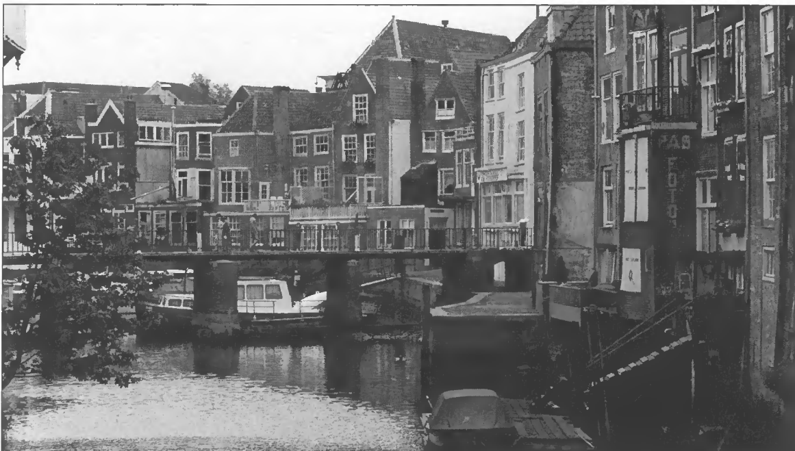
Dordrecht, stad in het water

Daarnaast zijn maatregelen ontworpen, die de effectiviteit van de budgetverdeling naar gemeenten moeten verhogen en ervoor moeten zorgen dat de middelen daar terecht komen, waar de nood het hoogst is. Het meerjarenprogramma van de gemeente krijgt in die nieuwe systematiek een nieuwe inhoud en daarmee een centrale rol. De gedachte is, de middelen toe te delen op basis van de vastgestelde behoeften, zoals de gemeenten die in hun meerjarenprogramma's tot uiting brengen. Dat betekent dus een verandering ten opzichte van de huidige situatie waar het budget