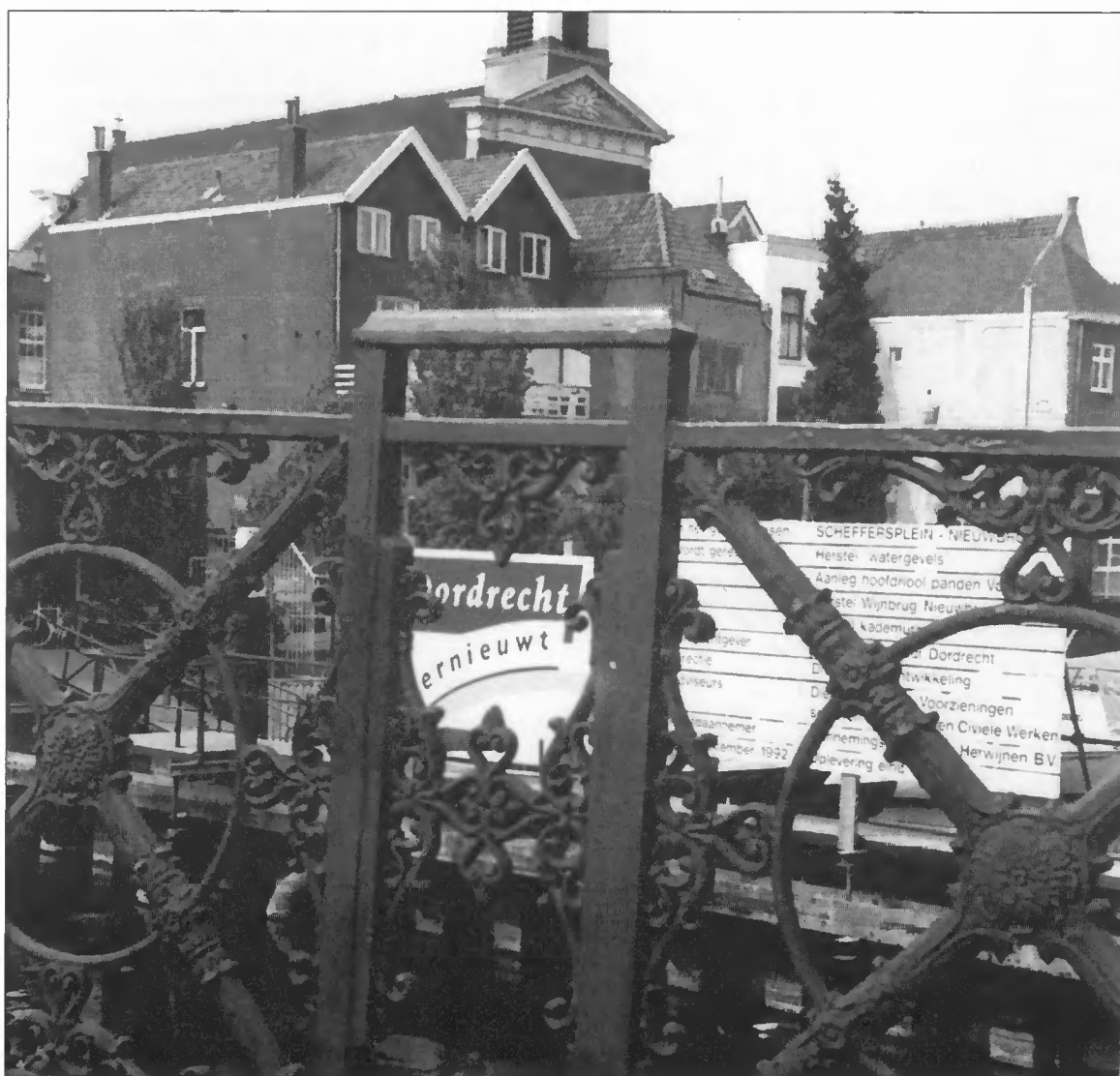
Dordrecht, oud en nieuw

Ik kom terug op de voorwaardenscheppende rol van de rijksoverheid. Die rol ken-