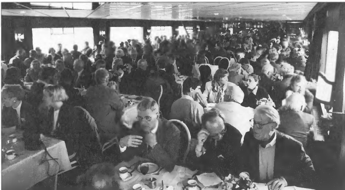
De lunch aan boord van het M.S. Eureka.

Boekmanstichting - Bibliotheek Herengracht 415 1017 BP Amsterdam Tel. 6243739