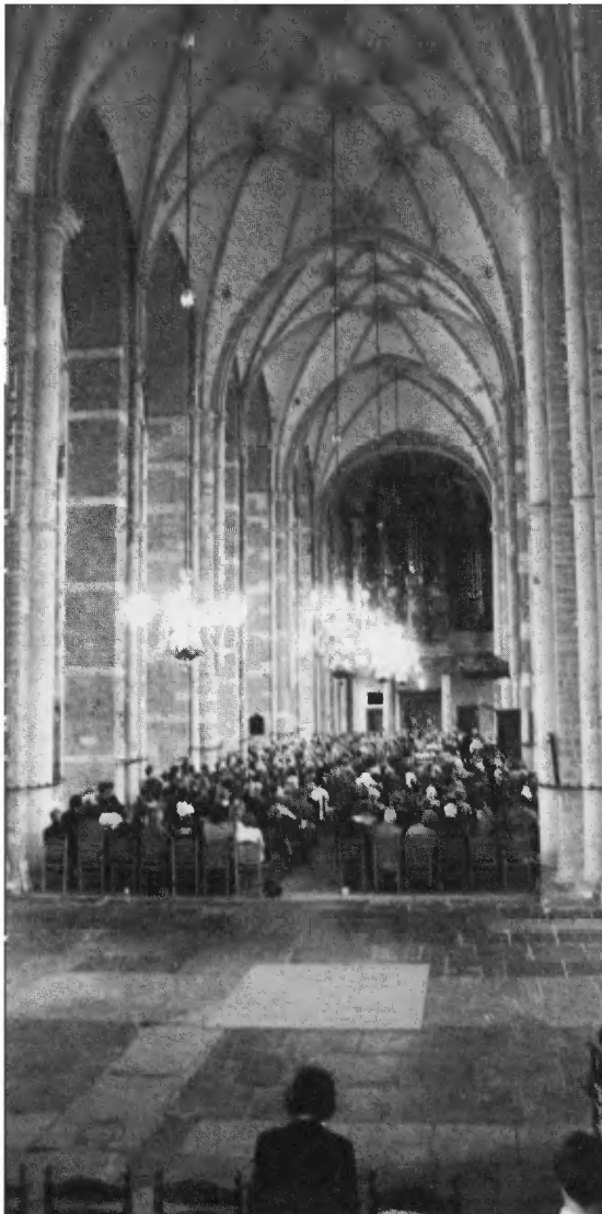
Interieur van de Grote of Lebuïnuskerk in Deventer.

De centrale vraag is dan ook: 'hoe kunnen beheerders van monumenten en historische steden en dorpen meedelen in de opbrengsten van het cultuurhistorisch toerisme, zodat zij (beter) in staat zijn hun cultuurhistorisch erfgoed in stand te houden en voor het toerisme toegankelijk te maken. ●