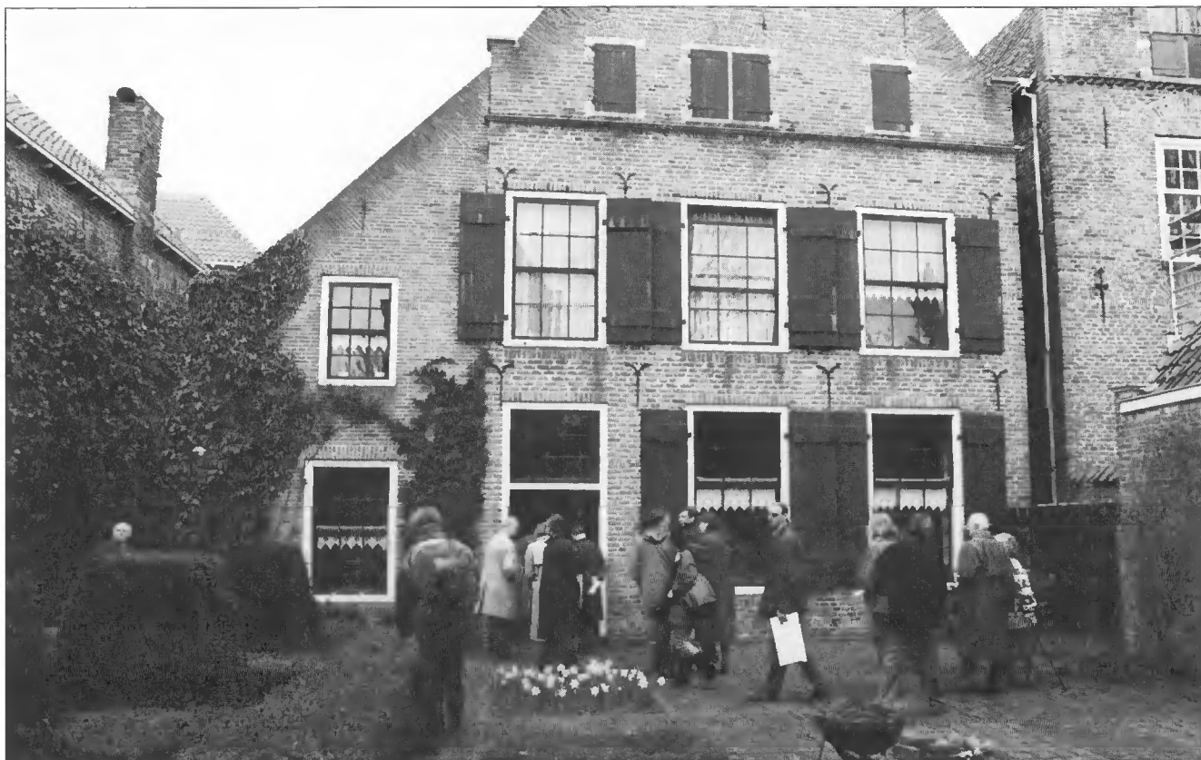
Deelnemers studiedag tijdens rond- wandeling in Deventer.

houden, de verkeerde evoluties afremmen.