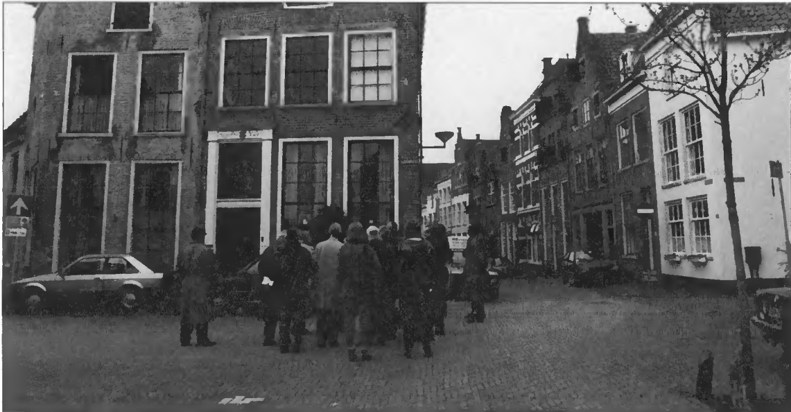
Rond- wandering in het Berg- kwartier.

ling daarvan bezig houdt merkt de grote behoefte aan dit soort producten zowel bij de bestuurders als bij het bredere publiek.