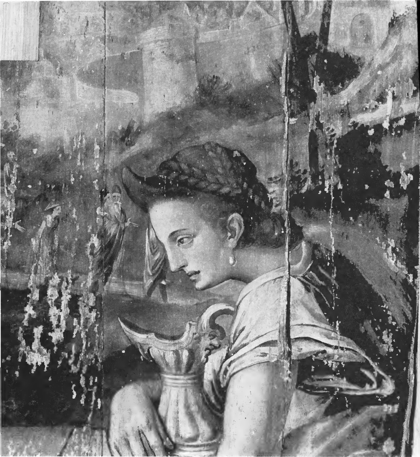
Drieluik 'De Samaritaanse vrouw'. Detail middenpaneel. Maastricht, Bonnefantenmuseum.