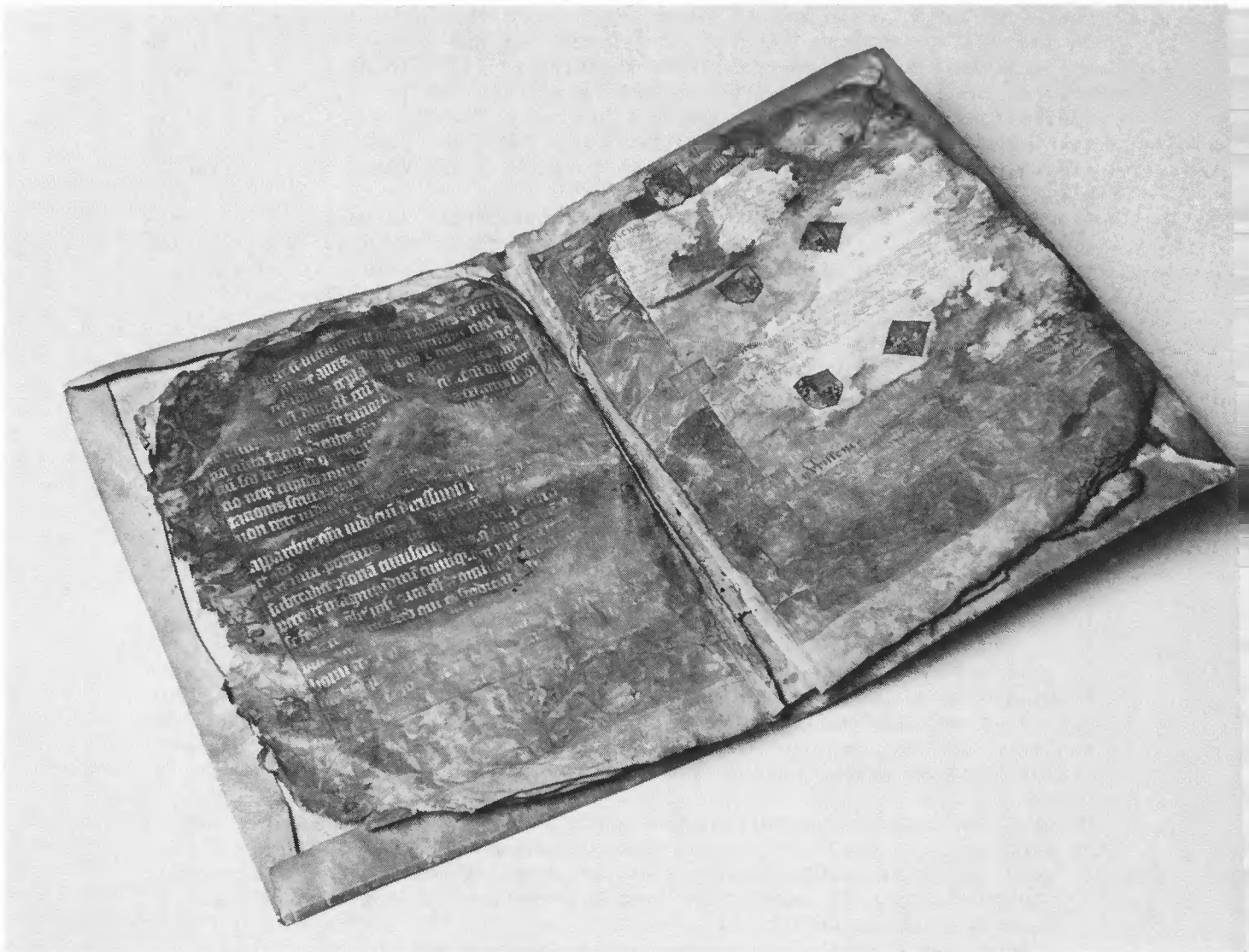
Privilegeboek uit 1514, Wapenboek van Delfland. Delft, Hoogheemraadschap Delfland.