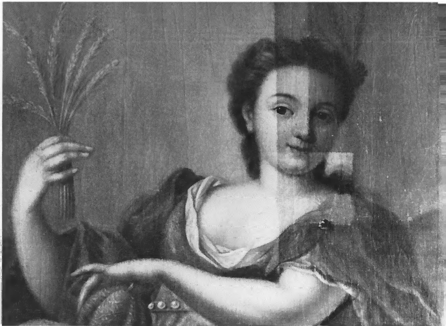
Doekplafond. Detail, gedeeltelijk schoongemaakt. Dhr. Rappange, Keizersgracht 64, Amsterdam.