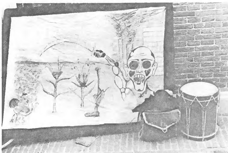
„zonder BKR geen vernieuwing“

EEN INTERVIEW MET EEN WETHOUDER UIT EEN MIDDELGROTE STAD